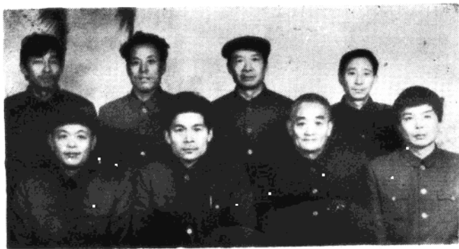
编纂领导小组人员(缺一)合影