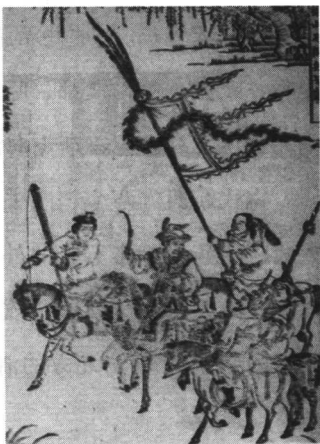
安禄山反叛兵戈举（明刻）

755年11月11日，这是伟大的长安帝国转折性的历史时刻，自此以后，帝国的态势由扩张变为防守，同时受到帝国内部反叛不断的困扰，直至它最后消亡。755年的这一历史事件给中国这块土地上的各民族带来了权力格