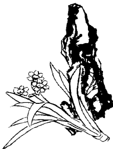
图1-1 水仙: 仙风道骨

宋高似孙(1160~1234年)作《水仙花前赋》其中“亦有帝女兮泣竹,湘君兮鼓弦,神妃兮解珮,冰夷兮扣舷。是皆凝姿约素,挺粹含