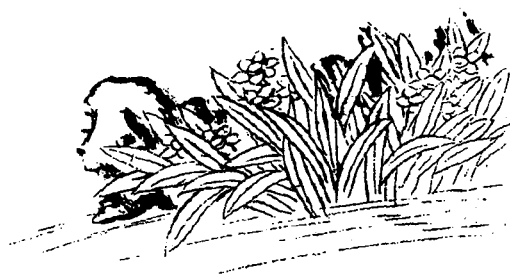
图1-2 水仙: 凌波仙子