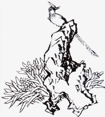
图2-1 水仙又名雅客、天葱、玉玲珑

玉玲珑 宋司马光《其日雨中闻姚黄开》诗：“谷雨后来花更浓，前时已见玉玲珑。”此指牡丹。元刘秉忠《江边梅树》诗：“素艳乍开珠蓓蕾，暗香微度玉玲珑。”此指梅花，亦指水仙。宋吴文英《燕归梁·书水仙扇》词：“白玉搔头坠髻鬆，和春带出芳枳。为分弱水洗尘红，低回金叵罗，约略玉玲珑。”此指“千叶”水仙花(图2-1)。