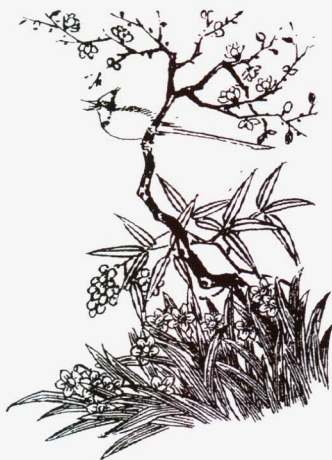
图1-3 水仙花，江南处处皆有之

清代李渔《笠翁偶集》：“水仙花以秣陵(又名金陵，治所在今江苏江宁)为最。予之家于秣陵，非家秣陵，家于水仙之乡也”他以家乡水仙出名引为自豪，并声称“金陵水仙，为