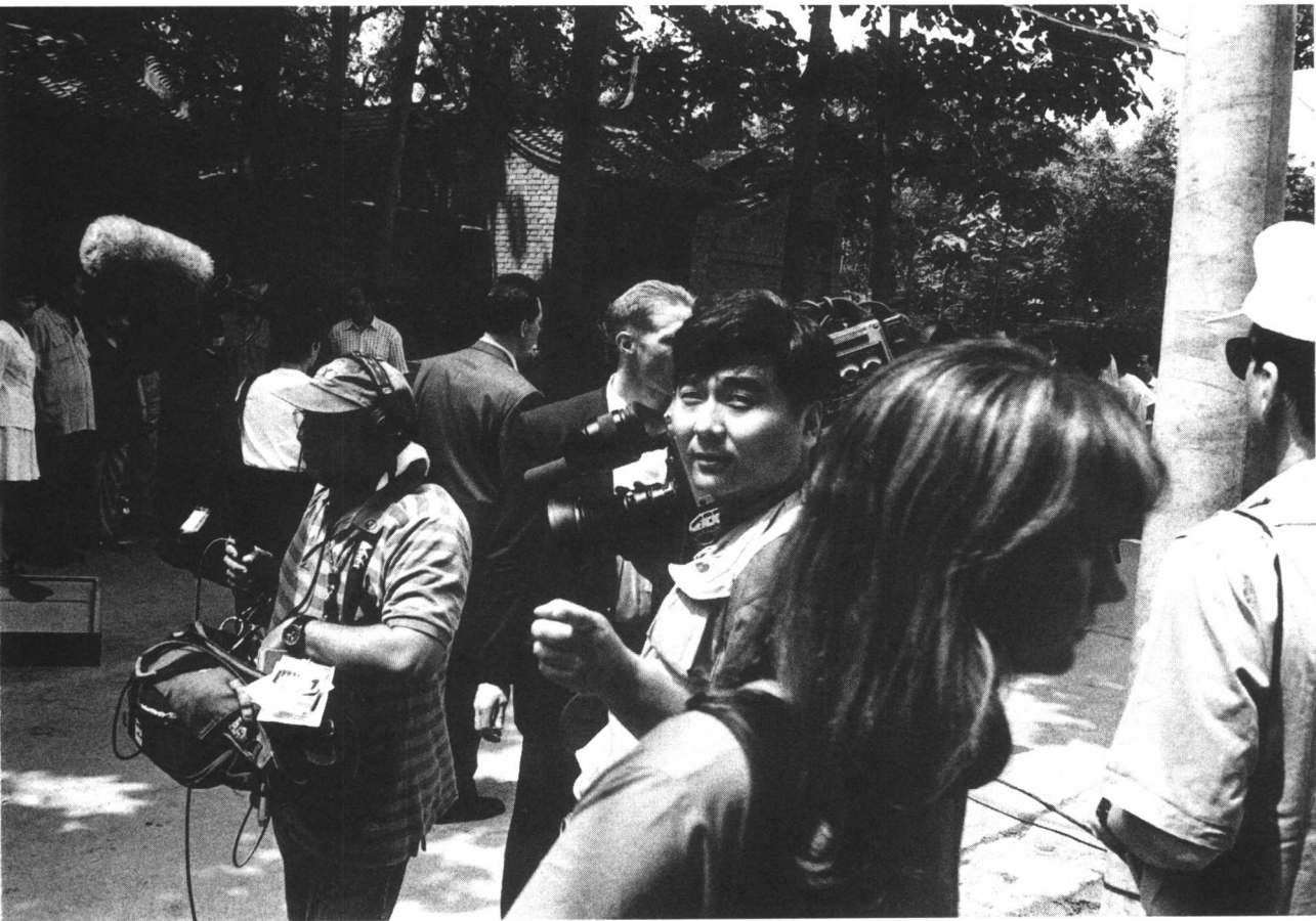
作者在工作采访现场