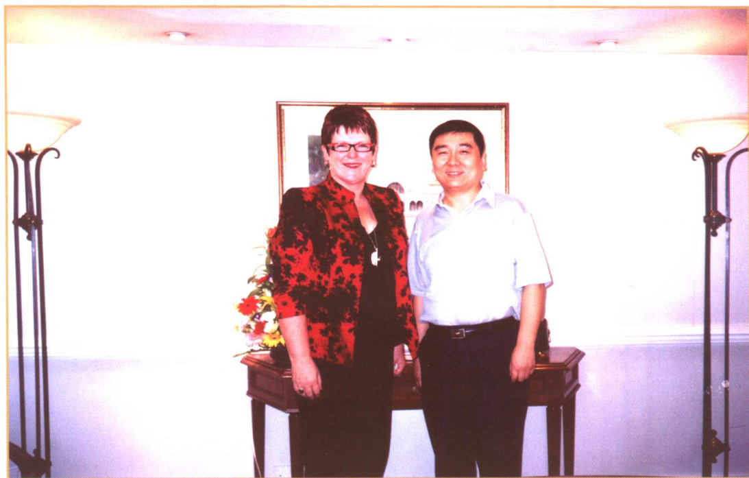
同新西兰前总理希普莉合影