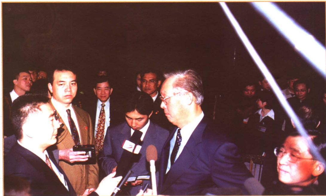
专访新加坡总理吴作栋（前左为作者）