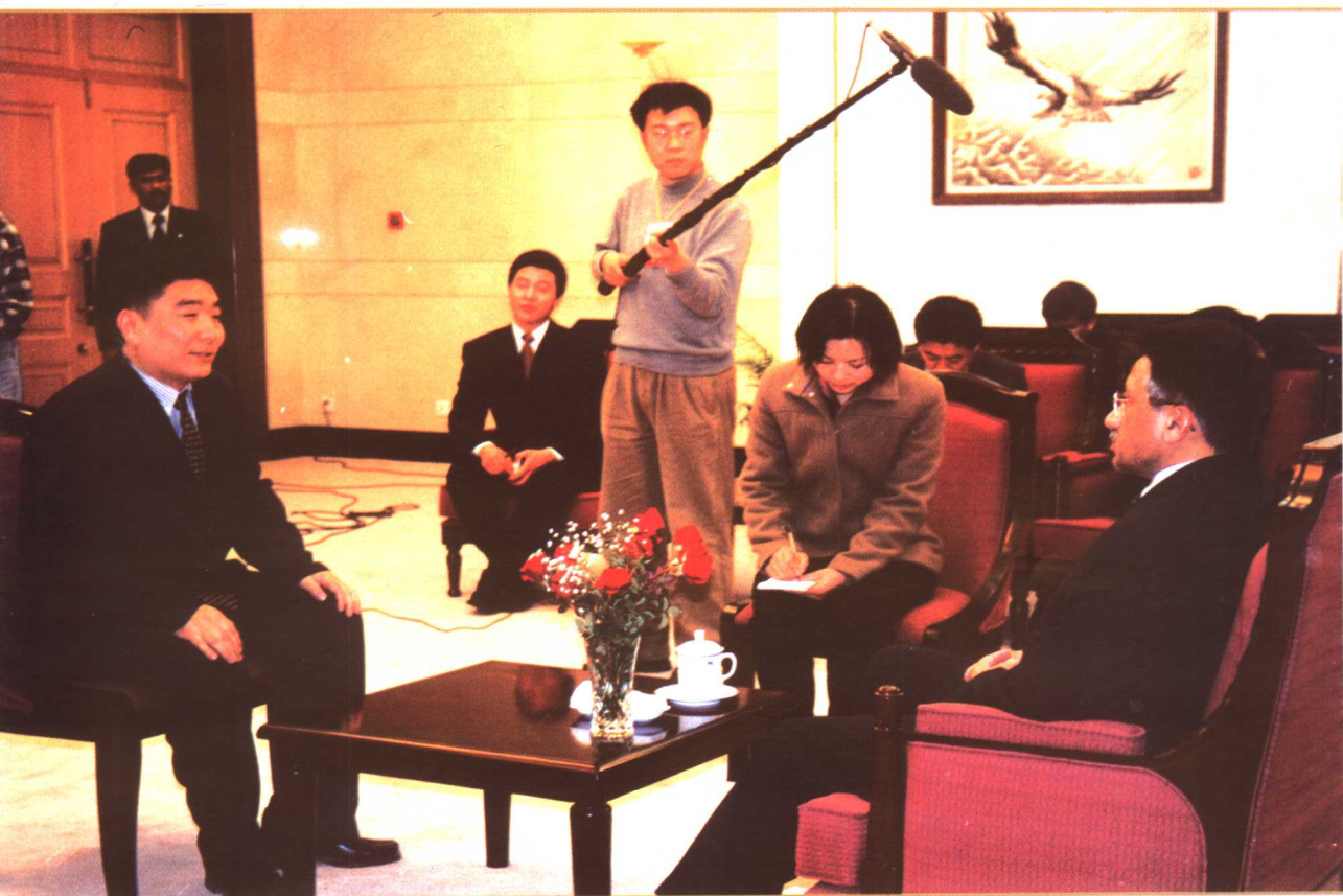
专访巴基斯坦总统穆沙拉夫（左为作者）