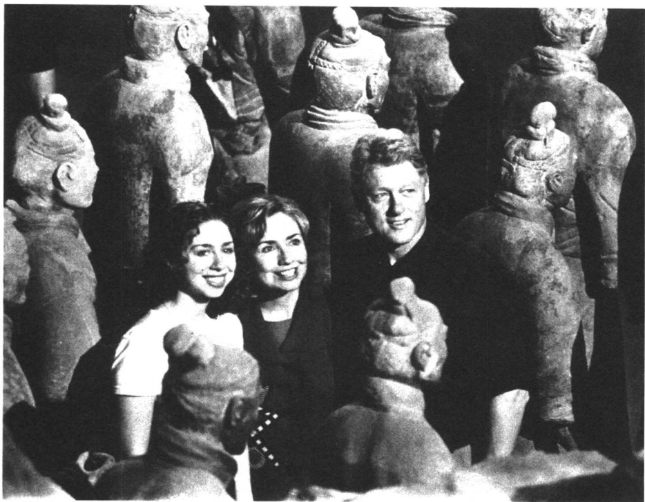
美国总统克林顿同夫人希拉里、女儿切尔西在秦始皇兵马俑博物馆一号坑内