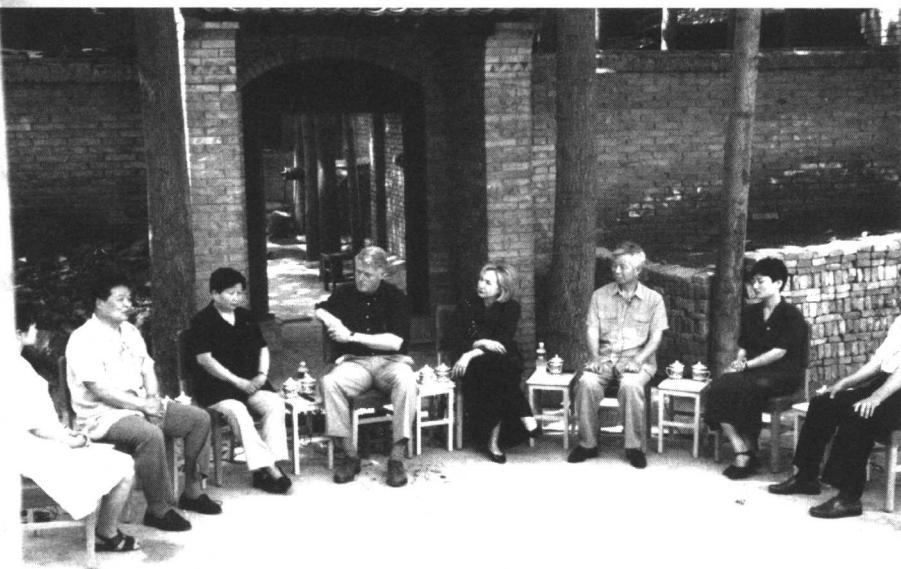
美国总统克林顿同夫人希拉里在西安临潼下和村同村民和西安市民在“圆桌会议”上座谈