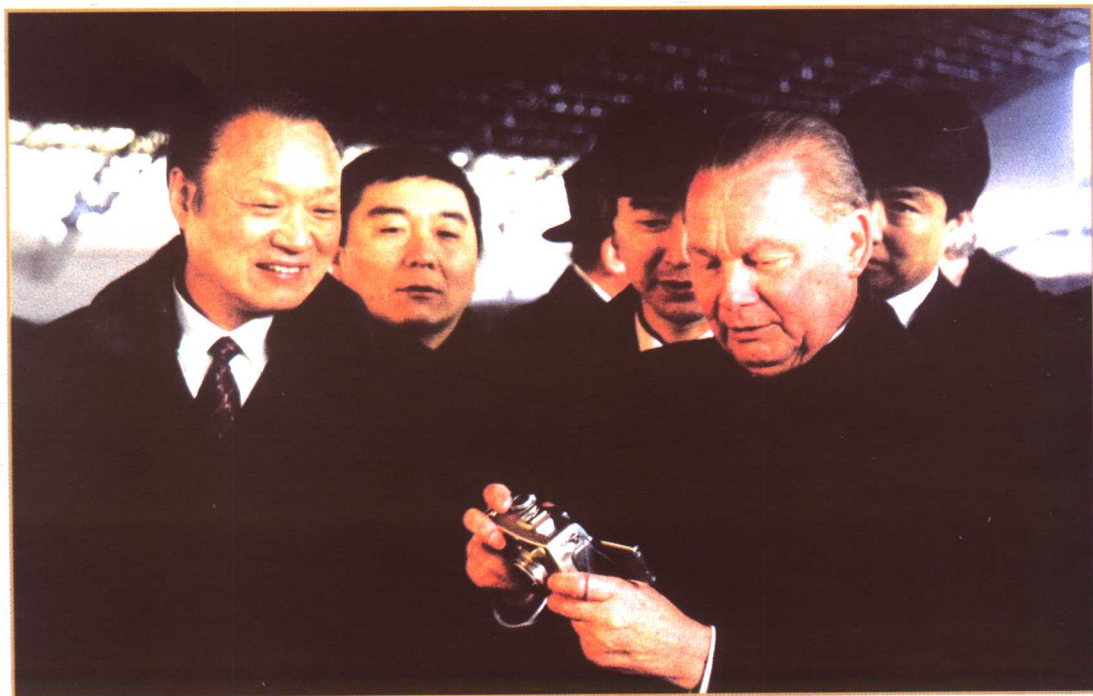
斯洛伐克总统舒斯特在秦始皇兵马俑博物馆（后排中为作者）