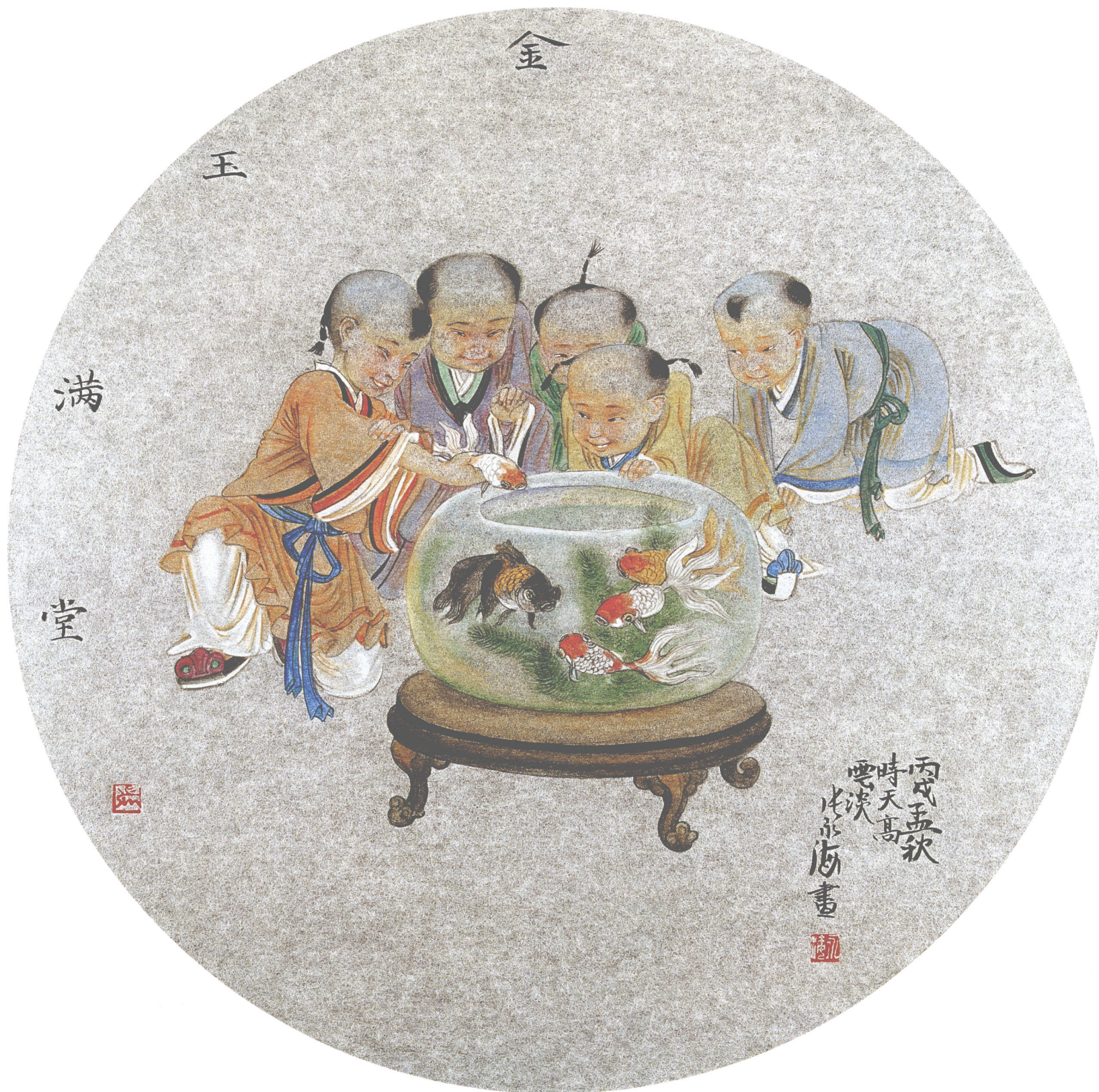
金玉满堂 银笺卡片(45 × 45cm)·2006年