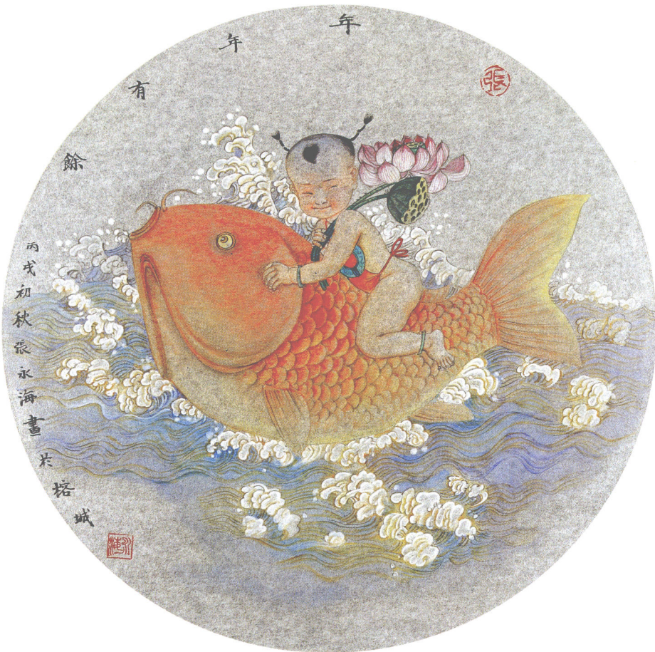
年年有余 银笺卡片(45 × 45cm)·2006年