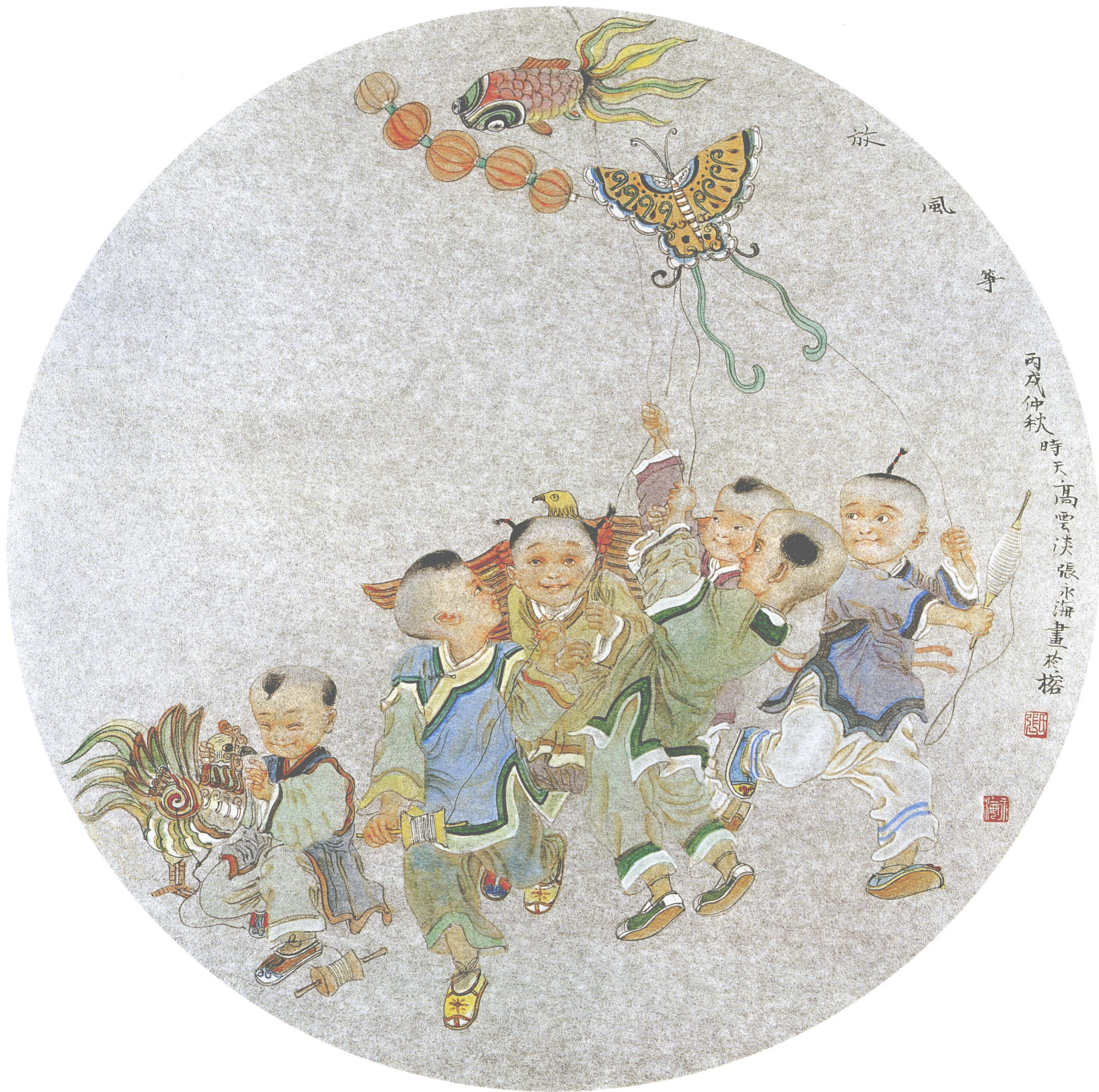
放风筝 银笺卡片(45 × 45cm)·2006年