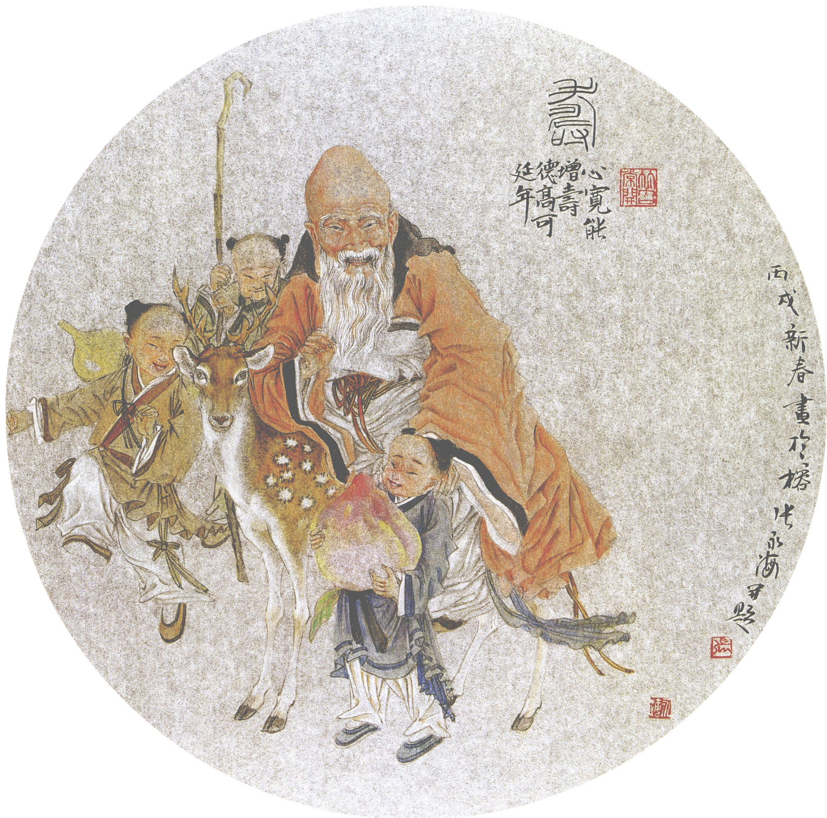
寿星图 银笺卡片(45 × 45cm)·2006年