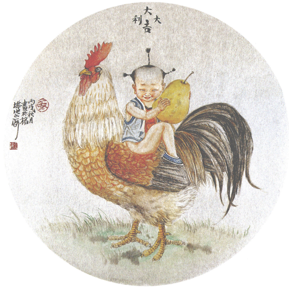
大吉大利 银笺卡片(45 × 45cm)·2006年