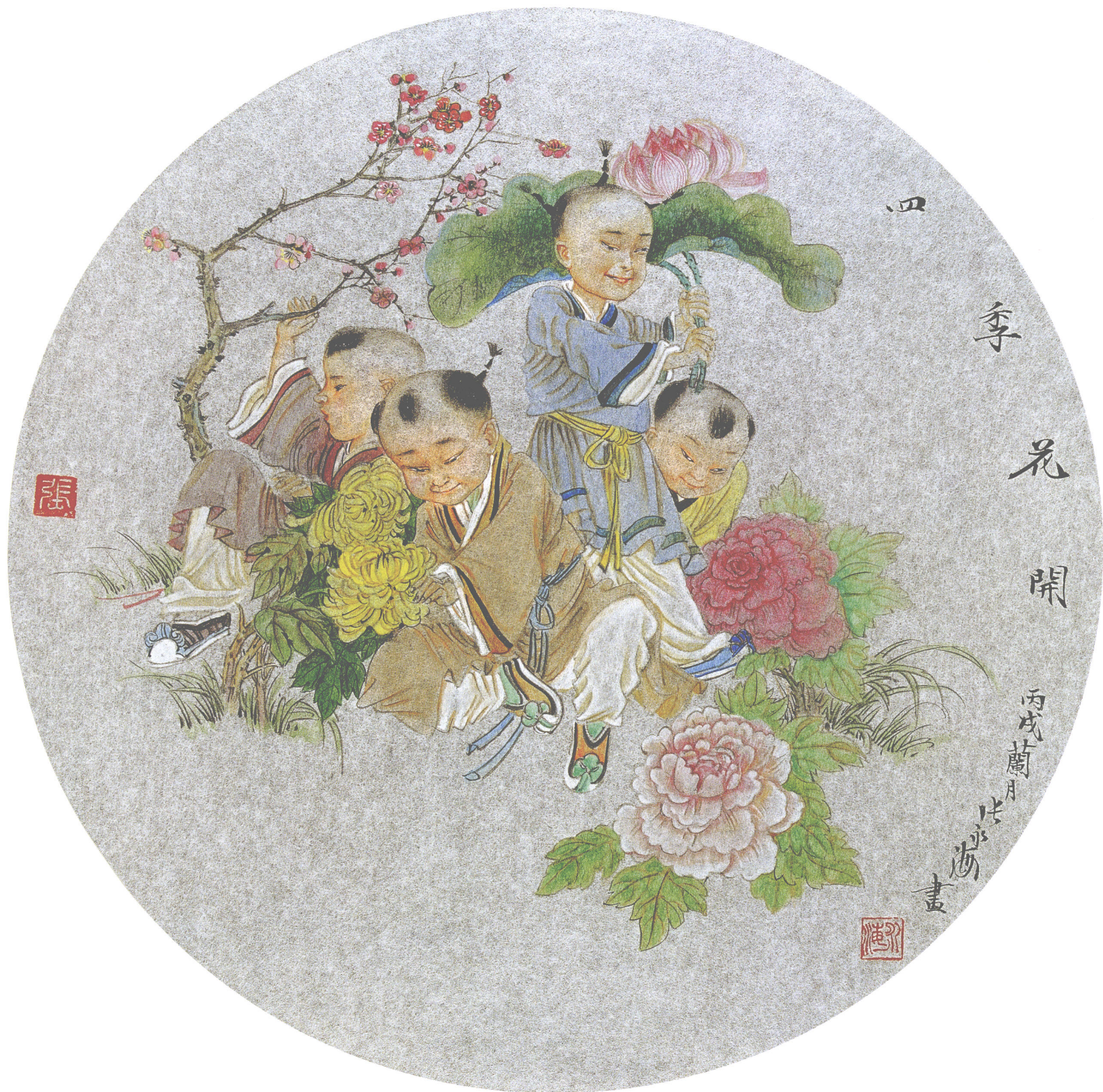
四季花开 银笺卡片(45 × 45cm)·2006年