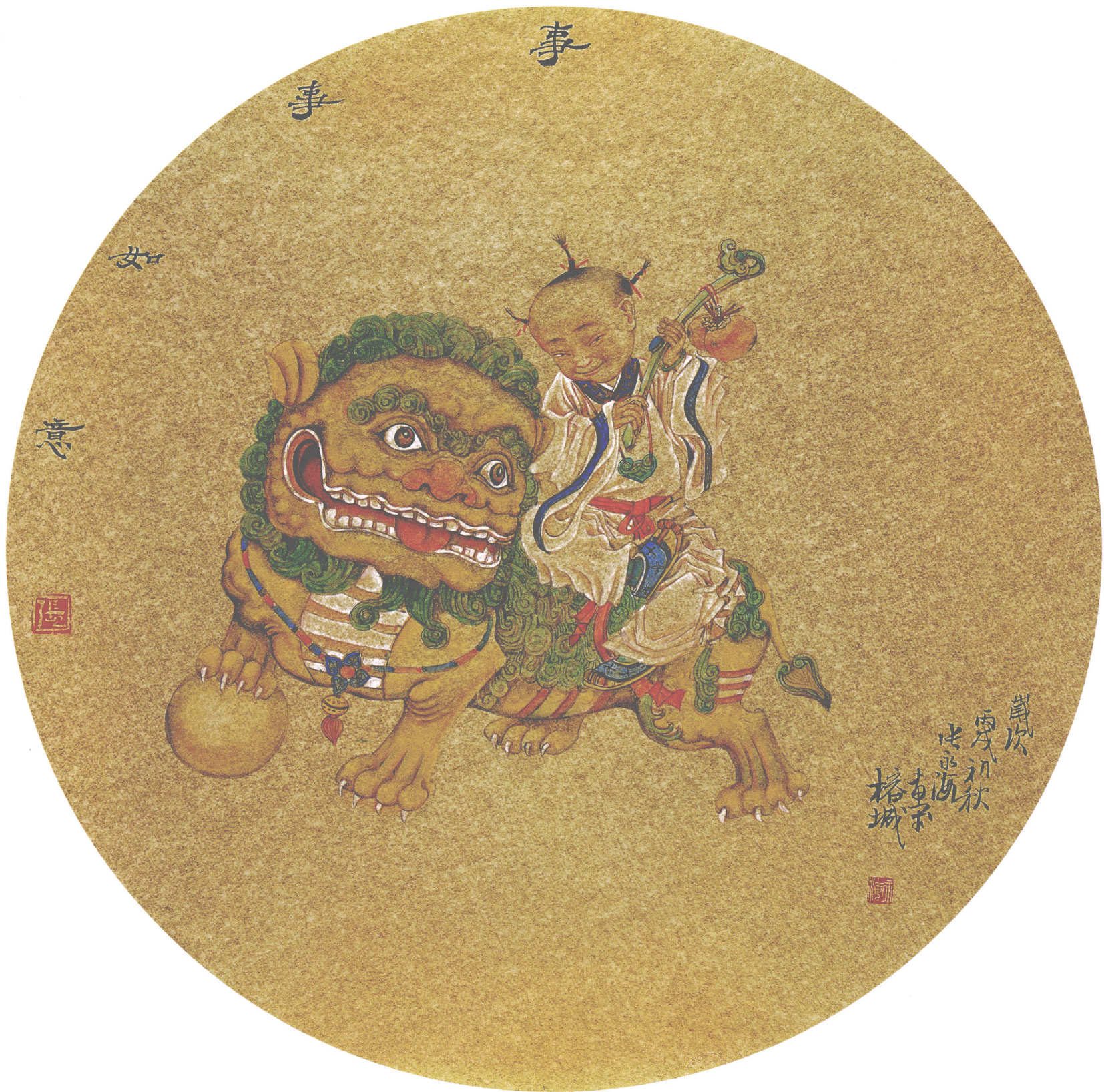
事事如意 金笺卡片(45 × 45cm)·2006年