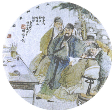
五老雅聚图 银笺卡片(45 × 45cm)·2006年