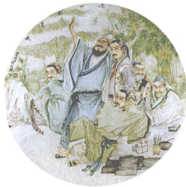
竹林七贤图 银笺卡片(45 × 45cm)·2006年

今天，传统民俗文化正受到越来越广泛的重视，这是一片有待开垦的沃土，里面蕴藏着丰富的宝藏和养料。如何更好地去保护和挖掘成为摆在我们眼前的一个重要课题。我想，随着光阴的流转和年岁的增长，对传统民俗文化将不断有新的体验和感悟，于是，对自己便有了更高的要求 and 期待。