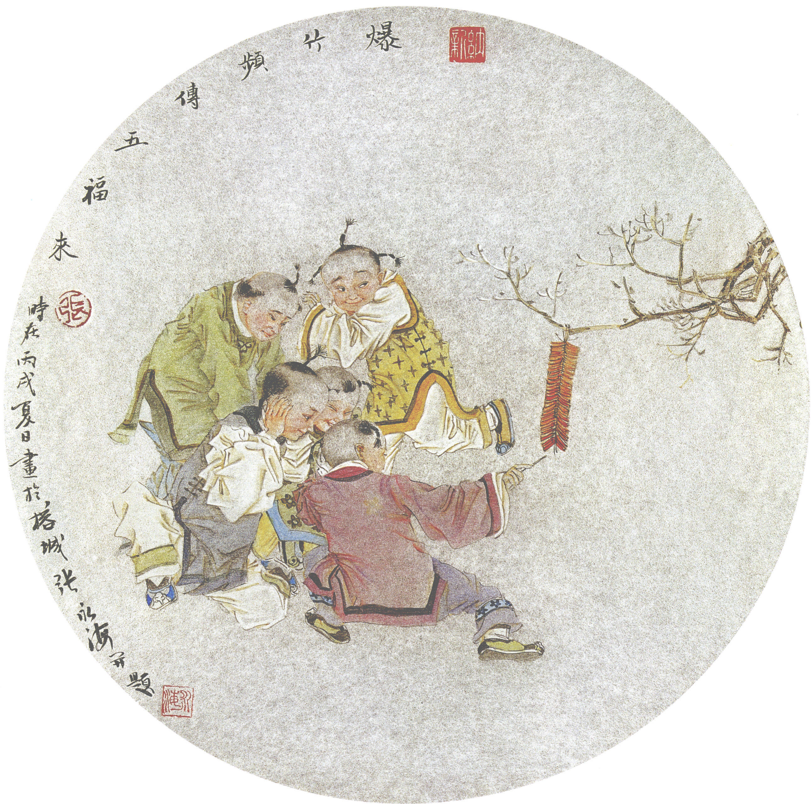
爆竹频传五福来 银笺卡片(45 × 45cm)·2006年