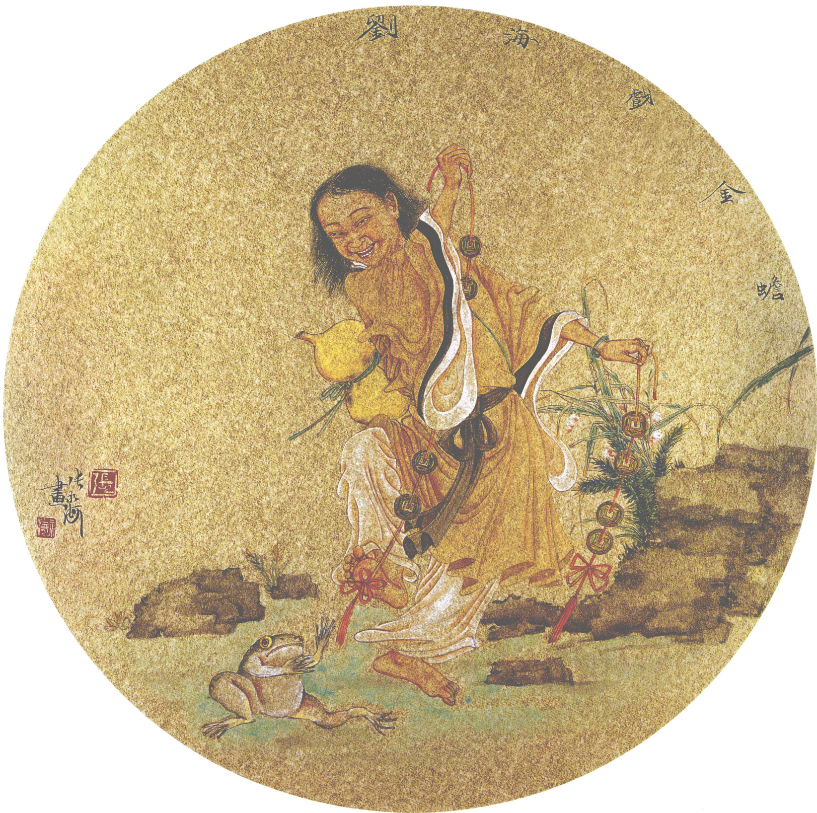
刘海戏金蟾 金笺卡片(45 × 45cm)·2006年