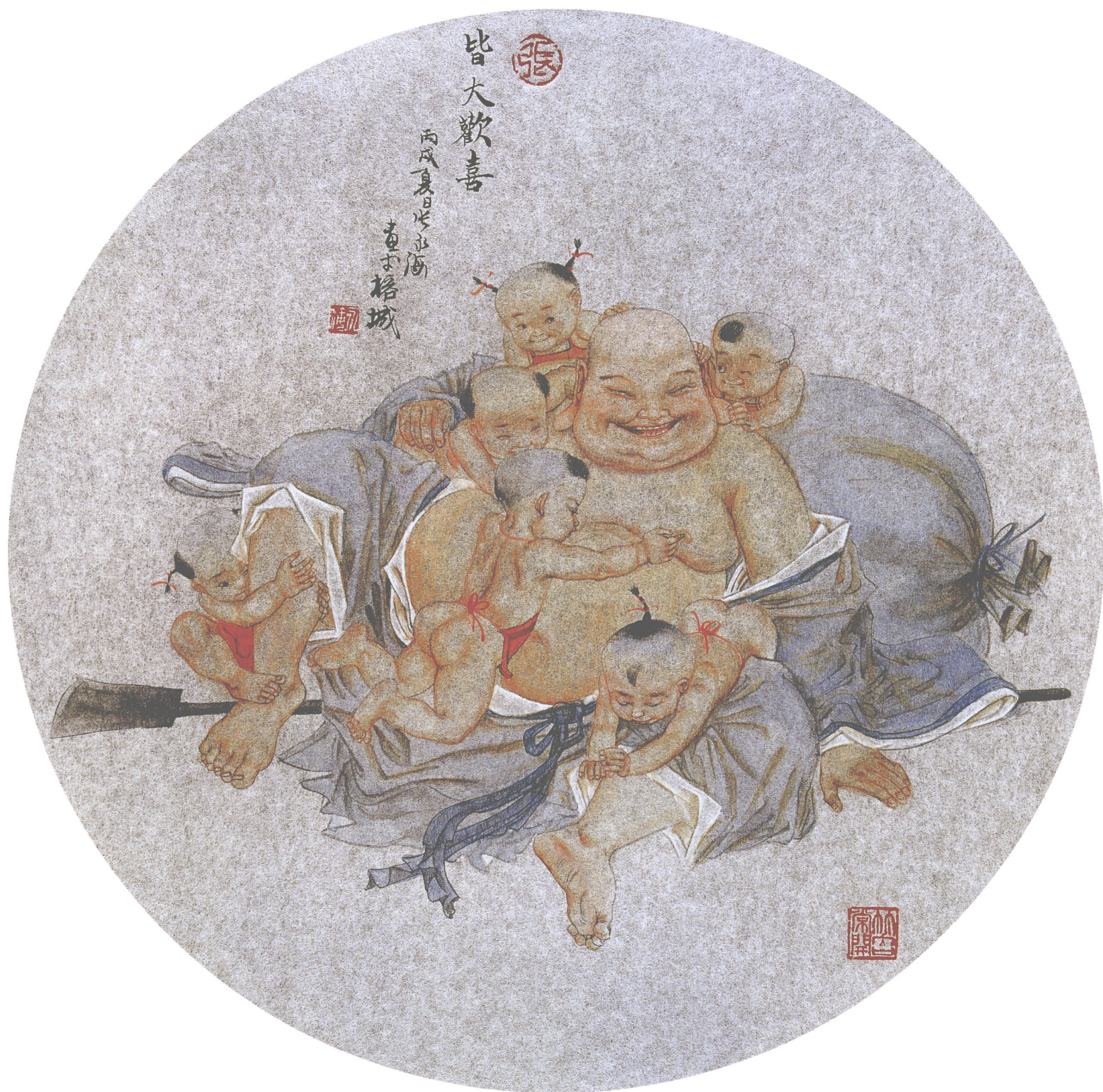
皆大欢喜 银笺卡片(45 × 45cm)·2006年