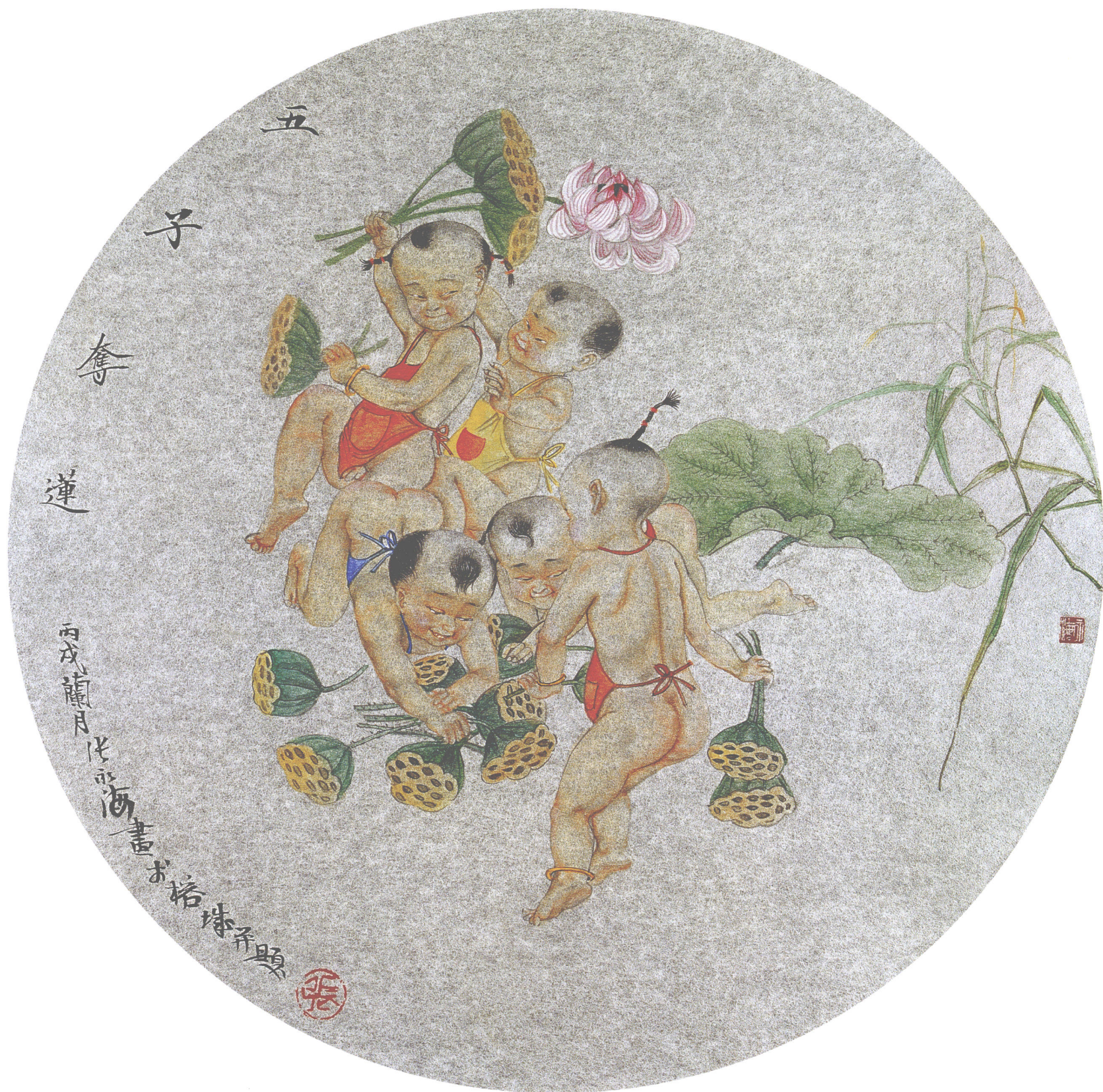
五子夺莲 银笺卡片(45 × 45cm)·2006年