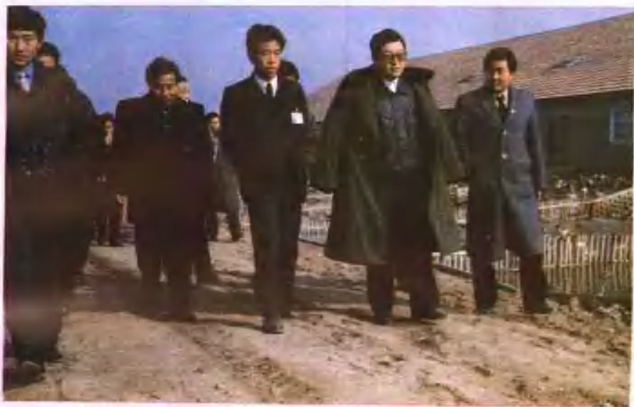
省委书记李长春（右二）视察商丘县饲料养殖综合开发公司