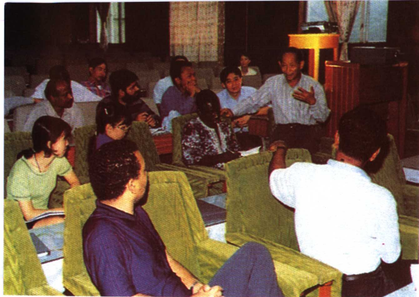
△ 在国际杂交水稻培训班上授课 ▽ 走访农民家庭