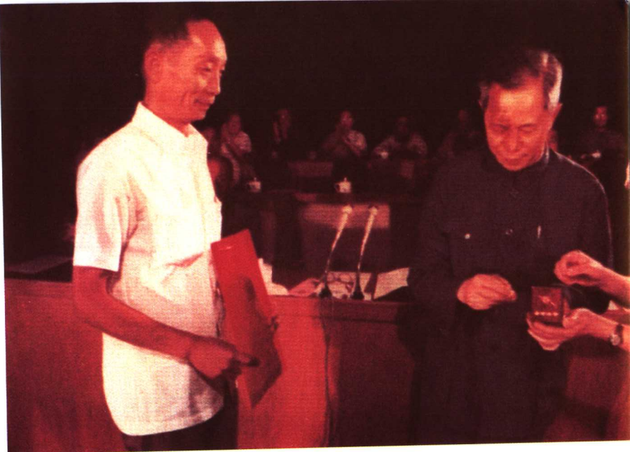
△1981年方毅副总理向袁隆平颁发国家首次科技特等发明奖荣誉证书和奖章 ▽在两系杂交早稻试验田观察