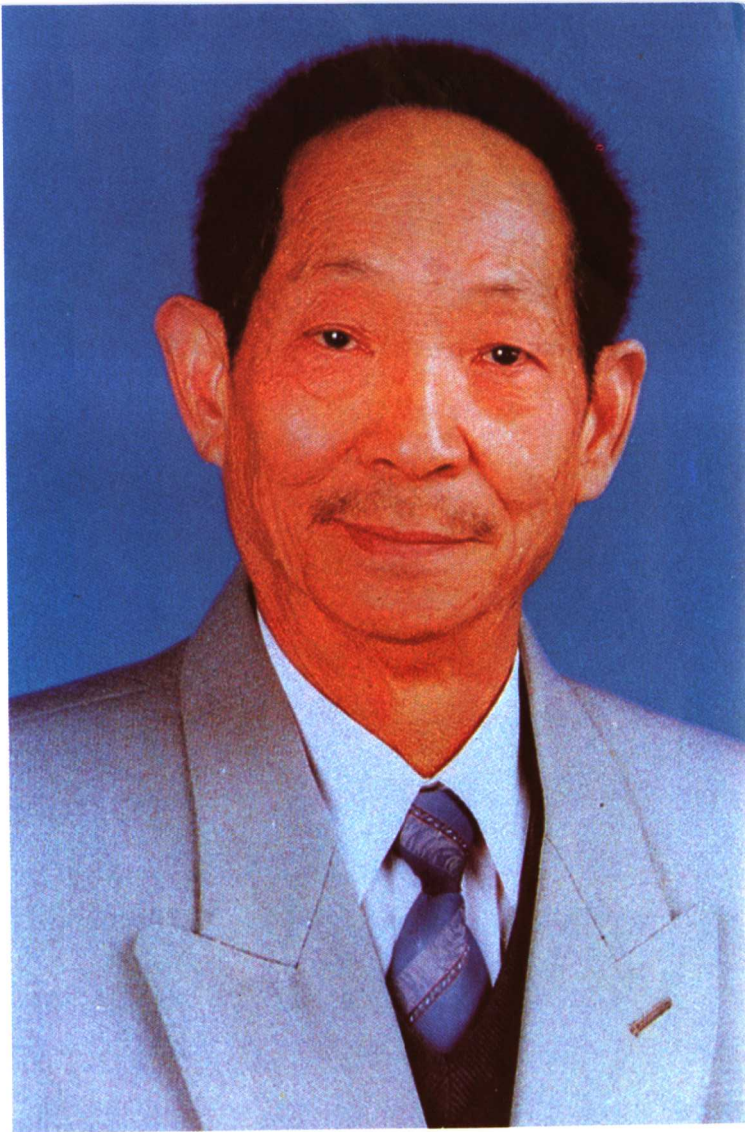
△“杂交水稻之父”袁隆平