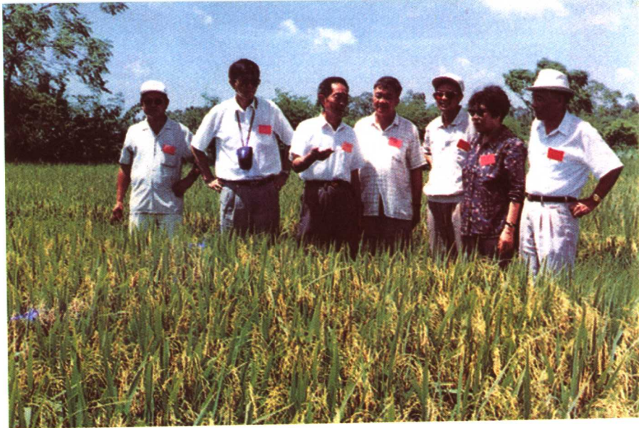
△与“863”主要课题主持人在两系杂交稻田观察、讨论 ▽在湖南杂交水稻研究中心实验室内