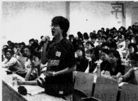
“百所大学”校园讲座