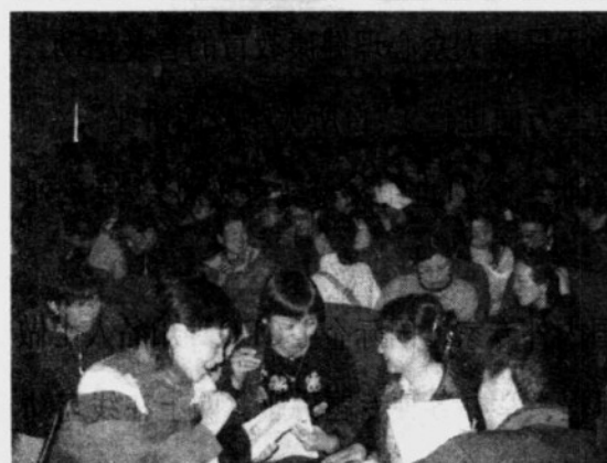
“21世纪父母教育”培训会