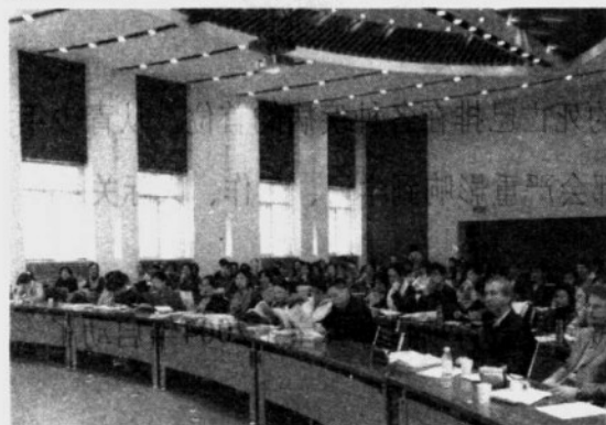
“YTL当代青少年教育”教师培训会