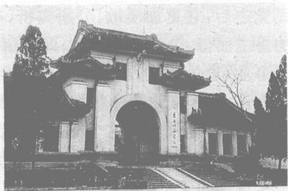
孙中山与马林会谈会址