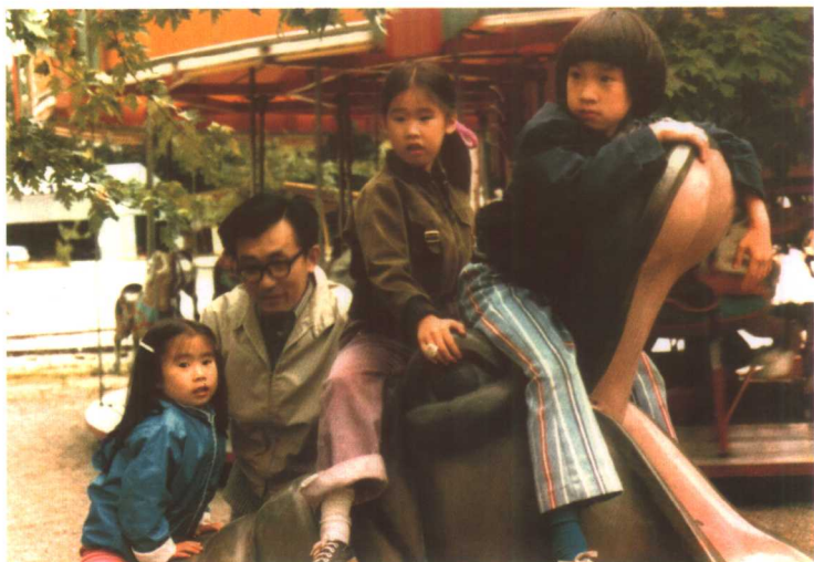
1973年，离美返台前与三子女。