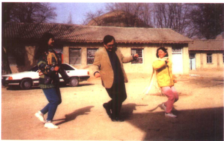
1992年，在延安与当地文工团员跳秧歌舞。