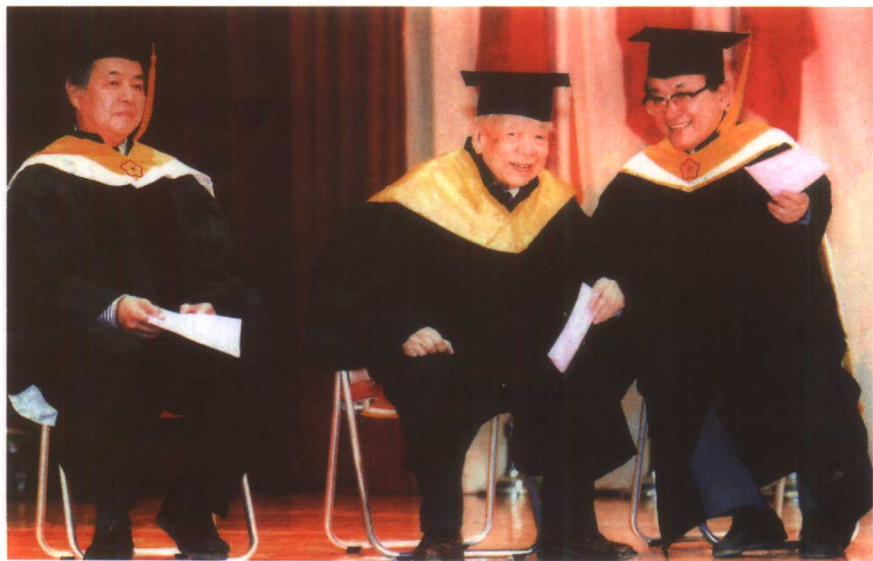
1997年，沈君山颁赠荣誉博士学位予吴大猷（中）、李政道（左）。