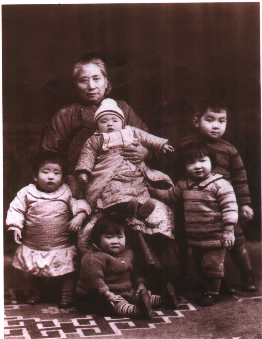
1932年，外祖母和她的孙辈，怀中的是作者。外祖父是最早一辈留法学生，主修数学，三十余岁时在法国因脑溢血中风去世，外婆独自扶养四个子女长大。