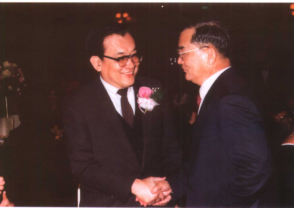
1988年入阁任“政务委员”，在“行政院”第一次酒会上，连战（时任“外交部长”）握手致贺。