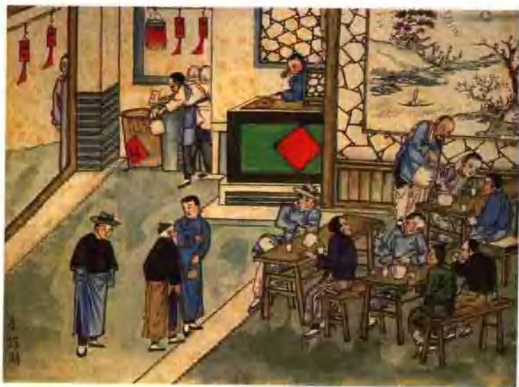
图十五 北京风俗图谱·茶馆图