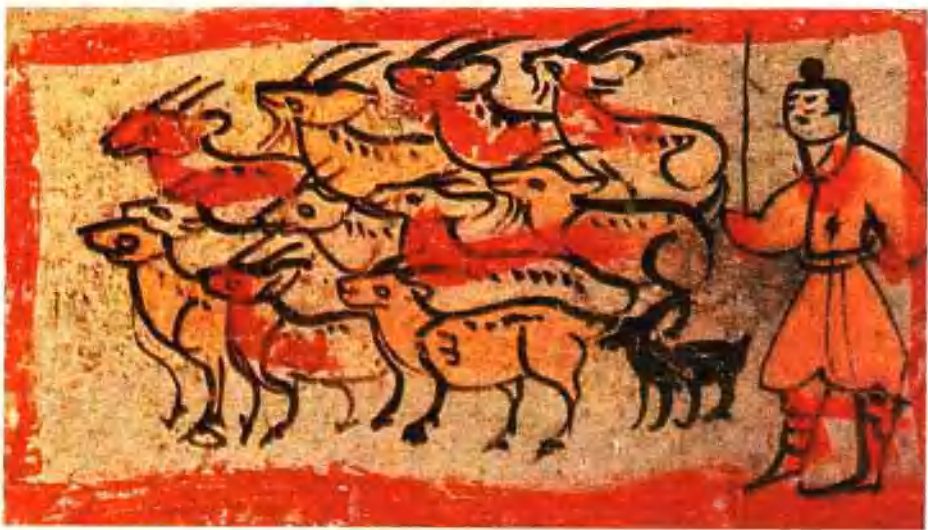
图八 魏晋墓壁画·牧牛图