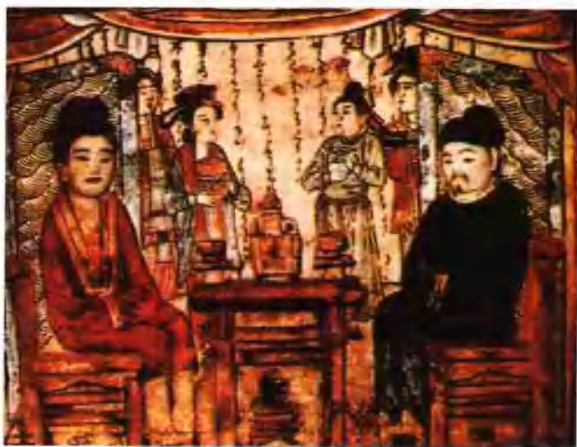
图十 河南白沙宋墓壁画·夫妇宴饮图