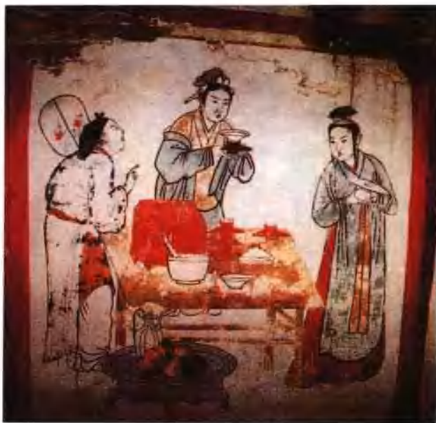
图九 河北宣化辽墓第五号墓·茶道图