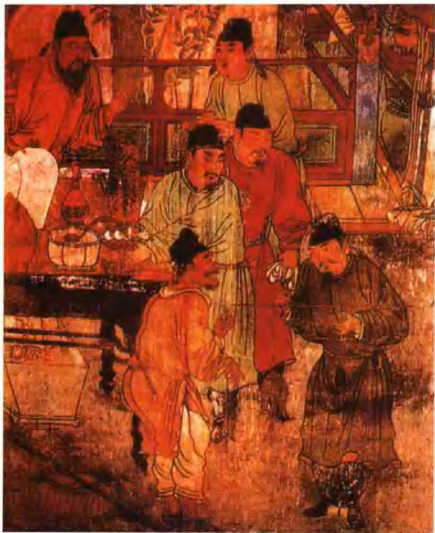
图十一 元代山西洪洞广胜寺壁画·卖鱼图