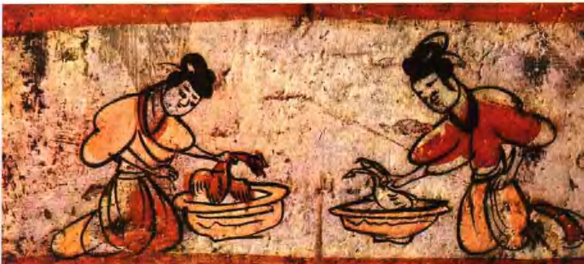
图五 魏晋墓壁画·宰鸡图