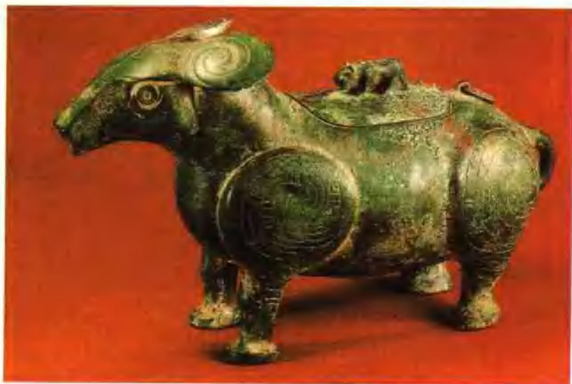
图二 西周青铜牺伯彘尊