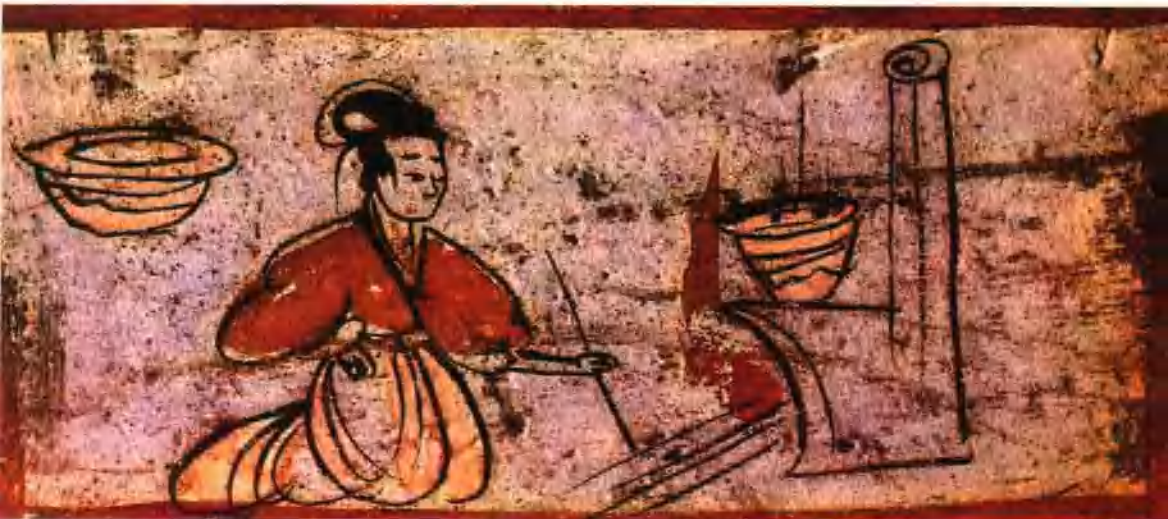
图六 后汉墓壁画·烹饪图