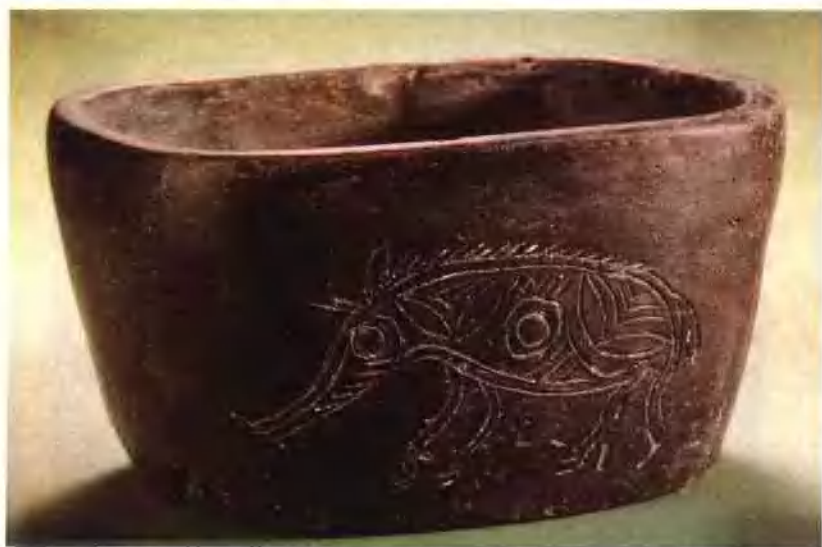
图一 浙江余姚河姆渡文化遗址出土的猪纹黑陶长圆形钵