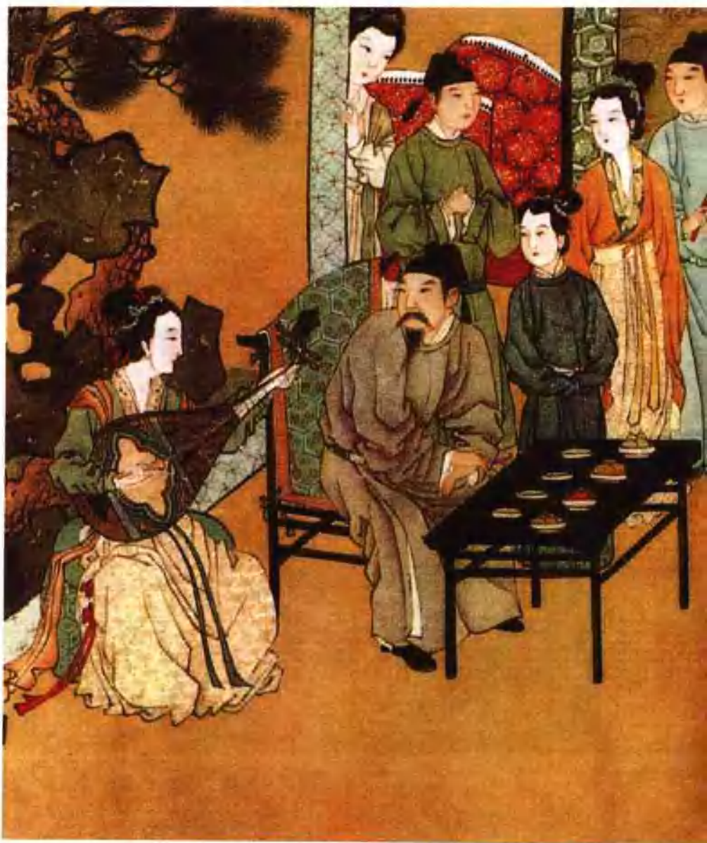
图十二 明代唐寅临摹的《韩熙载夜宴图》(局部)