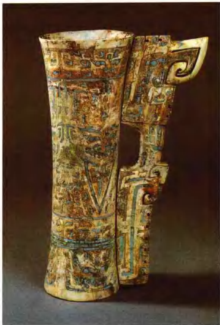
图三 商代妇好墓出土的嵌绿松石兽面纹象牙杯