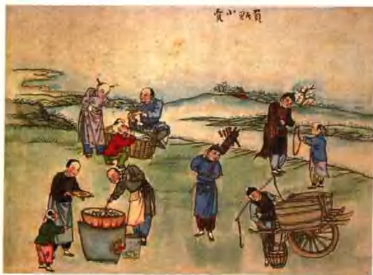
图十四 北京风俗图谱·小贩图