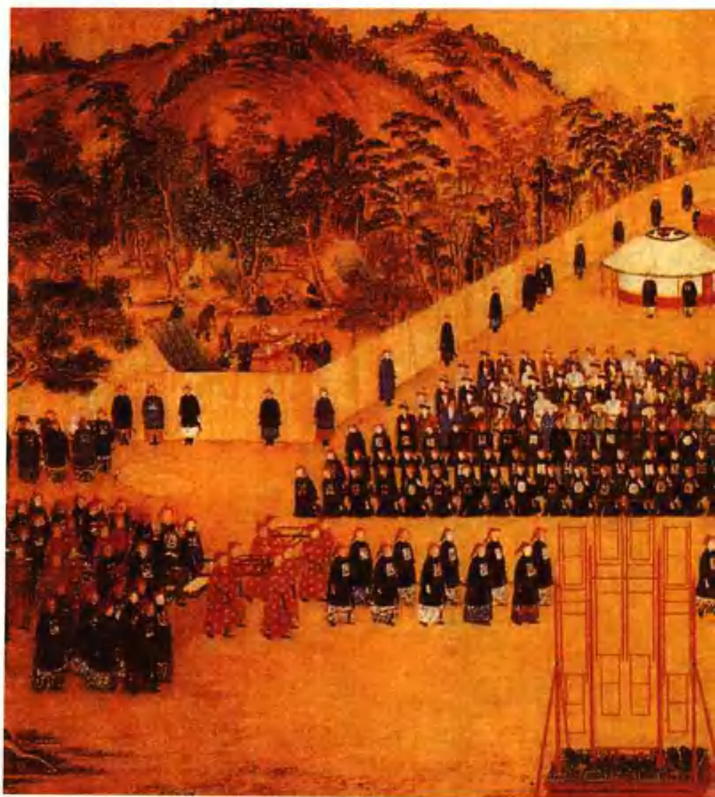
图十三 清代郎世宁绘《万树园赐宴图》