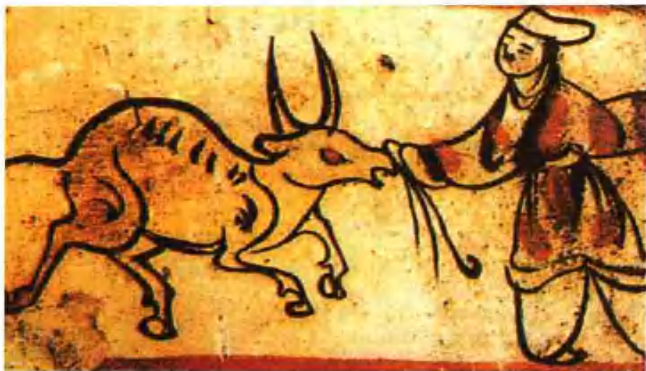
图七 西晋画像砖·宰牛图