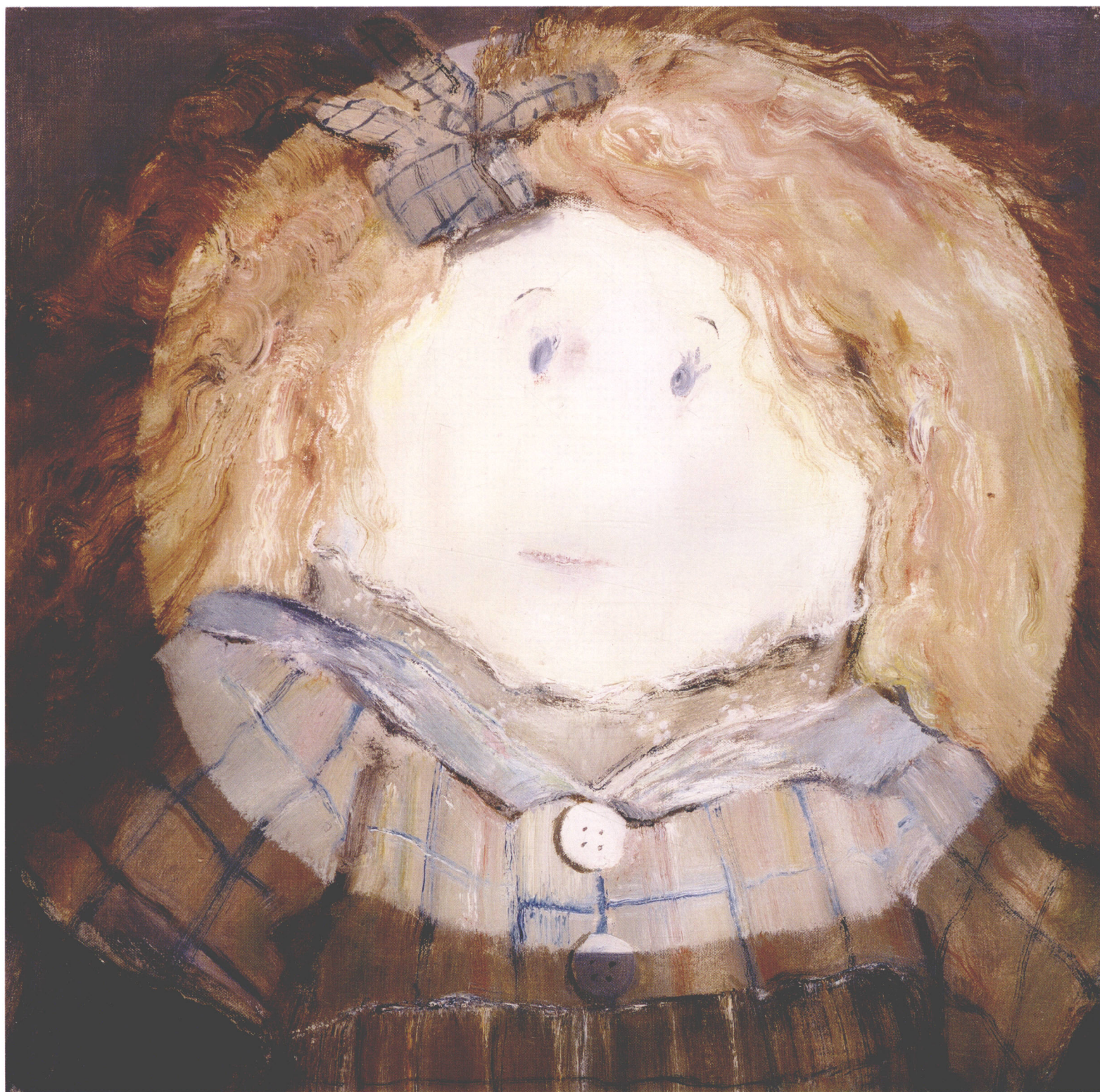
Terror, Identity Card of Doll