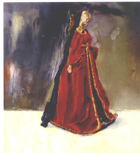
马尾辫 油画 60cm × 60cm 2001年