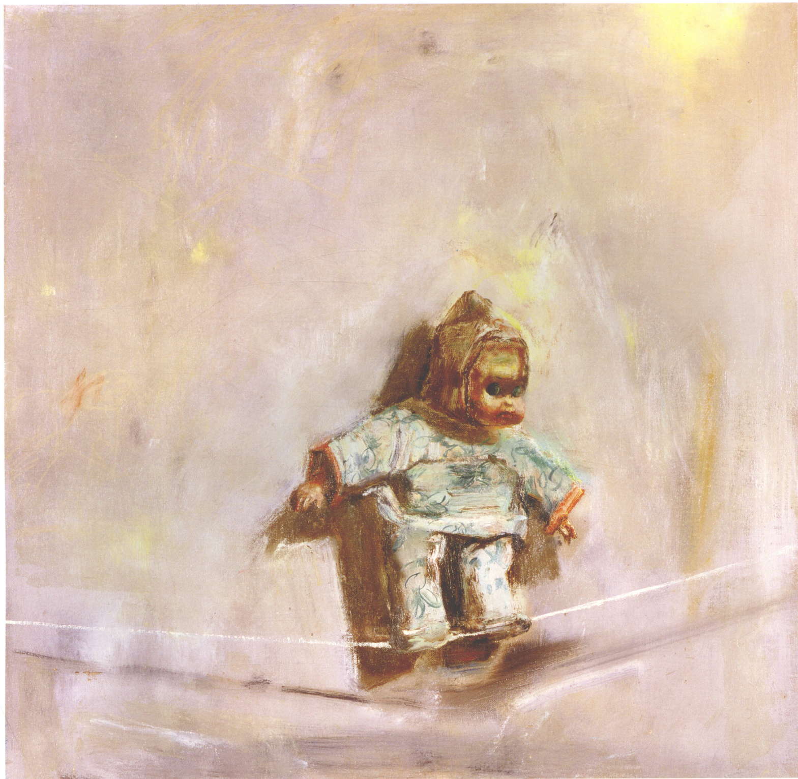
Facing Danger Fearlessly