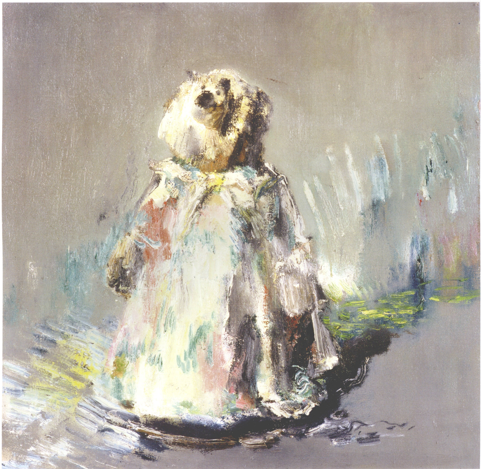
Portrait of Aunt bear