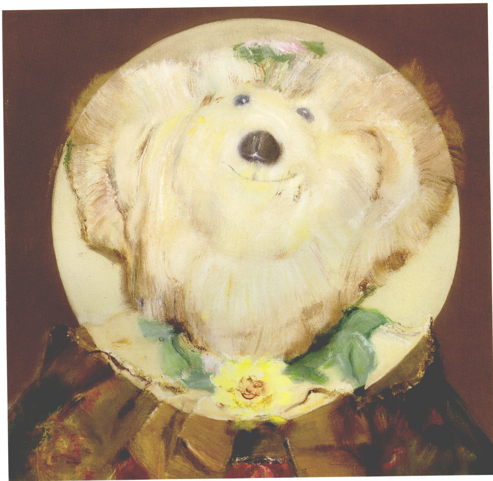
Uncle White Hair, Identity Card of Doll