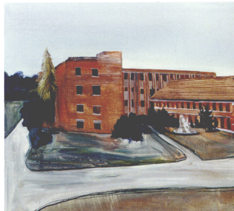
东华大学之中心大楼 油画 120cm × 120cm 2006年