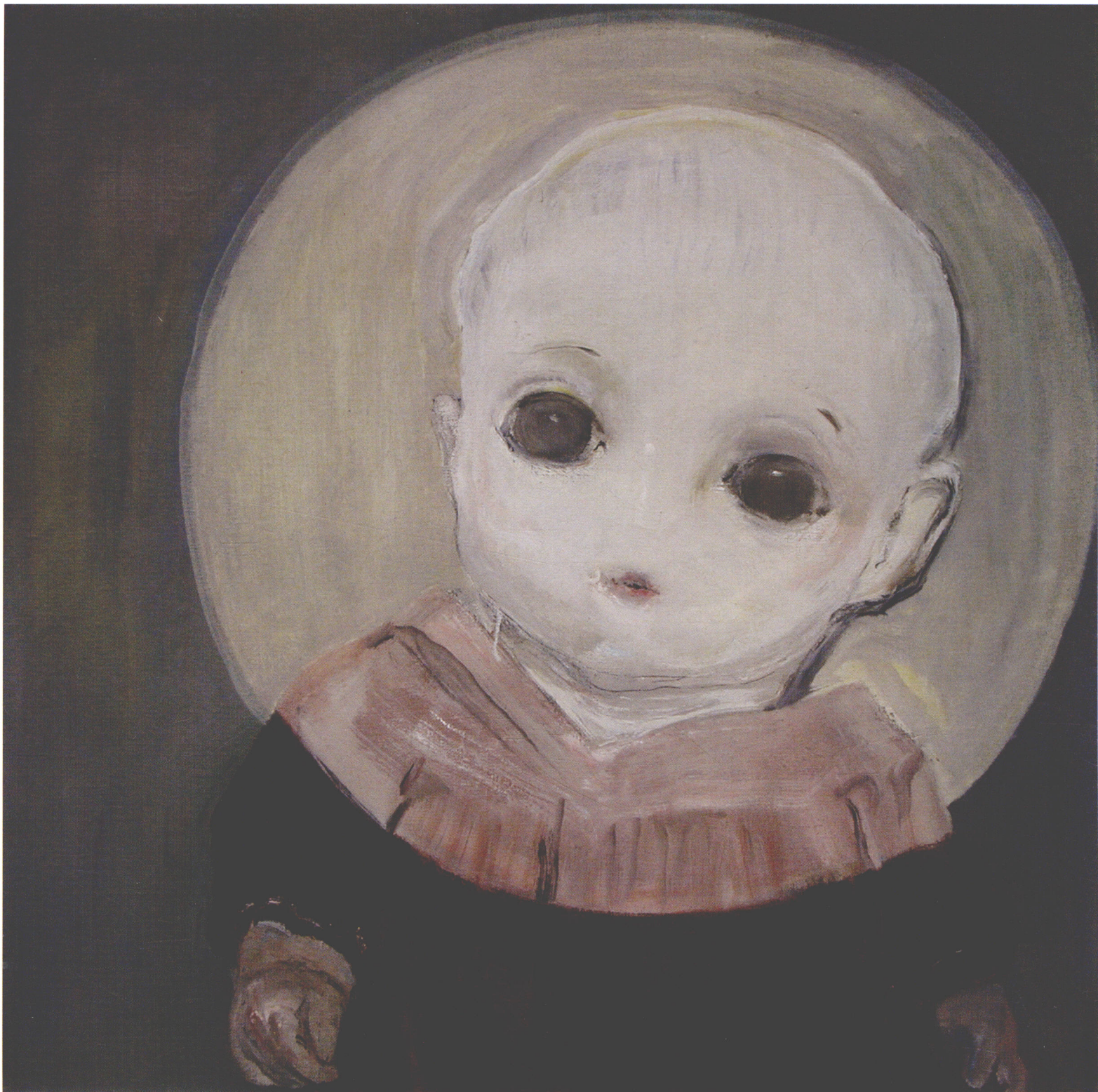
Small Barehead, Identity Card of Doll