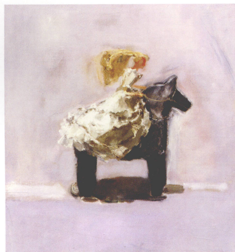
失落的成年天使 油画 60cm × 60cm 2001年