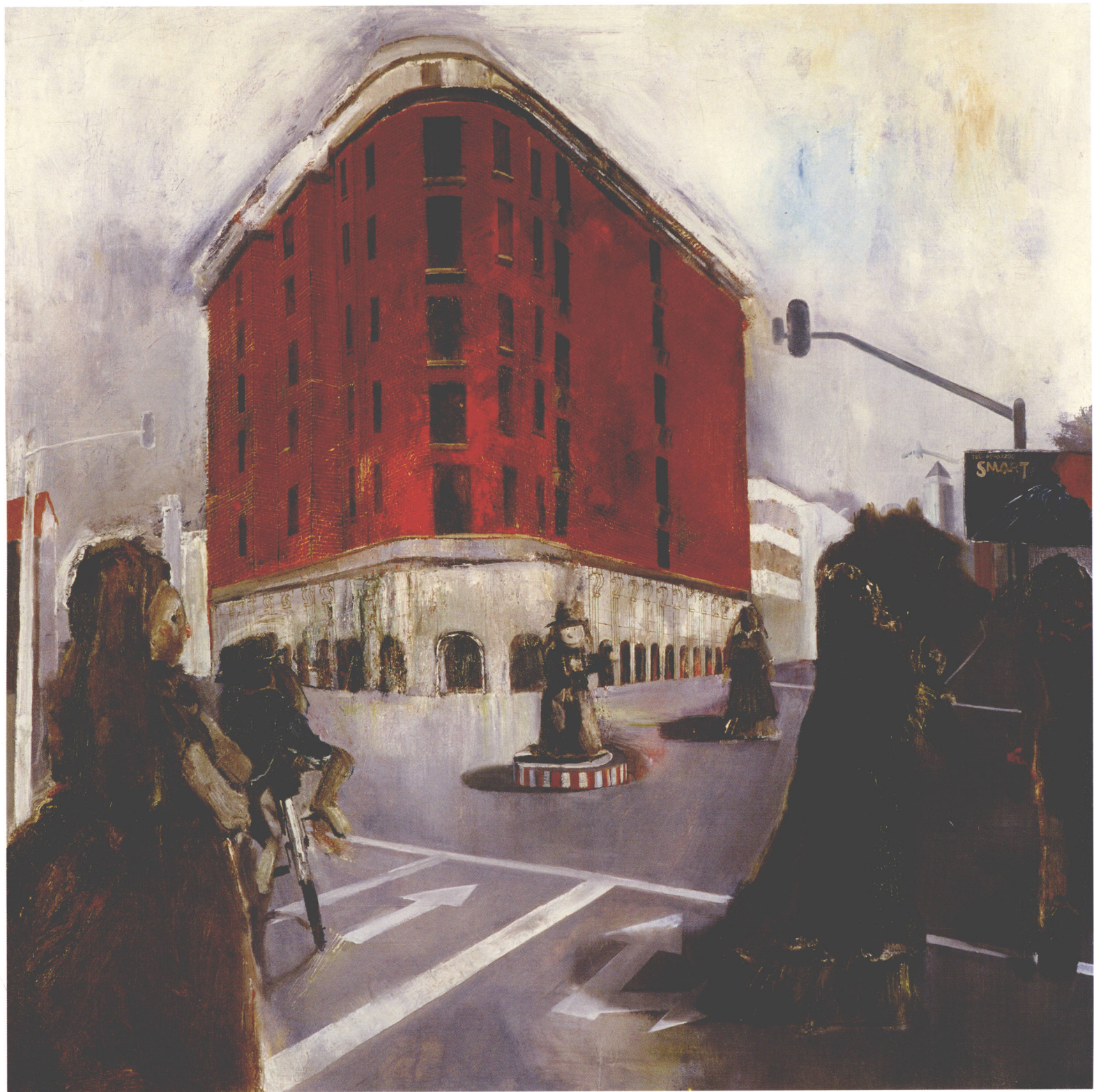
Doll . Transportation