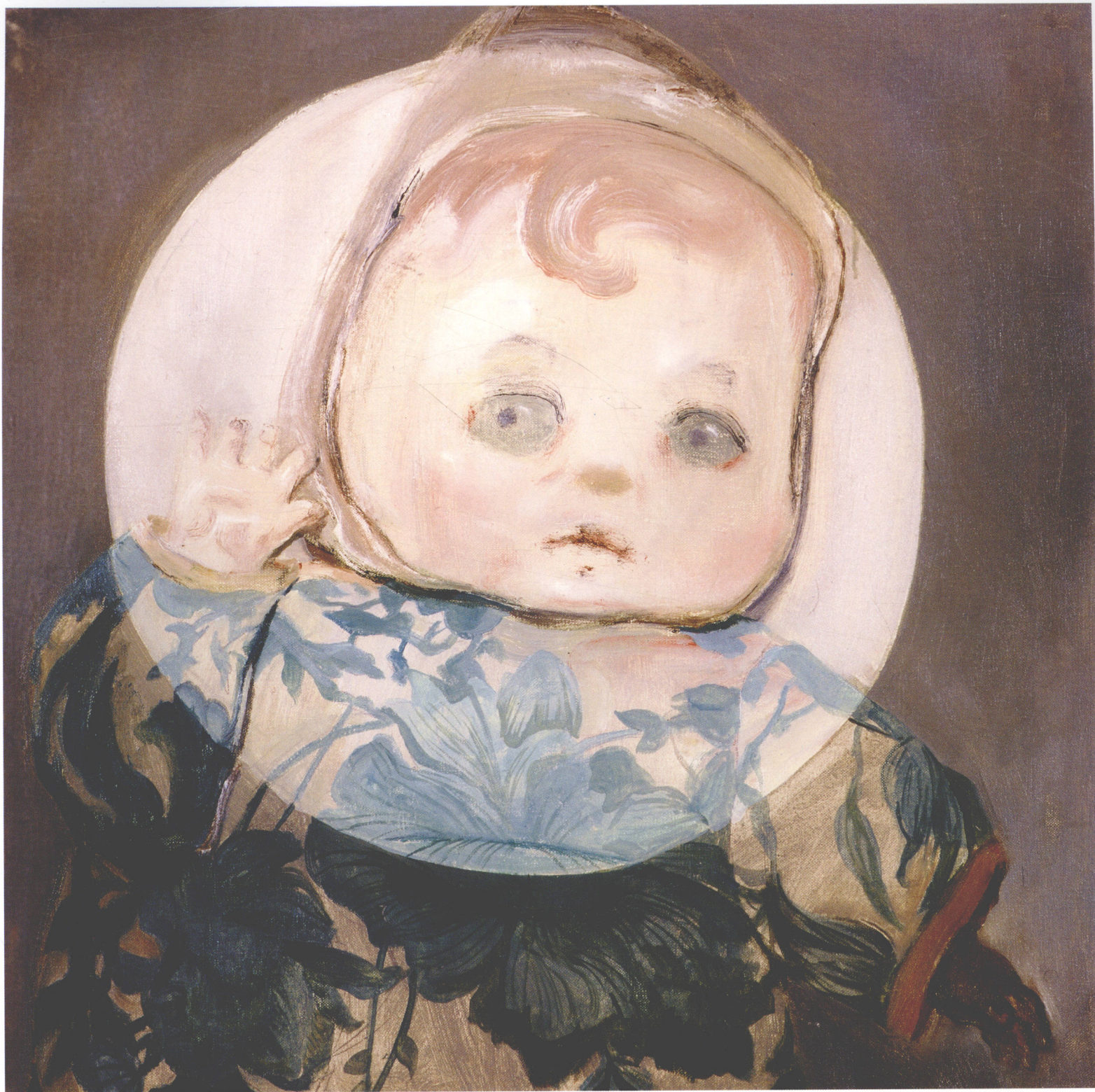
Night Visit, Identity Card of Doll