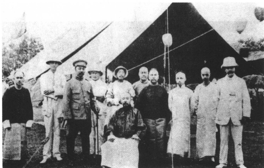
1911年端方入川前留影