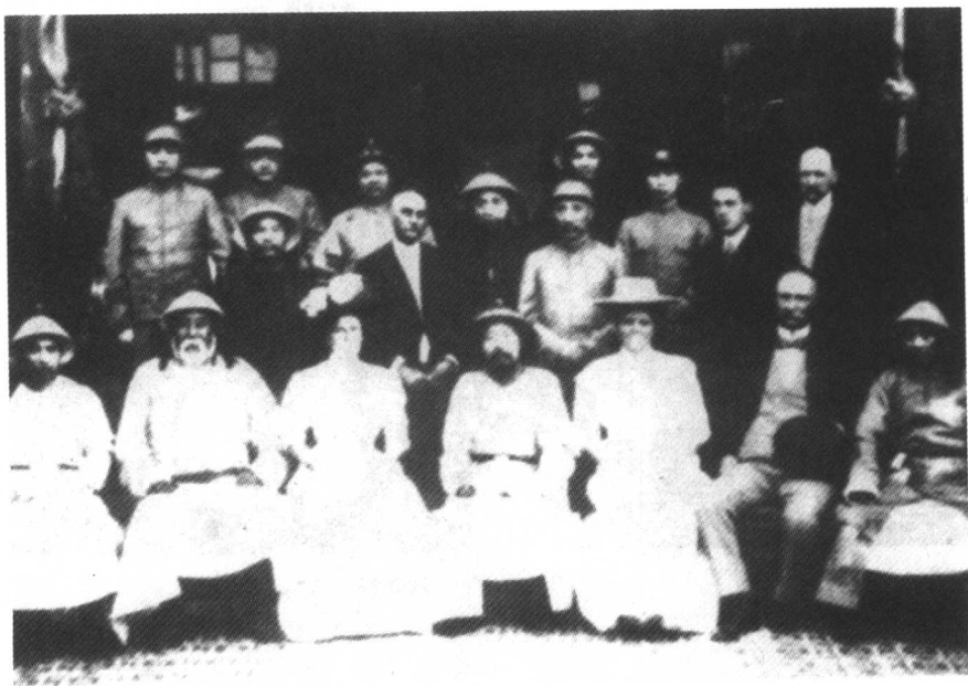
1907年端方接見外国使节