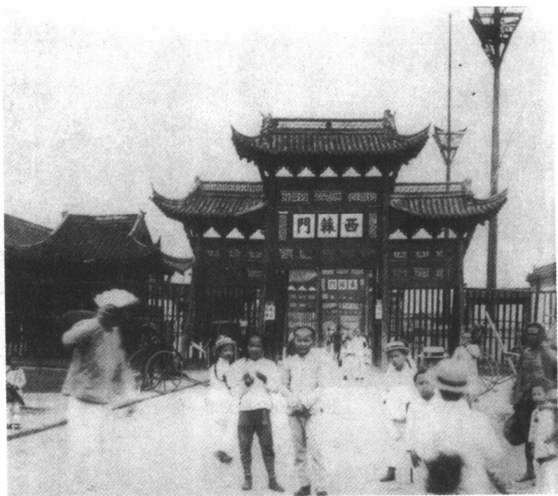
清两江总督署西轅門