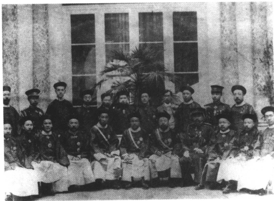
五大臣出洋考察留影