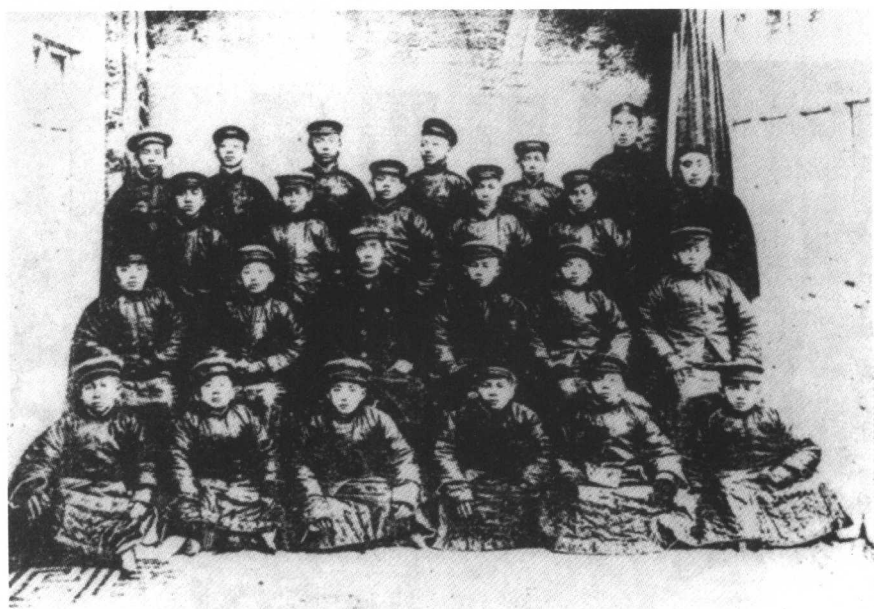
暨南学堂第一批华侨学生抵达南京