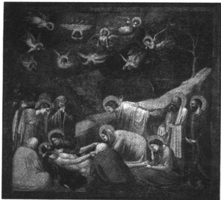
《哀悼基督》 乔托 200cmx185cm 1305年