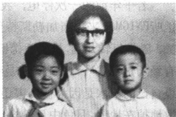
1977年,和妈妈、弟弟的合影,当时我上小学

小学三年级的时候,我们班有个同学的父母是驻外武官。他不仅享受充分自由,拥有造型奇巧的糖果和文具,更以知晓遥远国度的事情而被我们艳羨。这个志得意满的小男孩热衷在课间举办智力测验或知识竞猜,以使优越感日日彰显。我清楚记得这道问题:“圣诞节是哪天?”全班几十个孩子,没有一个知道——学习委员哗啦哗啦地晃着铅笔盒,假装熟谙于心不屑回答。