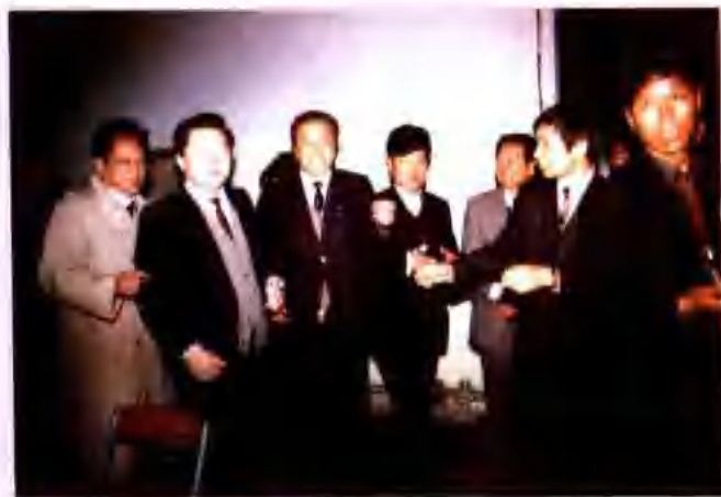
中共河南省省委书记李 长春参观“兴豫杯”饲 料展厅