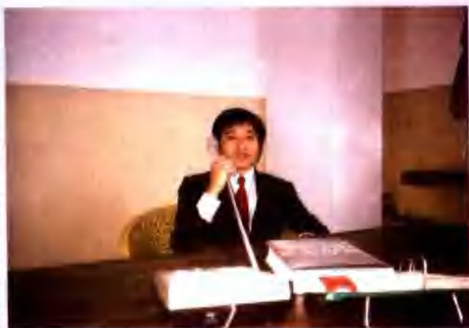
原省饲料公司经理，现任河南 省粮食厅副厅长李长轩