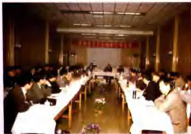
全省饲料工作会议