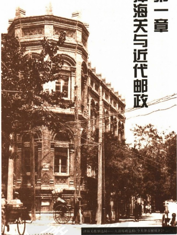
津海关投递总局——大清邮政总局(今天津市解放道)