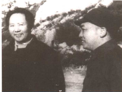
毛泽东和八路军副总司令彭德怀在延安