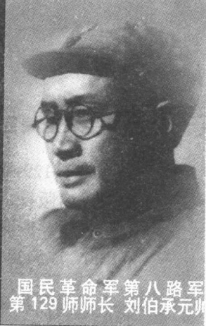
国民革命军第八路军 第129师师长 刘伯承元帅

同志和我一起工作，是1938年在八路军129师，一个师长，一个政治委员。人们习惯把“刘邓”连在一起，我们也觉得彼此难以分开。