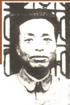
八路军129师原政委张浩将军