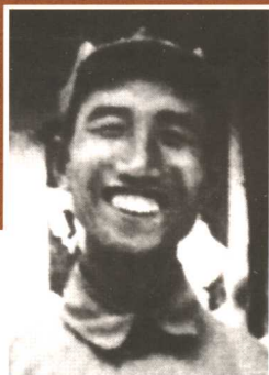
八路军129师副师长徐向前元帅