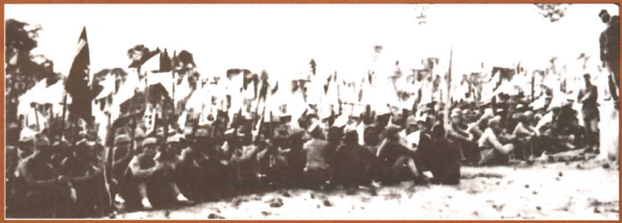
1937年9月，整编之后，整装待发、准备东渡黄河抗日的八路军129师。