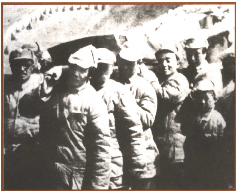
毛泽东等为病逝的八路军129师原政委张浩送殡(从左至右):贺龙、毛泽东、彭真、杨尚昆、陈云。