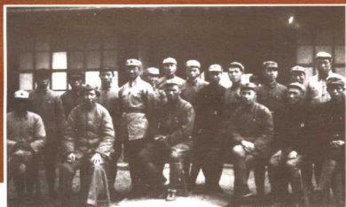
1937年春，朱德、毛泽东和中国人民抗日军政大学部分人员合影。