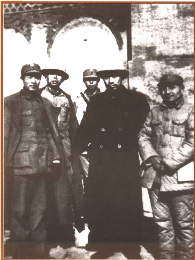
1937年秋，邓小平（右一）、周恩来（右二）、彭雪枫（右五）等在山西前线。