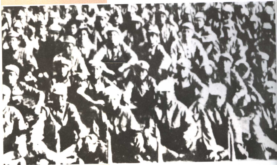
1936年10月，长征到达陕北的八路军129师之前身的主要部队——红四方面军的一部分。