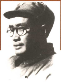
国民革命军八路军129师师长刘伯承元帅