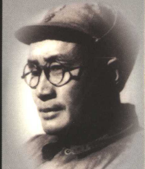
国民革命军八路军 第129师师长 刘伯承元帅

同志和我一起工作， 是1938年在八路军129师，一个师长， 一个政治委员。人们习惯把“刘邓”连在 一起，我们也觉得彼此难以分开。