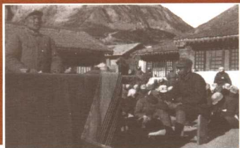
1937年9月，邓小平在延安抗日军政大学作报告。右坐板凳者为抗大校长林彪。