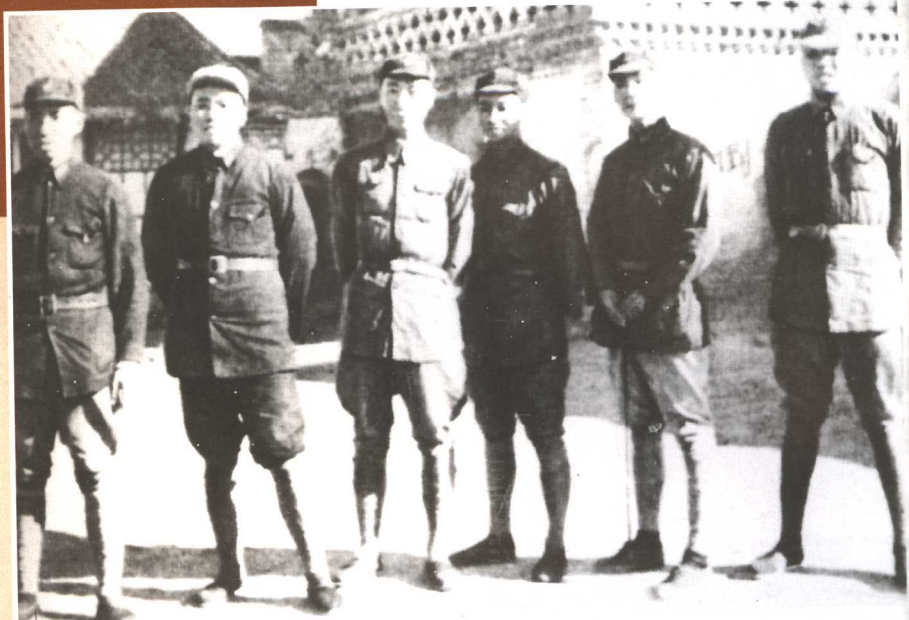
1936年2月，东征抗日前的红军将领。左起：左权、彭德怀、聂荣臻、陈赓、孙毅、聂鹤亭。