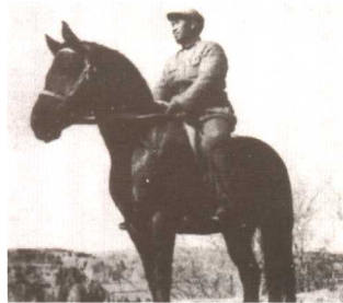
朱德总司令在山西武乡县八路军驻地