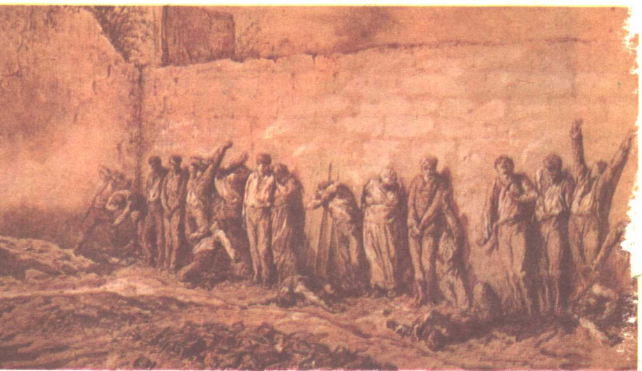
贝尔—拉雪兹公墓的巴黎公社社员墙