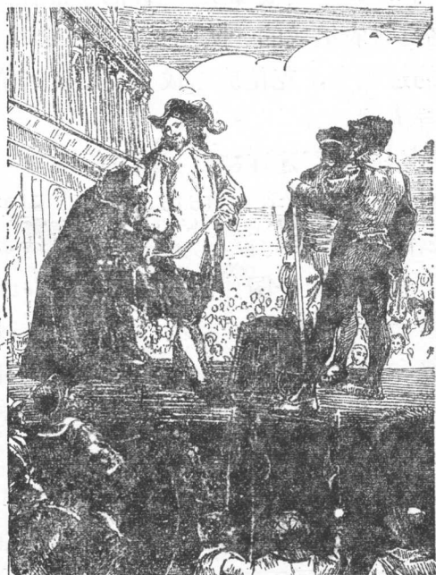
查理一世被押上断头台

克伦威尔的独裁统治 共和国成立以后，克伦威尔独揽大权，成为实际的军事独裁者。他竭力维护资产阶级和新贵族的既得利益，完全不顾人民的死活，甚至掉过头来，同人民为敌，在国内镇压掘地派运动，又出兵“远征”爱尔兰。