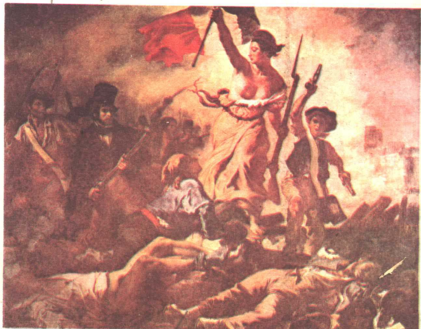
巴黎人民攻占杜伊勒里宫 (1792年8月10日)