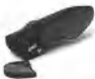
鞋底内藏有窃听器

使得谈判进程有利于美国。在1995年的日美汽车贸易谈判中，美国情报机构窃听了日本通产大臣和汽车行业负责人商议对策的谈话，终于迫使日本签署了最后协议。