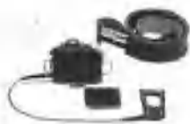
隐性照相机夹在皮带上

无论是烽火弥漫的战争岁月，还是繁华富足的和平年代，隐蔽战线的斗争从来就没有停止过。各国政府为了在新的国际竞争中占据有利的地位，获取更大的利益，促进本国综合国力的增强，纷纷调整和强化间谍情报机构，采取各种手段征募间谍，搜集情报。随着科学技术的突飞猛进，情报和反间谍工作不仅广泛使用人力手段，而且十分重视使用现代的高科技手段。因此，关注隐蔽战线的反动势力的危害，努力提高防范能力，增强国家安全意识，是我国一项长期而艰巨的任务。