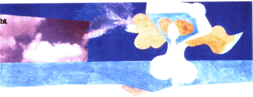
PABLO PICASSO 1888