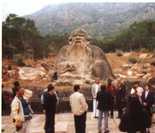
考察团游览老君岩