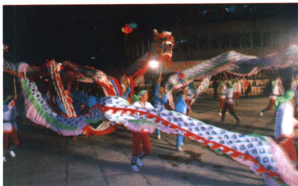
泉州举办盛大文艺踩街欢迎考察团