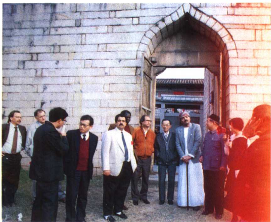
考察团考察泉州清净寺