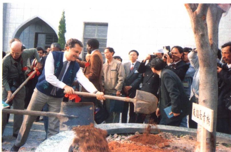
考察团在晋江市陈埭镇种植友谊长青树