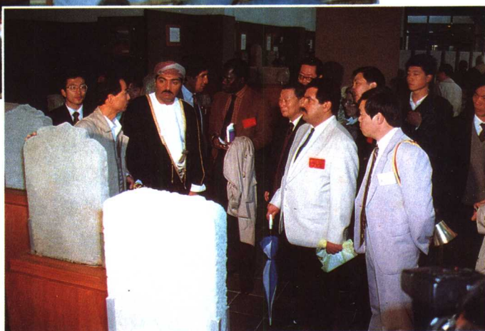
考察团参观泉州海 外交通史博物馆新馆