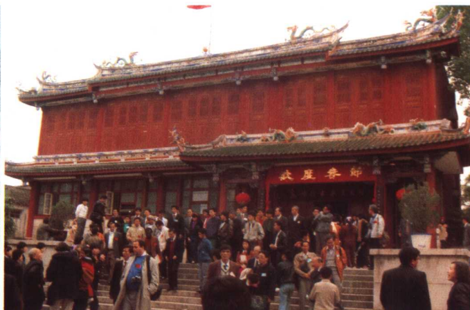
考察团参观泉州宋代古船陈列馆