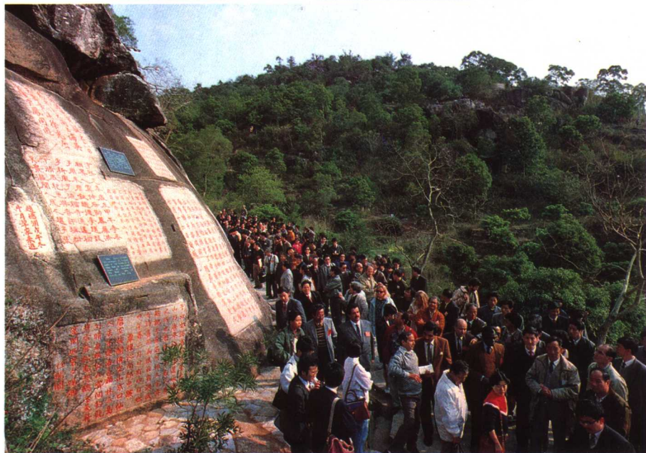
考察团参观九日山宋元时期的祈风石刻