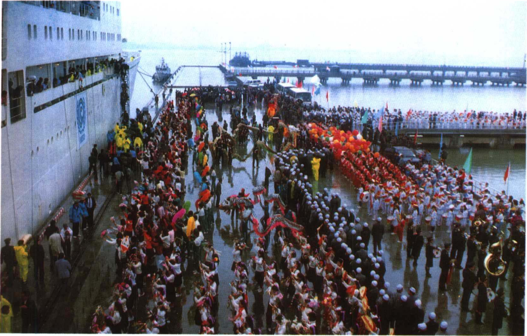
泉州各界热烈欢迎UNESCO“和平号”考察船