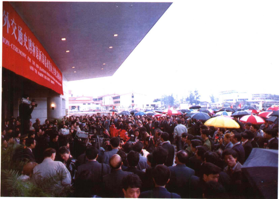
UNESCO考察团参加泉州海外交通史博物馆新馆落成典礼