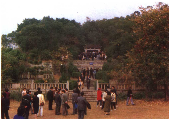
考察团瞻仰泉州灵山伊斯兰圣墓