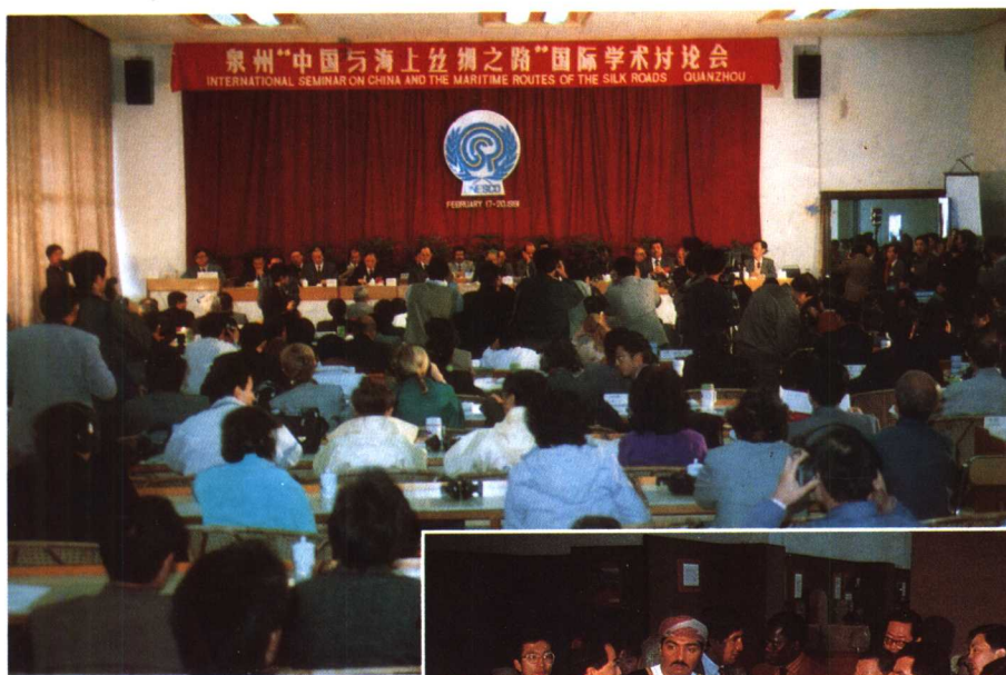
“中国与海上丝绸之路” 国际学术讨论会