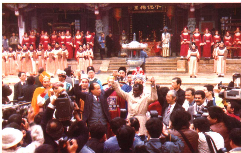
考察团在歌舞中告别泉州