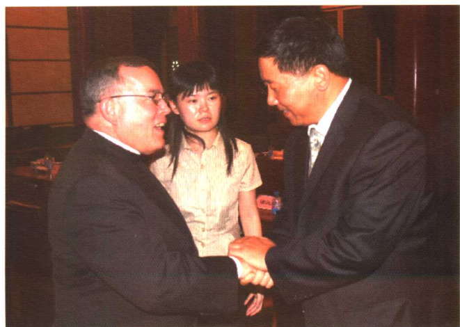
2005年8月，会谈后与委员会委员查普特枢机主教亲切交谈