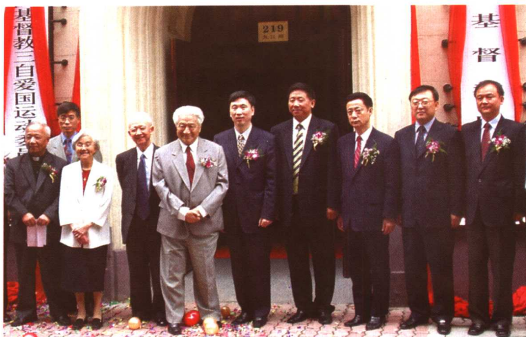
2004年6月，参加中国基督教“两会”新会所揭牌仪式