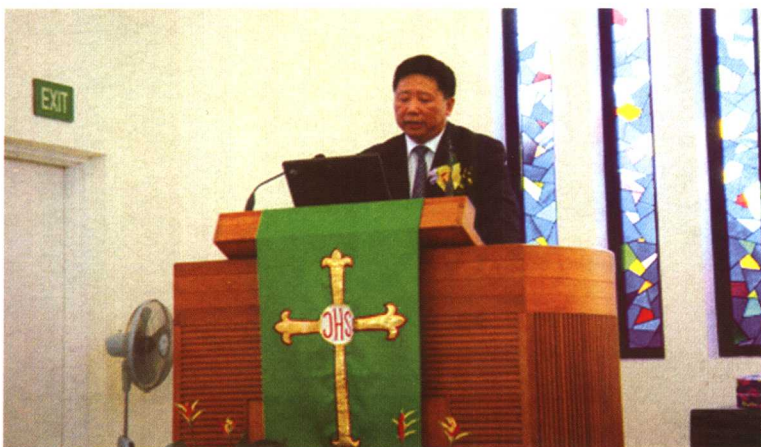
2005年8月，在新加坡“三一神学院”研讨会上讲演