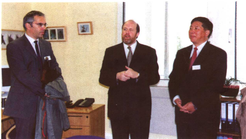
2002年10月，在英国会见联合圣经公会总干事尼尔·克罗斯比（中）