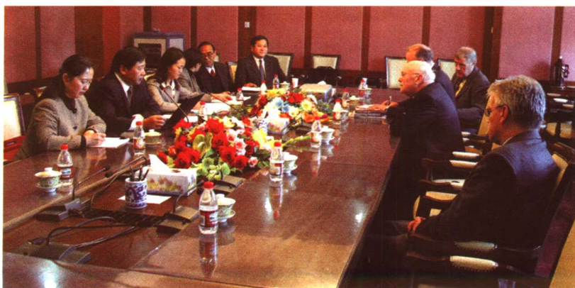
2005年3月，与比利时天主教丹尼尔枢机主教会谈