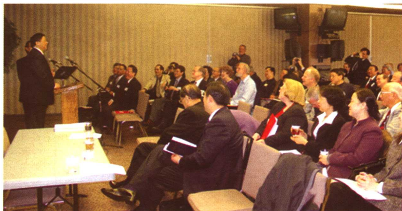
2003年2月，在美国洛杉矶对美国西部基督教领袖讲演