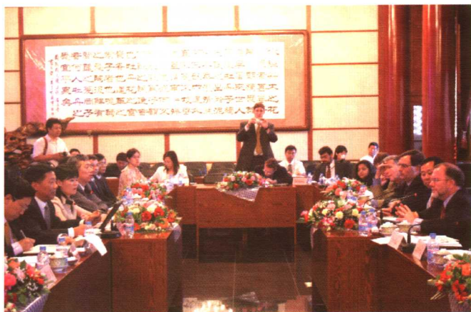
2005年8月，在国家宗教事务局与美国“国际宗教自由委员会”代表团进行会谈