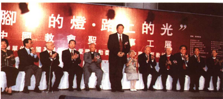
2004年8月，在香港参加“中国教会圣经事工展”开幕式