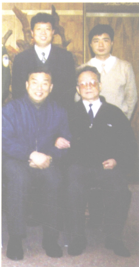
1995年3月，全国政协副主席谷牧（前排右一）到武夷山视察