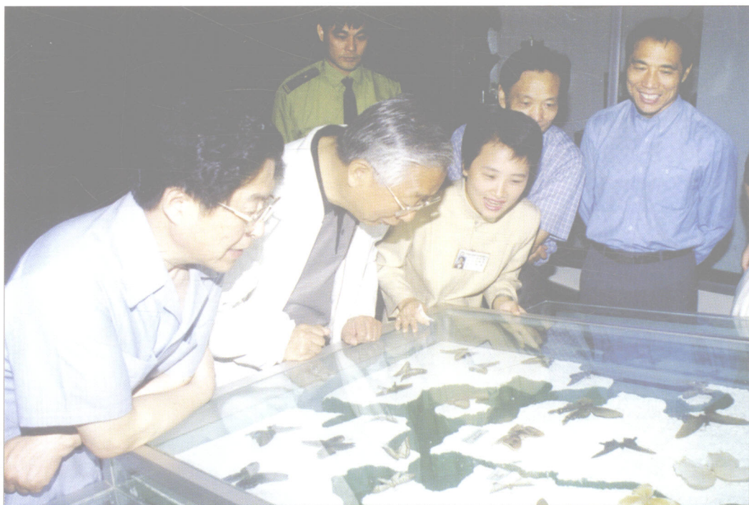
1999年6月，全国政协副主席张思卿（左二）到武夷山视察