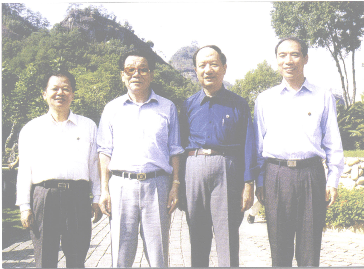
1999年10月,中共中央政治局常委、全国政协主席李瑞环(左二)视察武夷山

中国人民政治协商会议是中国人民爱国统一战线组织，是中国共产党领导的多党合作和政治协商的重要机构。作为人民政协的地方组织，南平市政协成立以来，得到了全国政协和省政协领导的亲切关怀，先后有全国政协主席、副主席18人次和省政协八届、九届正副主席亲临南平视察和指导工作。