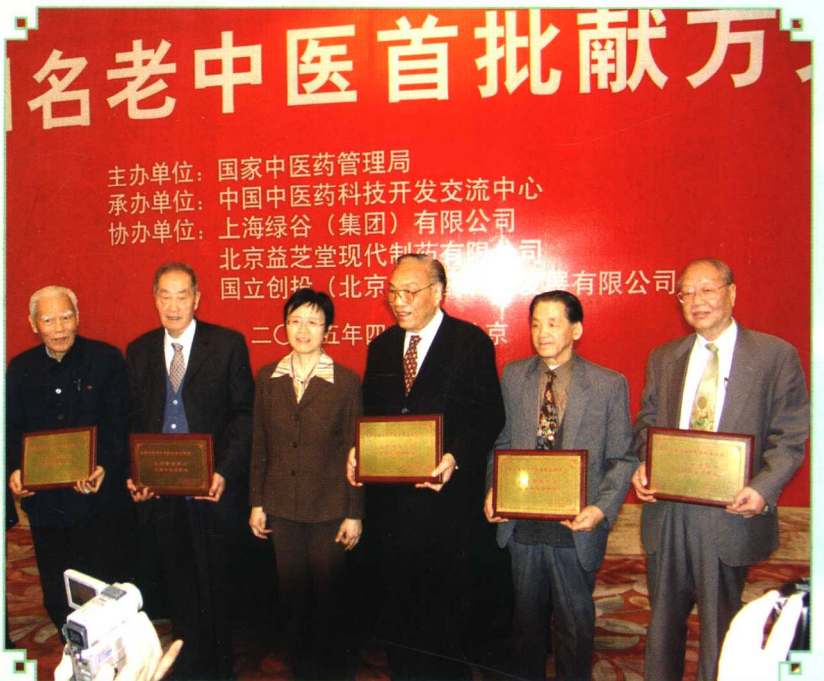
2005年4月27日，卫生部副部长兼国家中医药管理局局长余靖代表国家中医药管理局接受了全国著名老中医邓铁涛、颜德馨、焦树德、路志正、任继学、朱良春的宝贵献方，并向6位名老中医颁发了荣誉证书