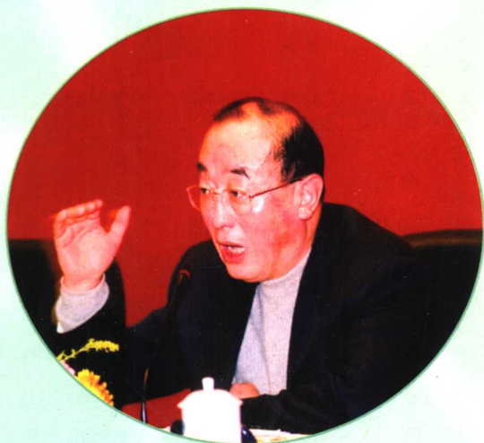
卫生部常务副部长高强出席2005年全国中医药工作会议,并发表重要讲话