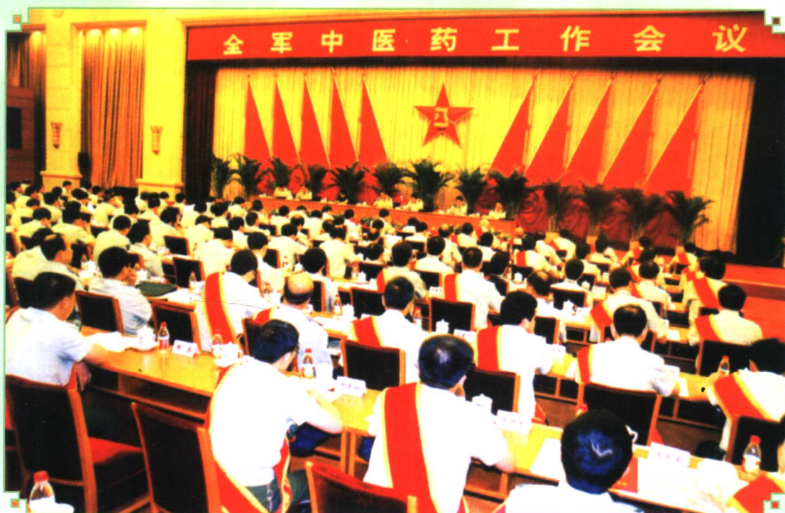
2005年7月28日，全军中医药工作会议在北京召开