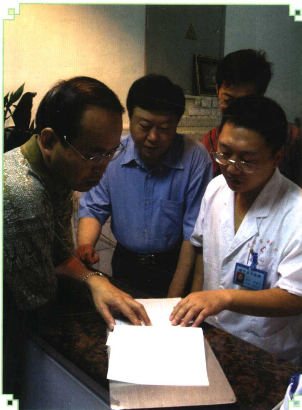
2005年9月20日,国家中医药管理局副局长吴刚到四川省遂宁市中医院调研