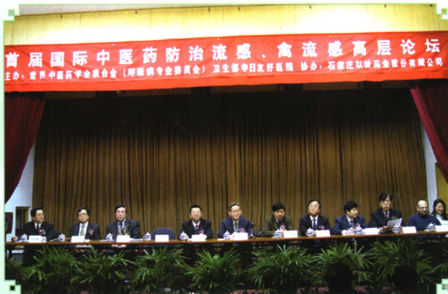
2005年12月29日,首届国际中医药防治流感、禽流感高层论坛在北京召开