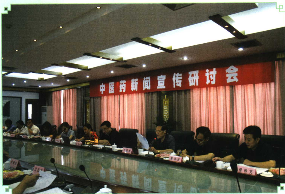
2005年7月25日,中医药新闻宣传研讨会在江苏省溧阳市举办