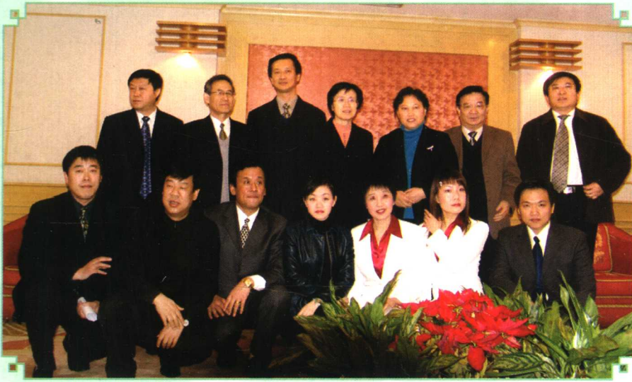
2005年3月1日，卫生部副部长兼国家中医药管理局局长余靖，国家中医药管理局副局长李振吉、房书亭、吴刚、于文明参加郭春园同志先进事迹报告会，并与参会人员合影