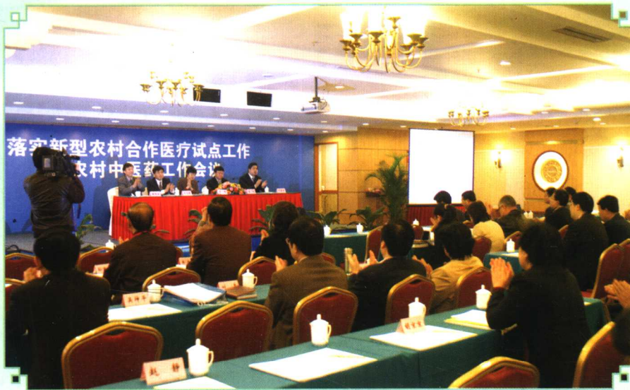
2005年11月10日,落实新型农村合作医疗试点工作暨农村中医药工作会议召开。卫生部副部长兼国家中医药管理局局长余靖,国家中医药管理局副局长吴刚、于文明出席了会议