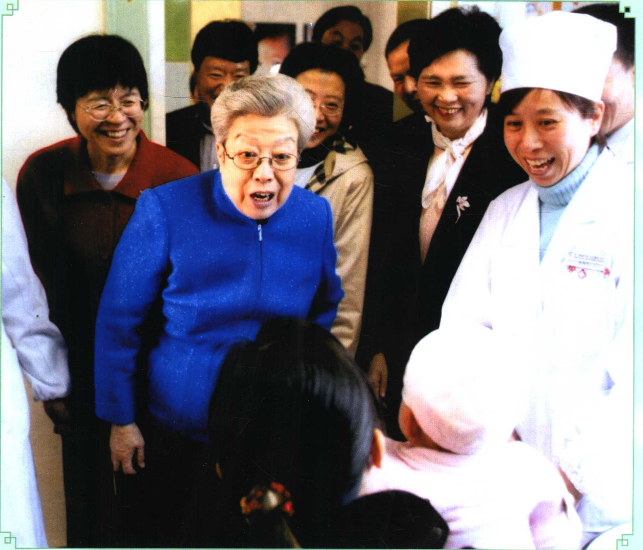
2005年11月21~24日,余靖副部长陪同吴仪副总理到浙江调研