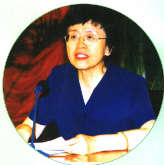
卫生部副部长兼国家中医药管理局局长余靖 出席会议并讲话