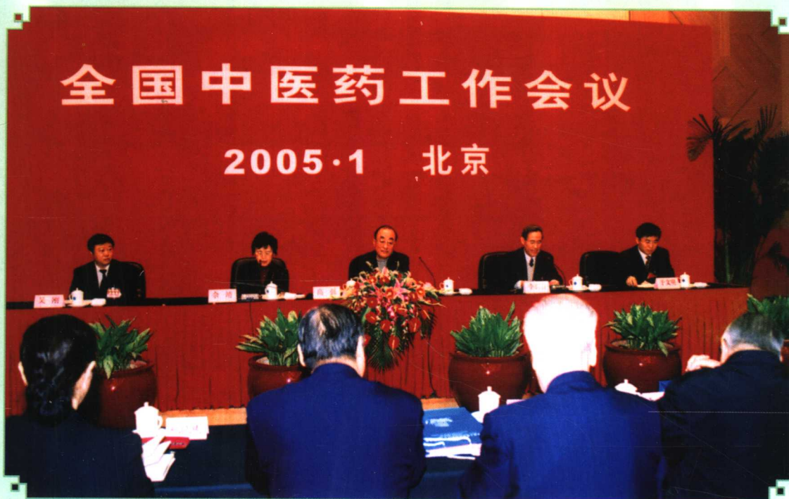
2005年1月6日,2005年全国中医药工作会议在北京开幕