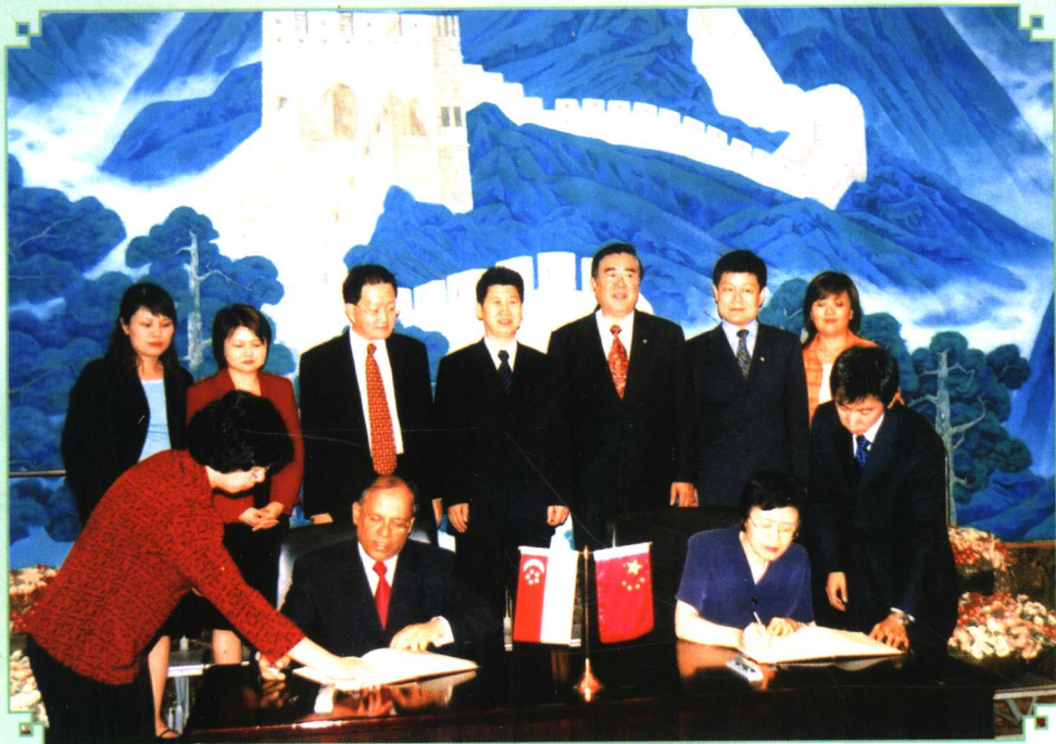
2005年6月,新加坡卫生部和国家中医药管理局在北京签署《中华人民共和国国家中医药管理局与新加坡共和国卫生部中医药合作计划书》