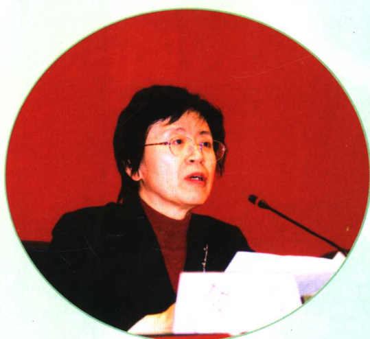
卫生部副部长兼国家中医药管理局局长余靖在2005年全国中医药工作会议上作题为“以‘三个代表’重要思想为指导 全面落实科学发展观 促进中医药事业全面、协调、可持续发展”的大会主报告