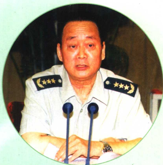
中央军委委员、总后勤部廖锡龙部长作重要讲话