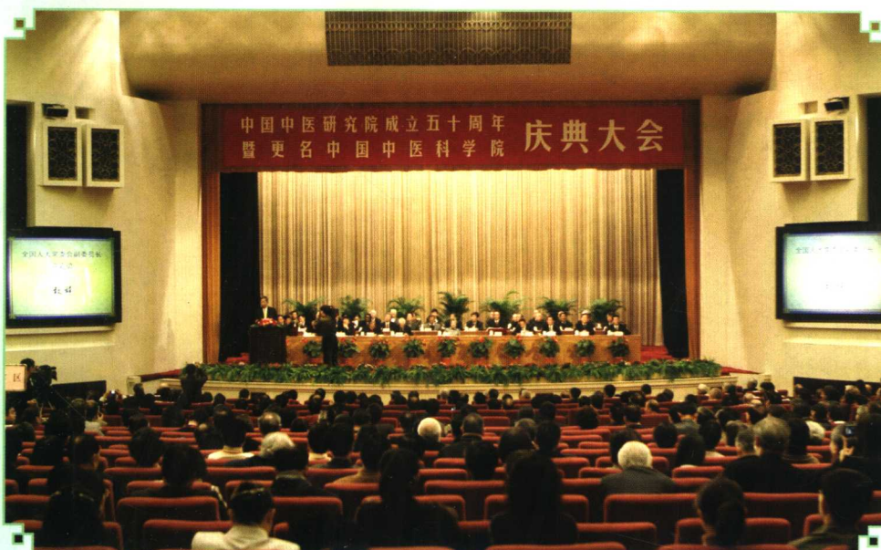
2005年11月19日,中国中医研究院在人民大会堂举办中国中医研究院成立五十周年暨更名中国中医科学院庆典大会