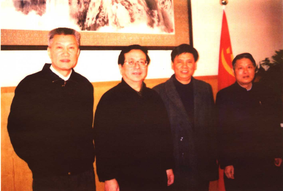
1998年12月3日，曾庆红同志与《曾山传》作者在中南海合影留念