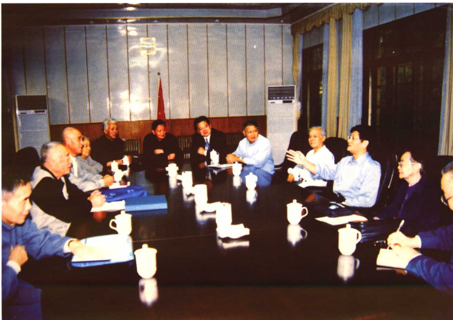
孟建柱书记与江西省新四军研究会负责人在省委常委会议室座谈