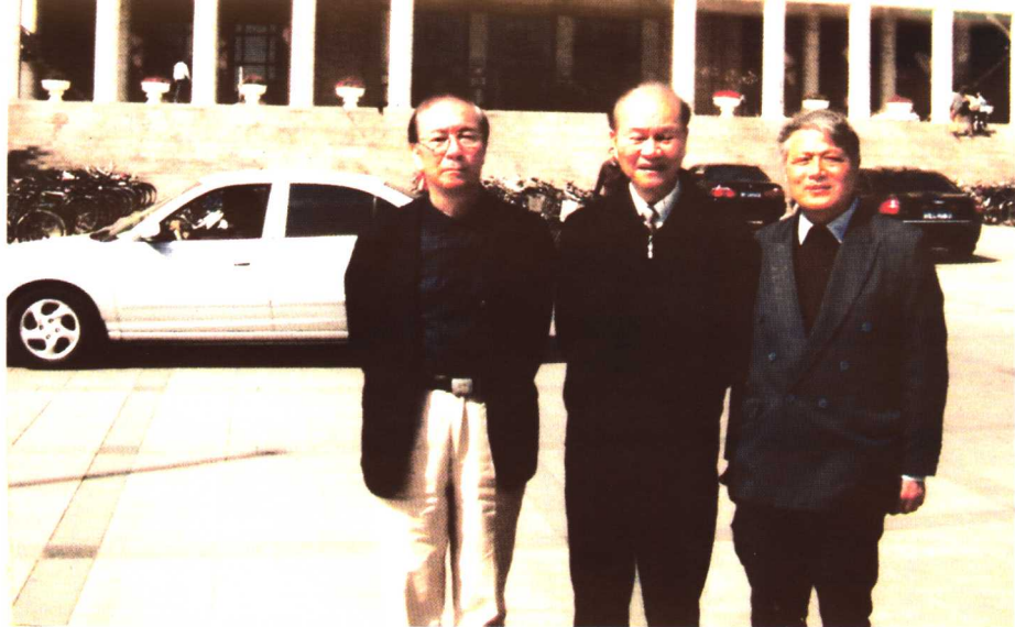
与南昌大学名誉校长、中科院院士潘际銮，南昌大学原副校长吴志强合影