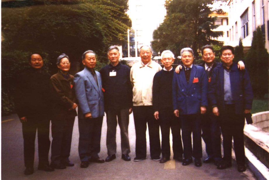
全国《中共党史人物传》的老编委们在一起