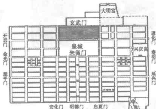
唐朝长安城平面图