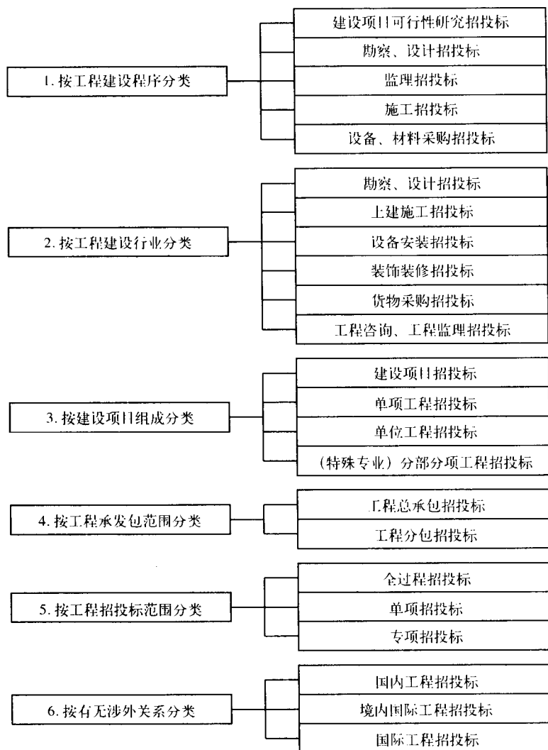
图1-1 建设工程招标投标的分类