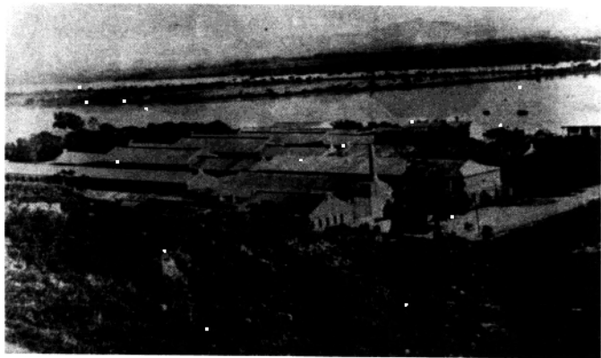
始创时期的黄埔军校全景

国共产党和苏联帮助下创办的，它是第一次国共合作的结晶。它以创造革命军来挽救中国的危亡为宗旨，培育了独特的校风；以“黄埔精神”锻造出一支新型的革命军队，培养出一大批军政人员，在大革命时期为扫除反动军阀及其封建势力，尔后在反抗日本侵略，保卫中华的战争中，都起到了重要的历史作用。