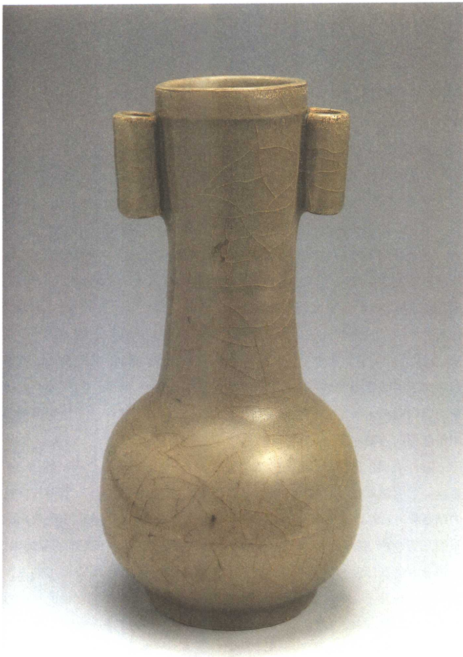
南宋 / 青瓷贯耳瓶