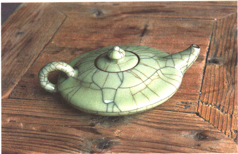
现代青瓷作品 / 壶