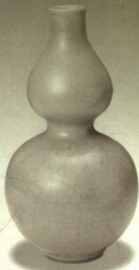
龙泉窑瓷器·元·葫芦瓶