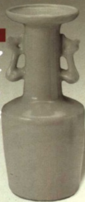
龙泉窑瓷器·南宋·风耳瓶