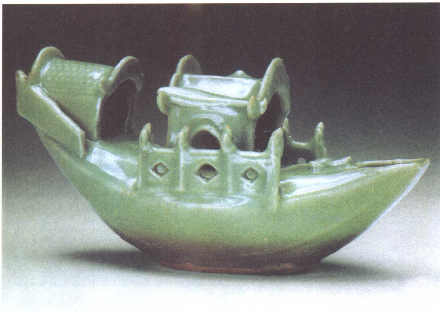
元 / 滴舟