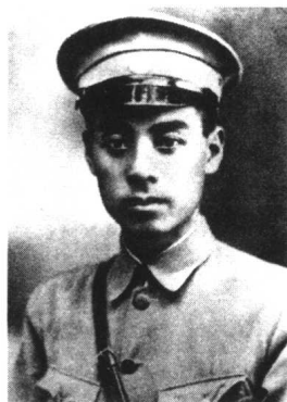
1924年11月，周恩来在黄埔军校担任政治部主任