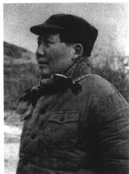
毛泽东率领红军终于摆脱了敌人的围追堵截，战胜了说不尽的困苦，以“不到长城非好汉”的气吞山河的凌云壮志来到了一片新天地——陕北