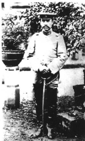
1916年秋，朱德在四川泸州

去濮阳与敌同行。 朱德总司令代表党中央和中央军委亲临华东野战军前线视察和动员，陪同前往的有陈毅和粟裕。他们一路艰辛一路风尘，乘着汽车深夜与敌人同行百里，在敌人的鼻子底下通过了封锁线，于5月11日安全抵达濮阳。..... 309