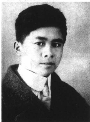
1921年，时在莫斯科时的 任弼时