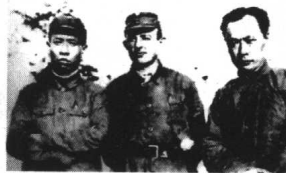
1941年，刘少奇、陈毅同奥地利医生罗生特在苏北盐城

刘少奇一行渡沐河、沂河、经临沂、费县、滕县、峰县，行程数百里，抵达山东枣庄西南的小北庄。由铁道游击队负责护送过津浦铁路。8月下旬，渡过卫河，由河南进入河北。刘少奇化装成商人乘坐小汽车，在白天顺利通过了平汉铁路。刘伯承、邓小平为表示慰劳，专门为远道而来的刘少奇准备了一餐“筵”——