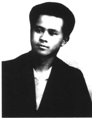
1921年8月，任弼时开始在莫斯科东方劳动者共产主义大学学习