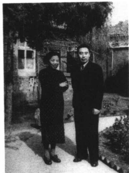
1946年，周恩来与邓颖超在梅园新村三十号字 内留影