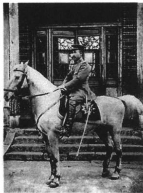
护国军时期的朱德