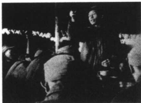
1941年，刘少奇在华中局党校作讲演

走廊上站满了荷枪实弹的卫兵，台阶两边架着机关枪，杀气森森。刘少奇面对生命威胁，刘少奇大义凛然：“万余工人如此要求，虽把代表斫成肉泥，仍是不能解决！”…………… 199