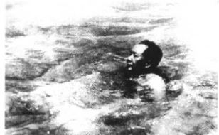
1956年夏天，毛泽东首次畅游长江