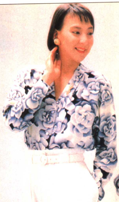
37 (作り方) 191 ページ