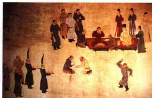
五代契丹画家胡瓌《卓歇图》中的歌舞表演