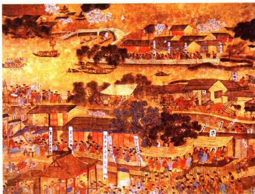
常熟翁氏旧藏明人画《南都繁会景物图卷》（局部）