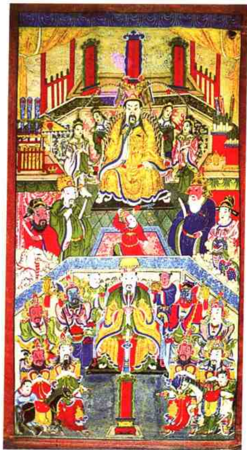
清代甘肃民间戏班供奉的庄王爷