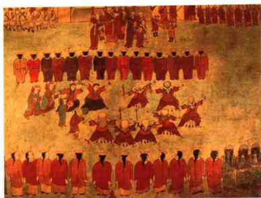
西藏桑耶寺白面具戏壁画