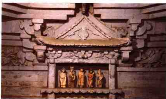
江西鄱阳南宋洪子成墓出土的南戏人物瓷俑