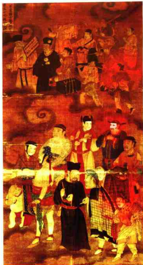
山西右玉宝宁寺明代水陆画中的戏剧人物