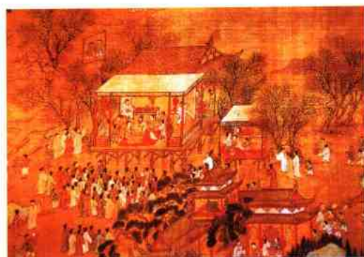
明人绘《南中繁会图》