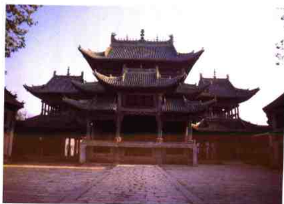
河南社旗山陕会馆戏楼