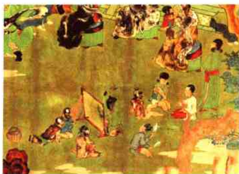
山西繁峙岩山寺金代壁画影戏图