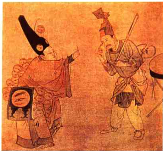
宋杂剧《眼药酸》绢画