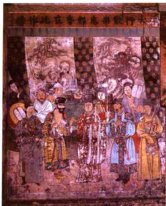
山西省洪洞县明应王殿元代戏曲壁画