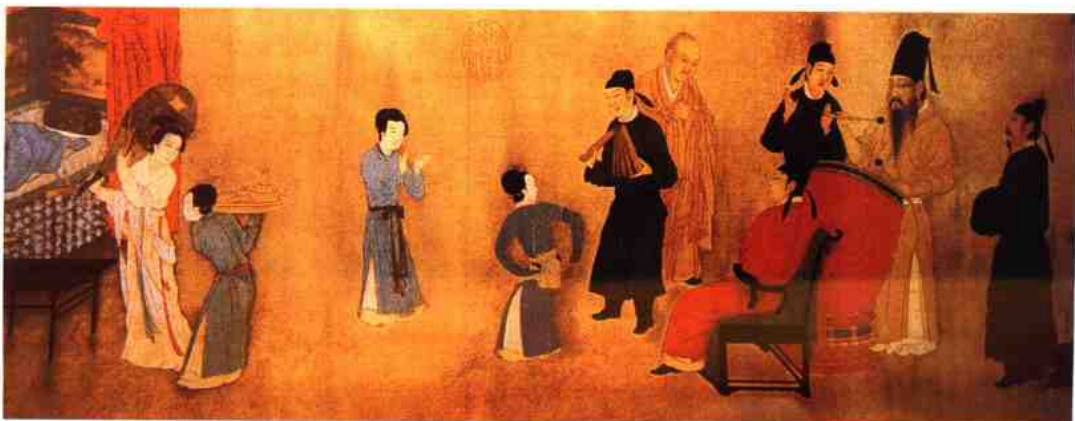
五代南唐顾闳中《韩熙载夜宴图》（局部）