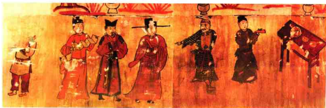
山西运城西里庄元墓壁画