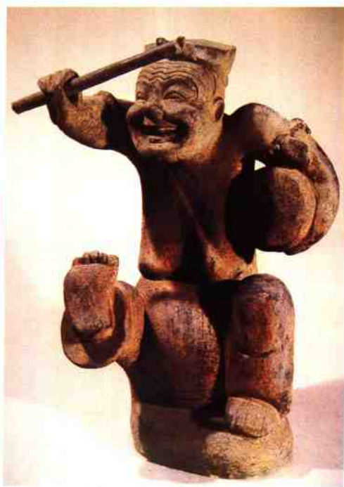
四川成都出土的东汉击鼓说唱俑