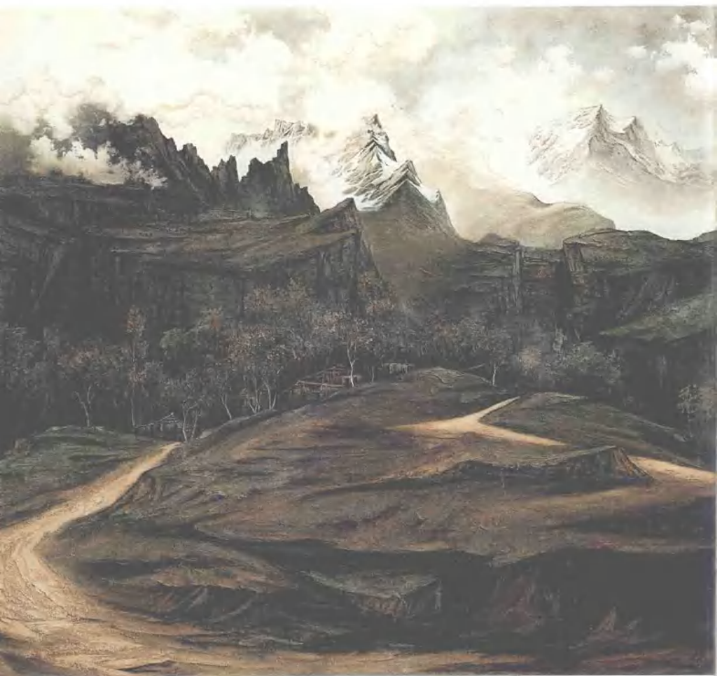
玉龙雪山 200cm × 180cm 砂石画 2003年