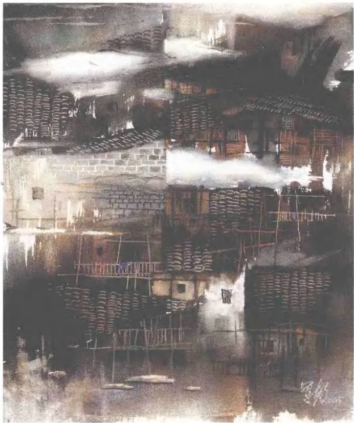
印象湘西 60cm × 50cm 砂石画 2005年