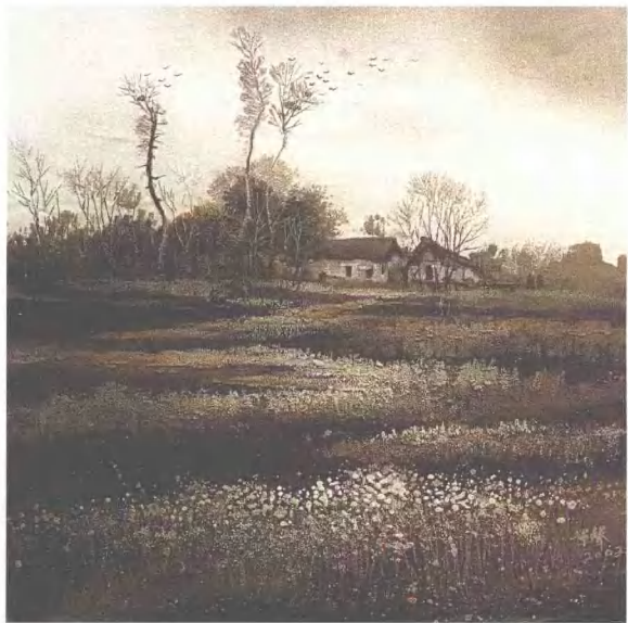
出巢 80cm×60cm 砂石画