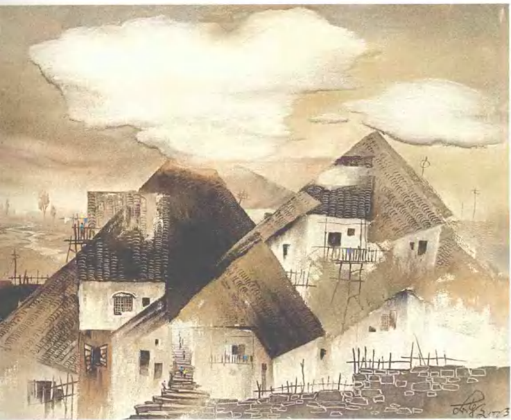
云·屋 110cm×120cm 砂石画 2003年