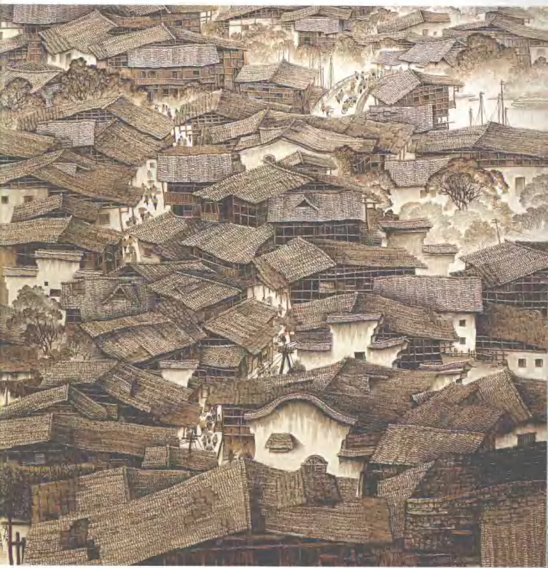
古城 120cm × 110cm 砂石西 2000年