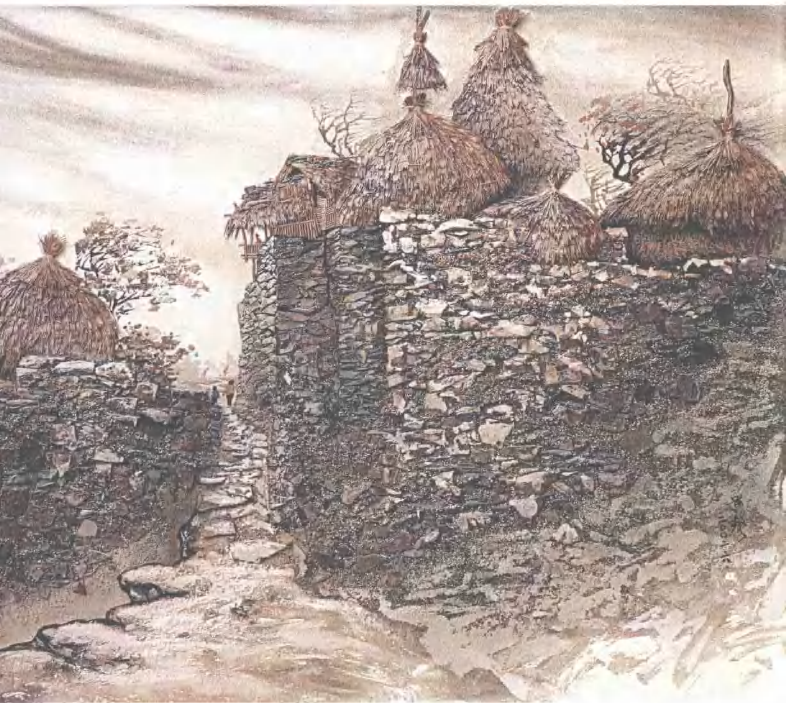
秋风 80cm × 90cm 砂石画 2002年