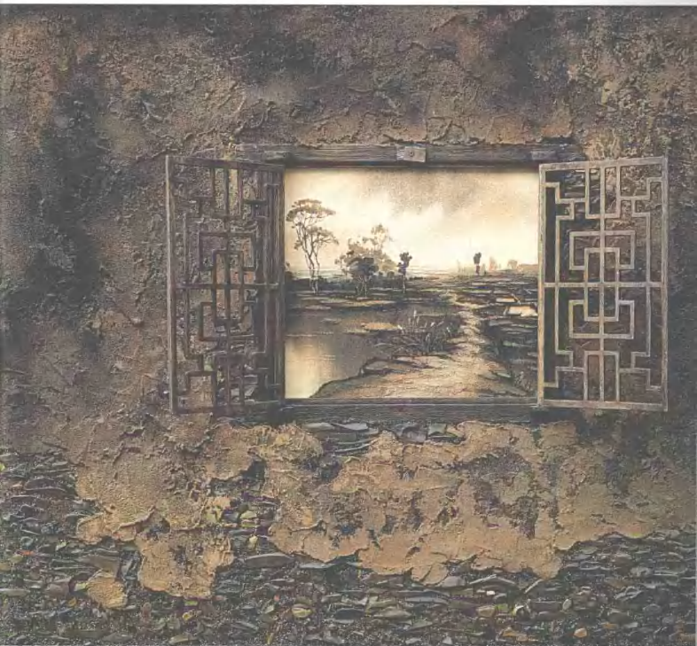
窗外风景 120cm×110cm 砂石画 2003年