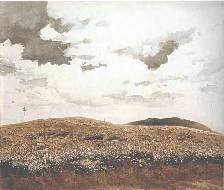
高原 110cm×120cm 砂石画 2003年