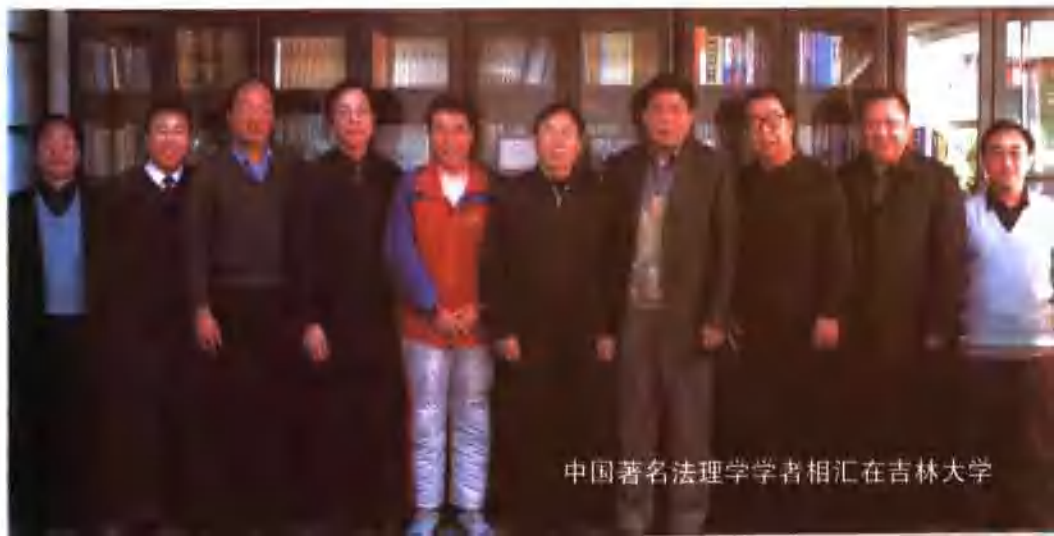
中国著名法理学学者相汇在吉林大学