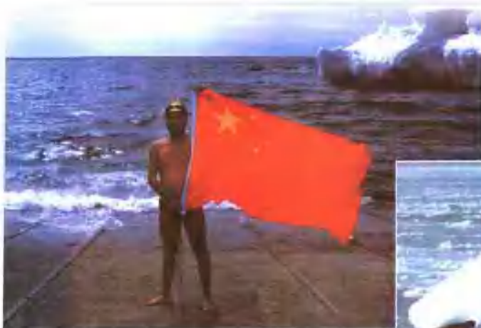
祖国在我心中（麦哲伦海峡）