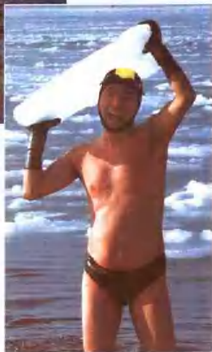
挑战南极的中国冰人