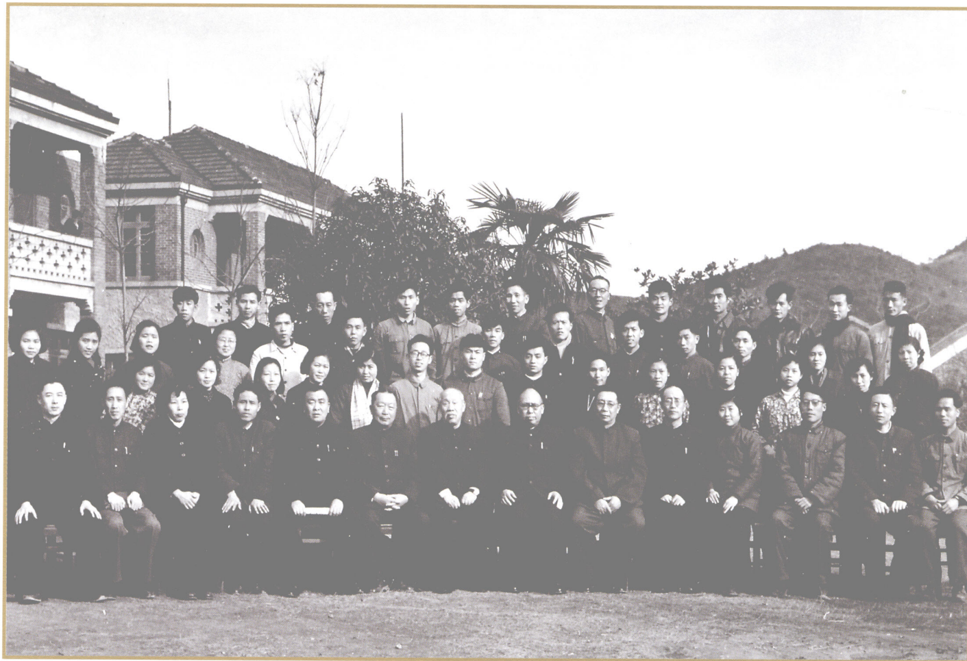
1959年2月28日 董必武、罗荣桓、聂荣臻等视察南方公司