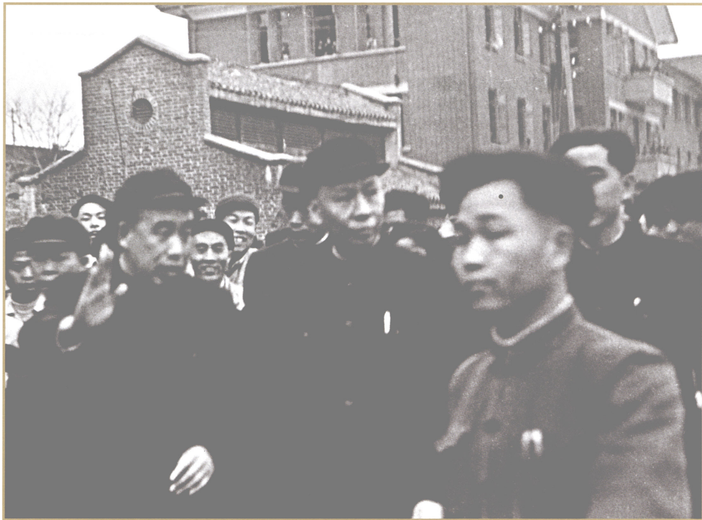
1957年3月 刘少奇视察南方公司