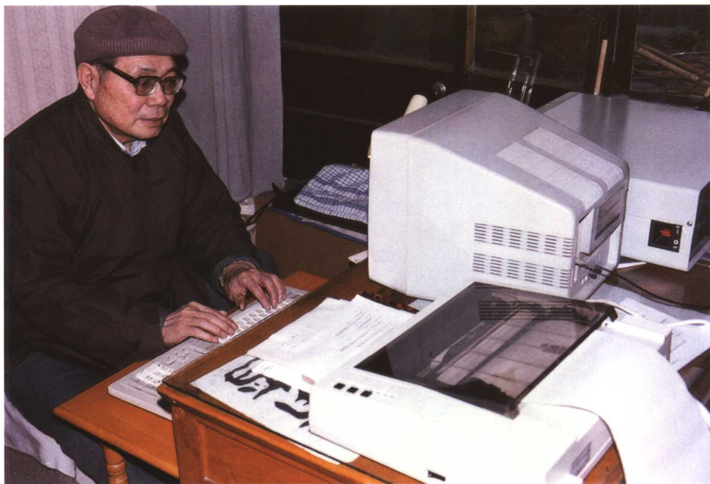
1988年开始用电脑创作《雷神传奇》