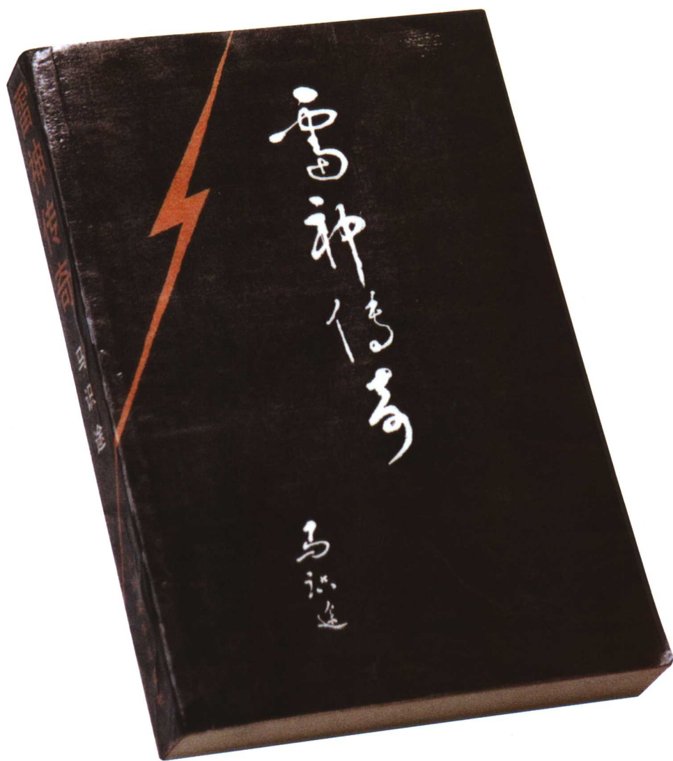
人民文学出版社出版的《雷神传奇》