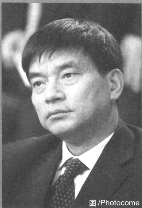
图 / Photocome