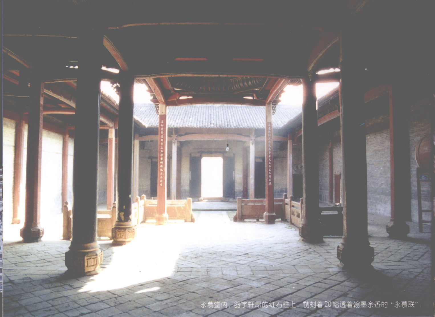
永慕堂内，器宇轩昂的红石柱上，镌刻着20幅透着翰墨余香的“永慕联”。