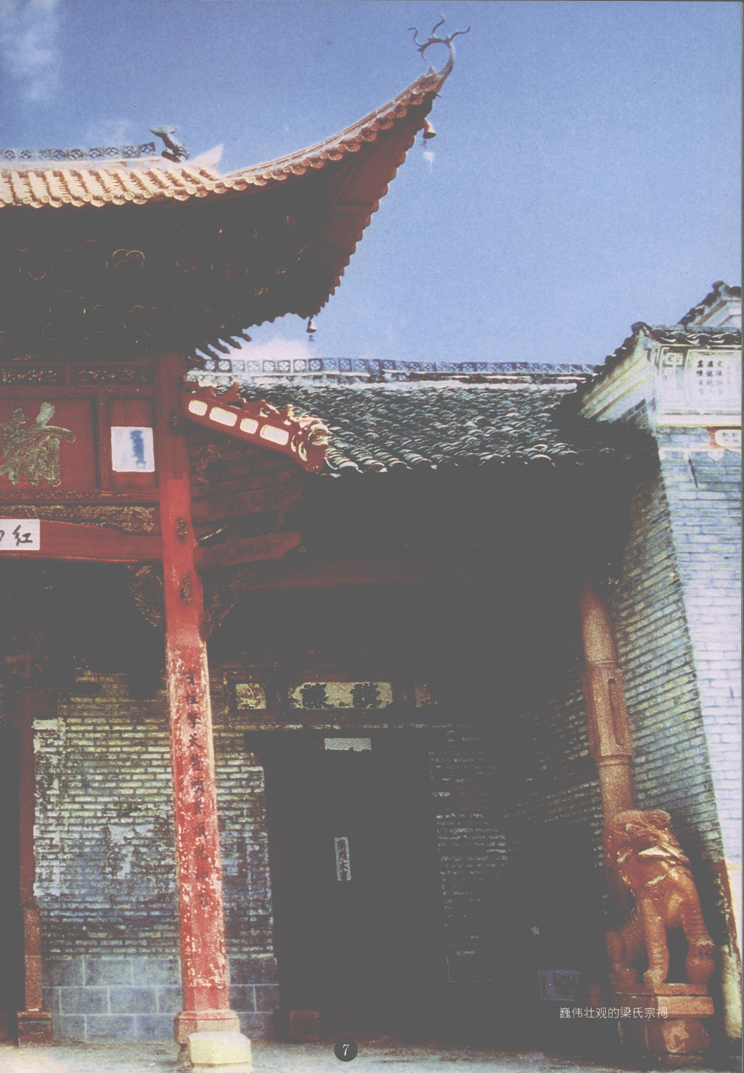
雄伟壮观的梁氏宗祠