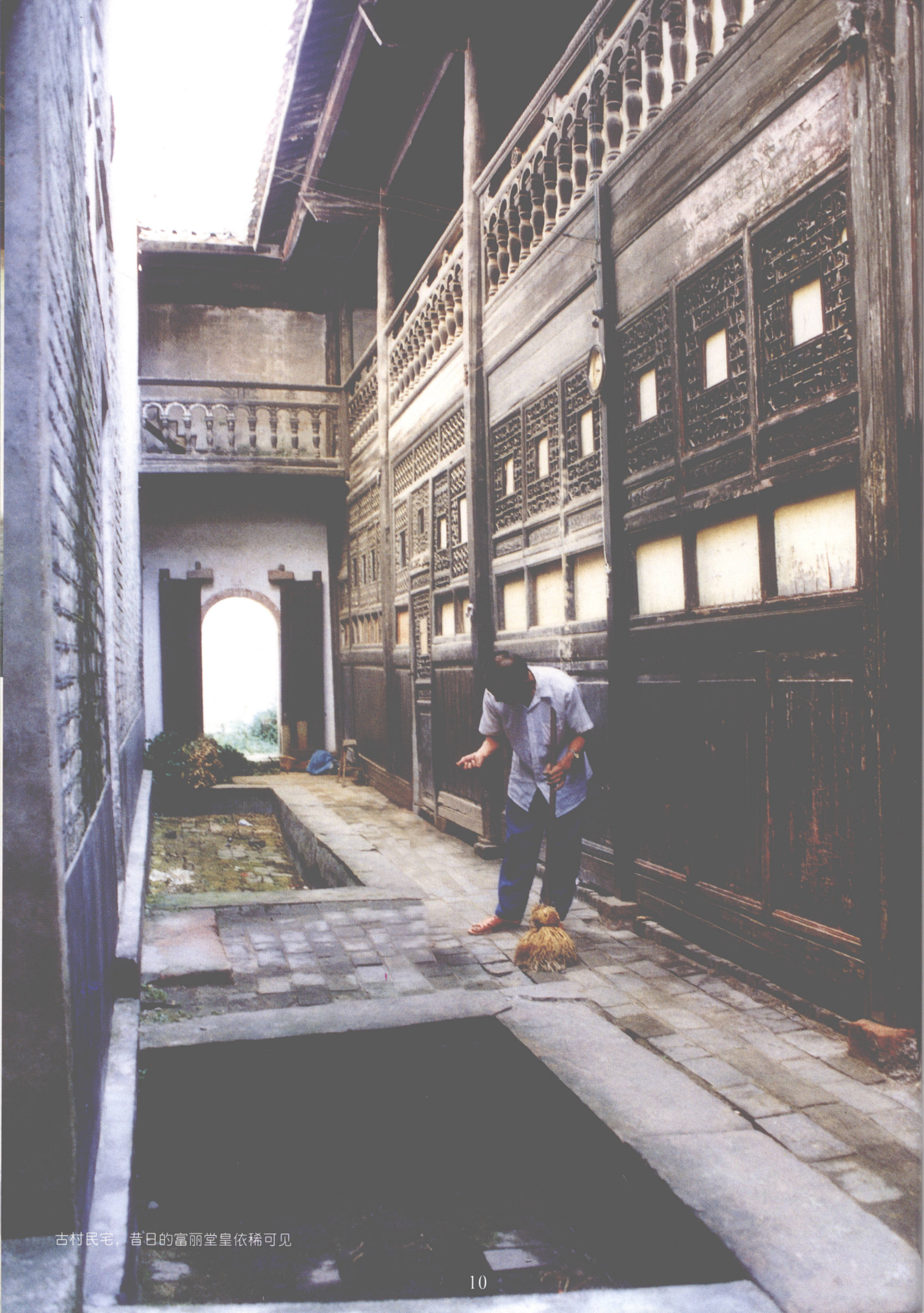
古村民宅，昔日的富丽堂皇依稀可见