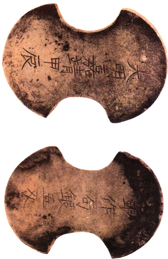
官铸标准赋银 长70mm 重185g 三级 50000元