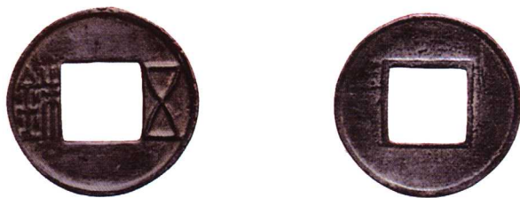
直径 24.8mm 重 3.17g 四级 7000 元