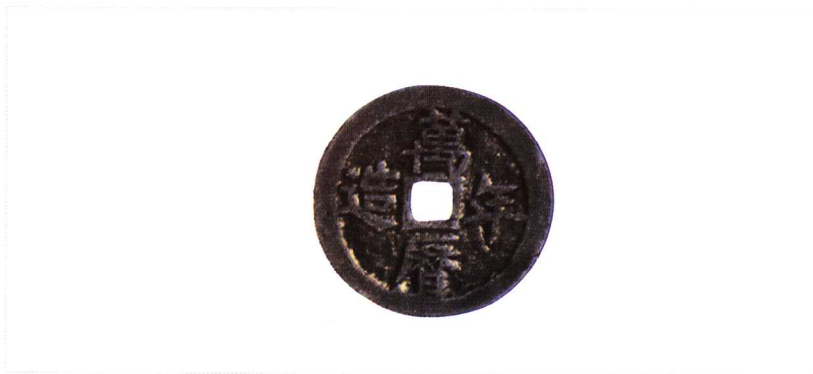
万历年造背二钱 直径27mm 重7.5g 二级 80000元