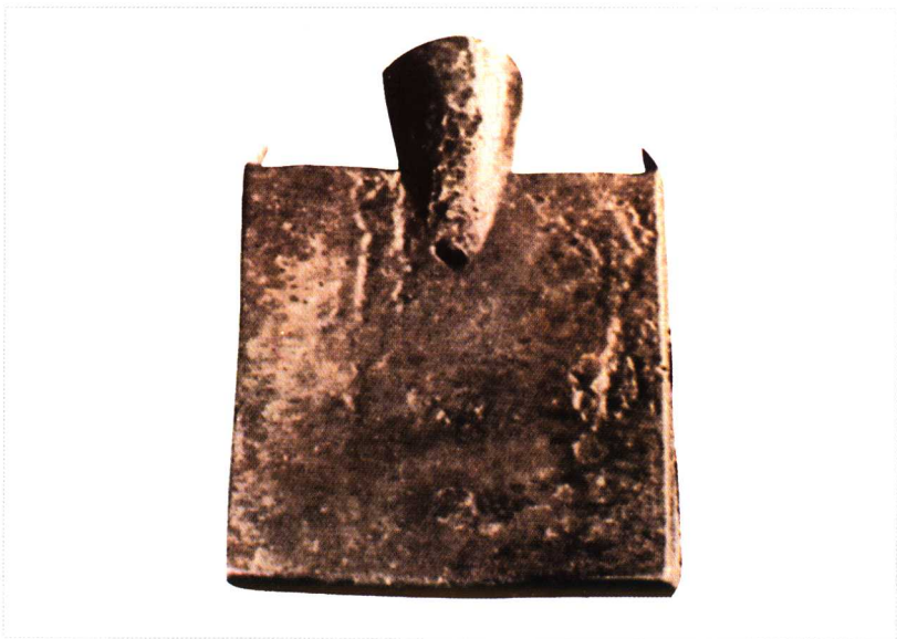
小型（实首短身） 二级100000元

备注： 1974年8月，河南扶沟古城出土。共计18件，内中仅一件空首，余均为实首。按布体的尺寸可分长、中、小三型。其中最长者长157mm，宽58mm，重188.1克；最小者长84mm，宽58mm，重134克。又，实首布中有三件背部有刻文“五”字。