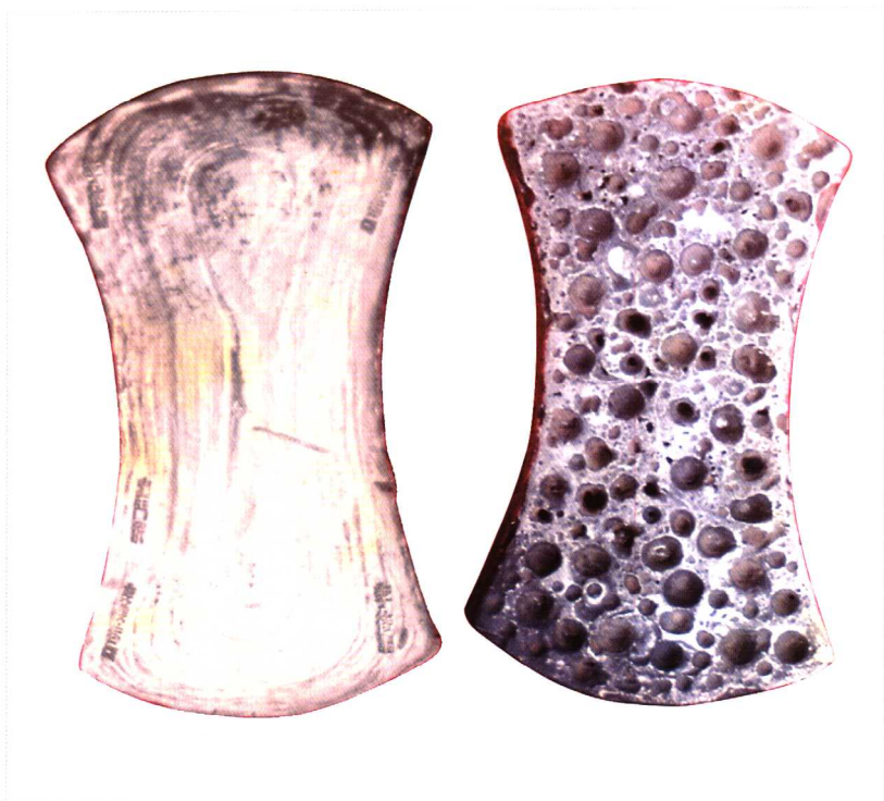
出门税 姜口巷口 李待诏 (中型錠) 长122mm 肩宽71mm 腰宽51mm 厚15mm 重980g 按,应属宋代二十五两中型錠范制。 四级 15000元