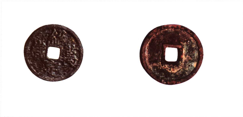
银质鎏金 直径 23.2mm 重 3.2g 三级 25000 元 (注) 精美绝伦之作