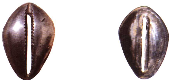
长 15mm 宽 10.5mm 重量不详 六级 2000 元

备注： 此系王室赏赐臣僚或贵族王侯间朝聘、馈赠专用，一种价值较高的货币。1974年河北平山出土