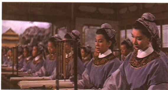
从艺术性和娱乐性方面均将黄梅调电影推向了顶峰。剧照中这场学堂读书戏是传统剧目及其他电影版本中所没有的，代表了香港电影创作者革新传统的匠心。