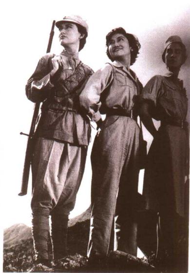
“电懋”的史诗性爱情巨片。