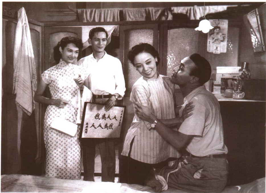
优秀粤语电影的代表之作，亦是香港电影传承传统文化的有力见证。