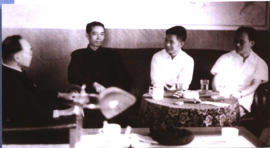
1956年，胡耀邦同志到原吉林大学视察，并同校长匡亚明、副校长刘靖座谈。