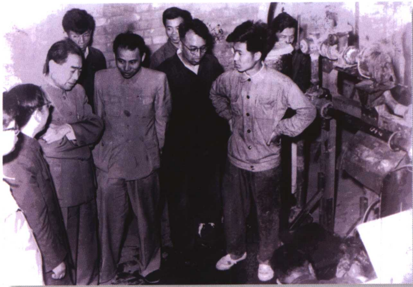
1958年，周恩来同志在北京农用机械研究所参观原吉林工业大学戴桂蕊教授研制的农用内燃水泵。