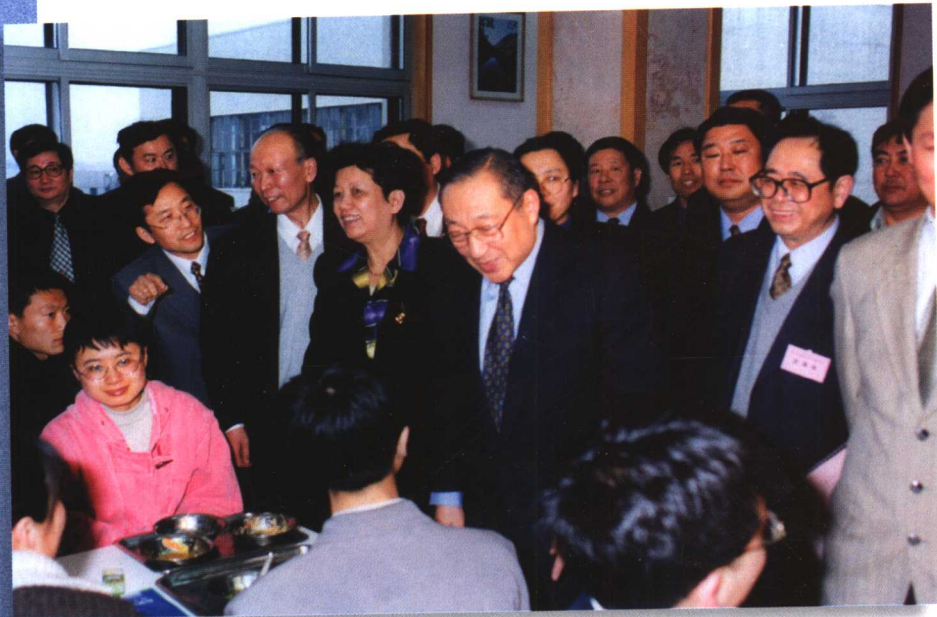
1999年，李岚清同志在陈至立同志的陪同下到原吉林大学视察。