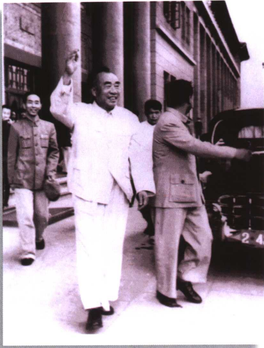
1959年，朱德同志到原长春科技大学视察。