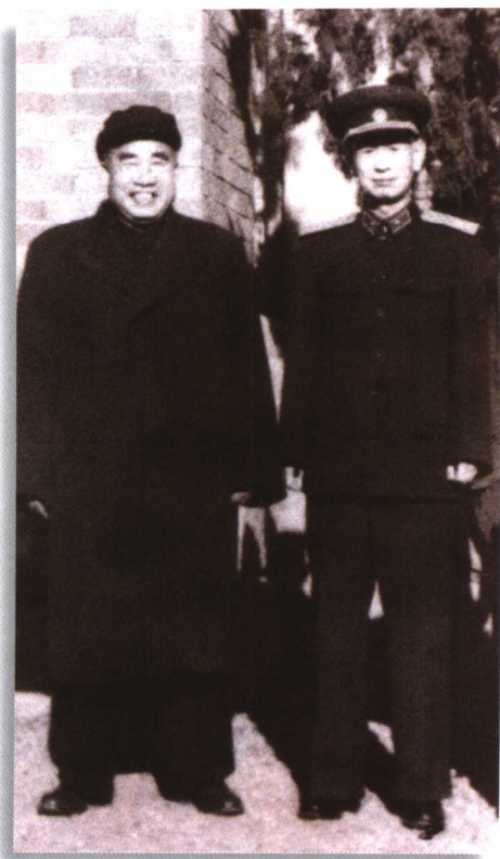
1958年，朱德同志在长春接见原白求恩医科大学校长殷希彭。