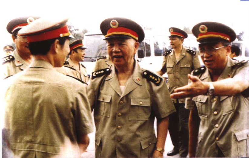
1993年，刘华清同志到原中国人民解放军军需大学视察。