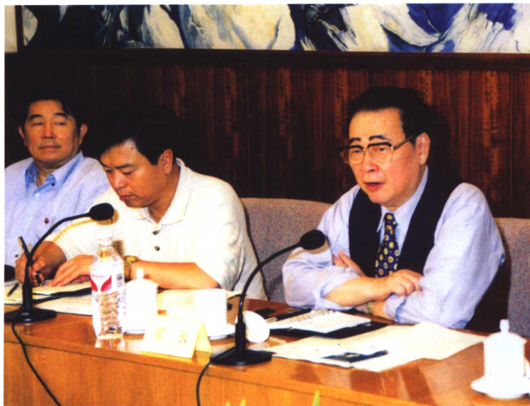
1998年，李鹏同志到原吉林大学视察。