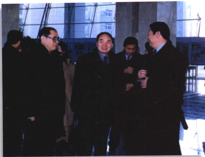
2002年，周济同志到我校视察。