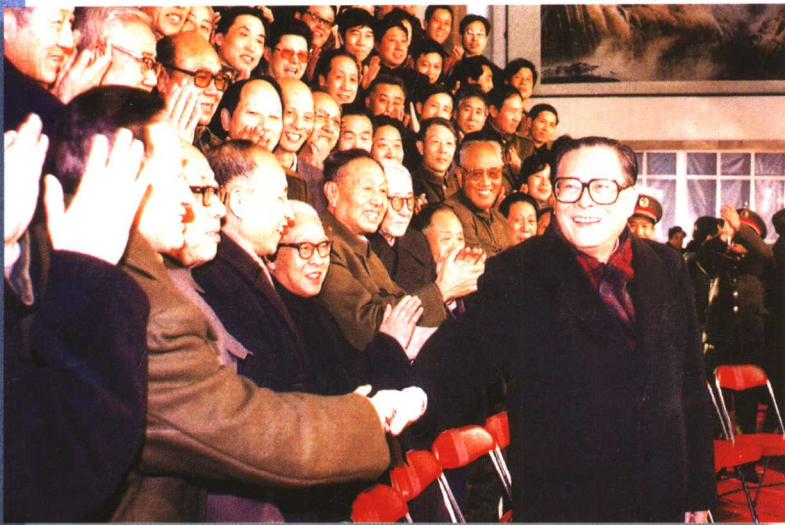
1991年，江泽民同志接见原中国人民解放军军需大学专家教授和师以上领导干部。