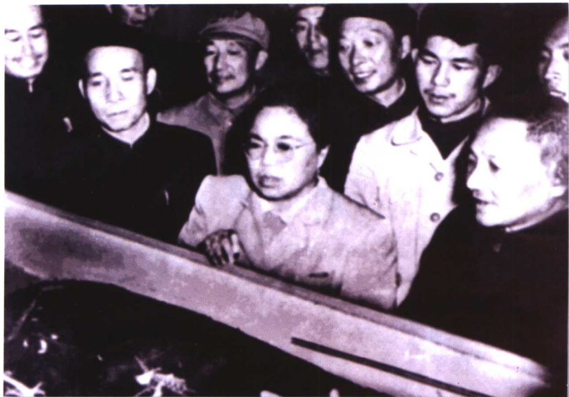
1958年，邓小平同志到原长春科技大学视察。