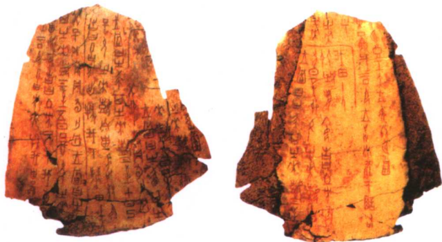
●大型涂朱红牛骨刻辞

这是商王武丁时期的甲骨文。商朝的甲骨文是占卜时刻在龟甲或者兽骨上的象形文字,也称卜辞。河南安阳殷墟有大量出土。