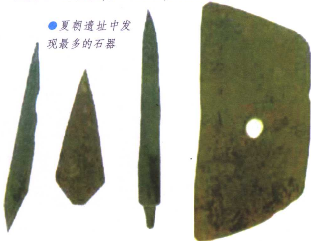
●夏朝遗址中发现最多的石器

到了晚年，桀更加荒淫无度，他竟命人造了一个大池，称为夜宫。他带着一大群男女杂处在池内，一个月不理朝政，对天下的百姓更是不闻不问。太史令终古见桀如此荒淫无度，便哭着向桀进谏，桀不但不听，反而很不耐烦，斥责终古多管闲事。终古见桀已不可救药，就投奔了商汤。老百姓们怨声载道地说：“这个太阳啊，你什么时候能够消灭，我们宁愿与你