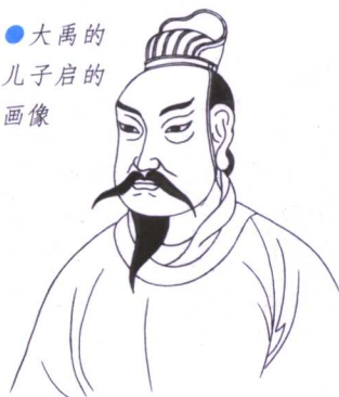
●大禹的 儿子启的 画像

大禹改变了他父亲的做法，他采用开渠排水、疏通河道的方法，想把洪水引到大海里去。在大禹治水的十三年中，曾三次经过自己的家门，但都没