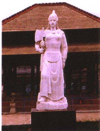
● 妇好汉白玉雕像(武丁的妻子)