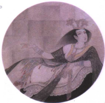
●邹莉画作·夏桀妃子妹喜