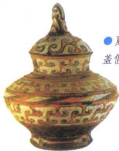
●夏朝·彩绘带盖假圈足陶罐