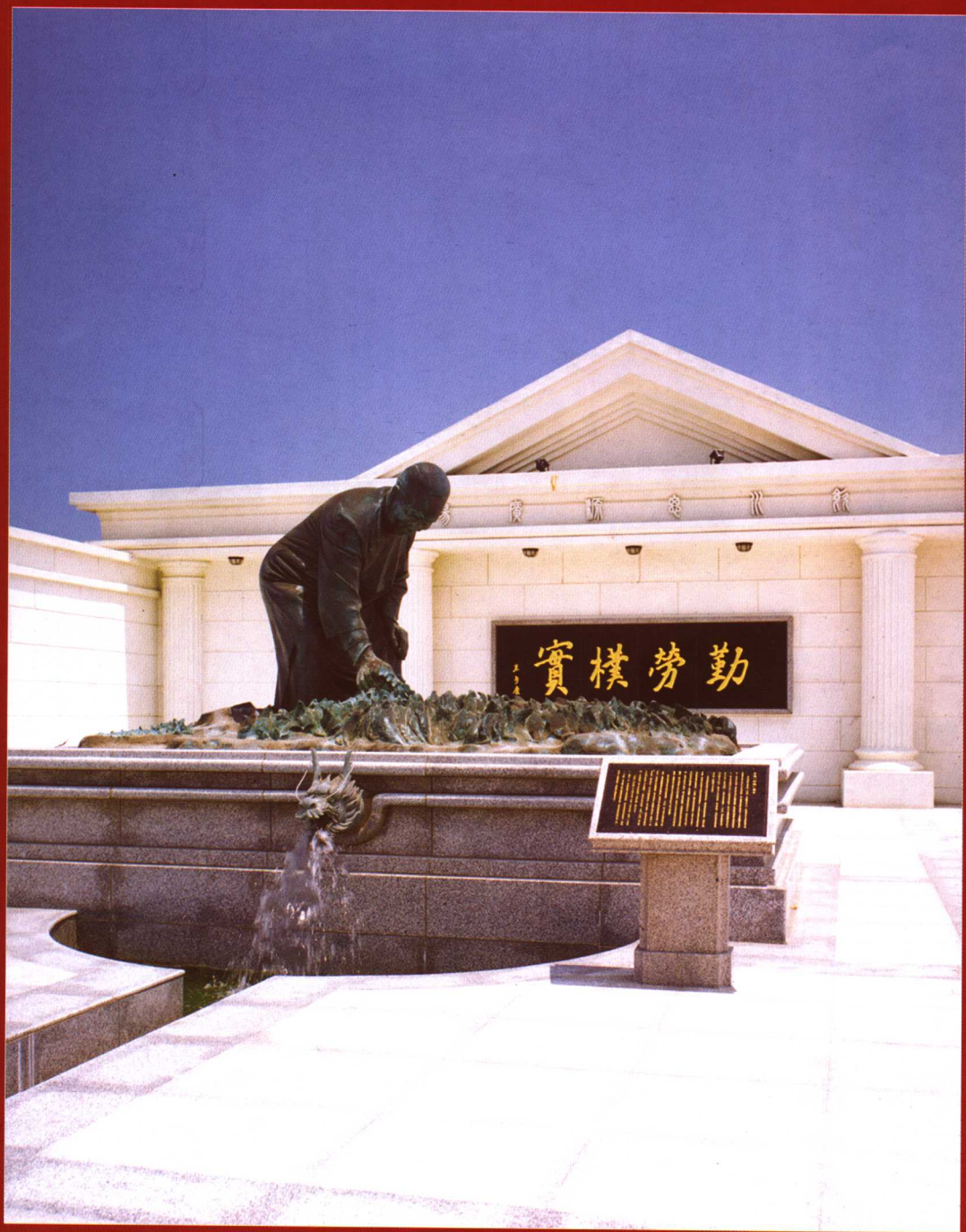
六轻厂区“阿妈公园”内的王永庆母亲塑像