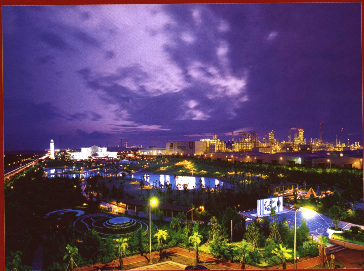
▲ 黄昏时分的六轻厂区“阿妈公园”