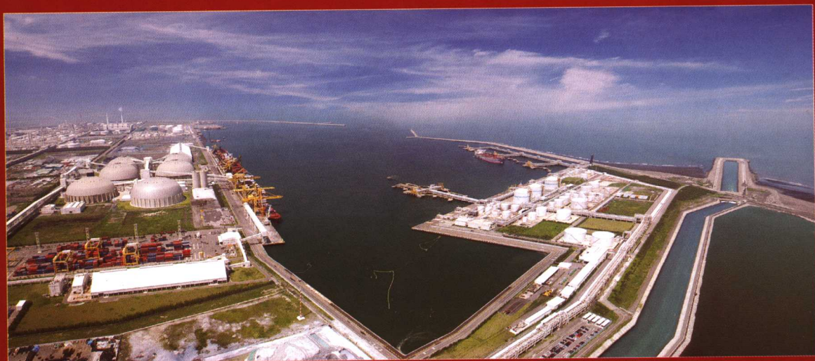
▲ 六轻厂区麦寮港全景