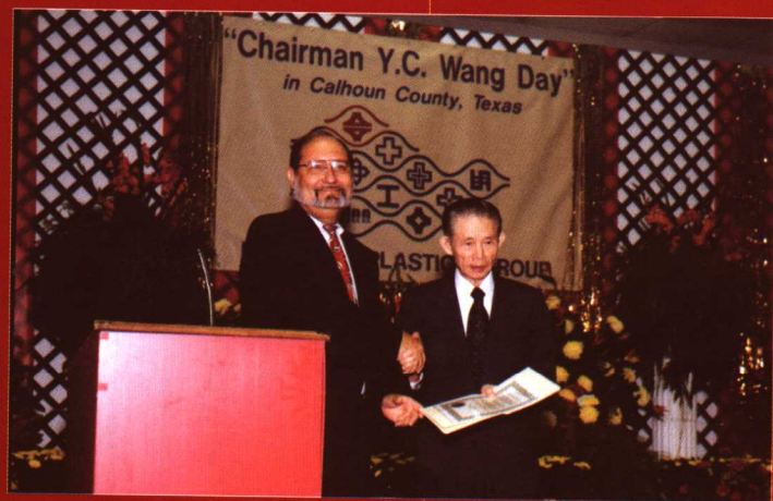
美国德克萨斯州的“王永庆日”