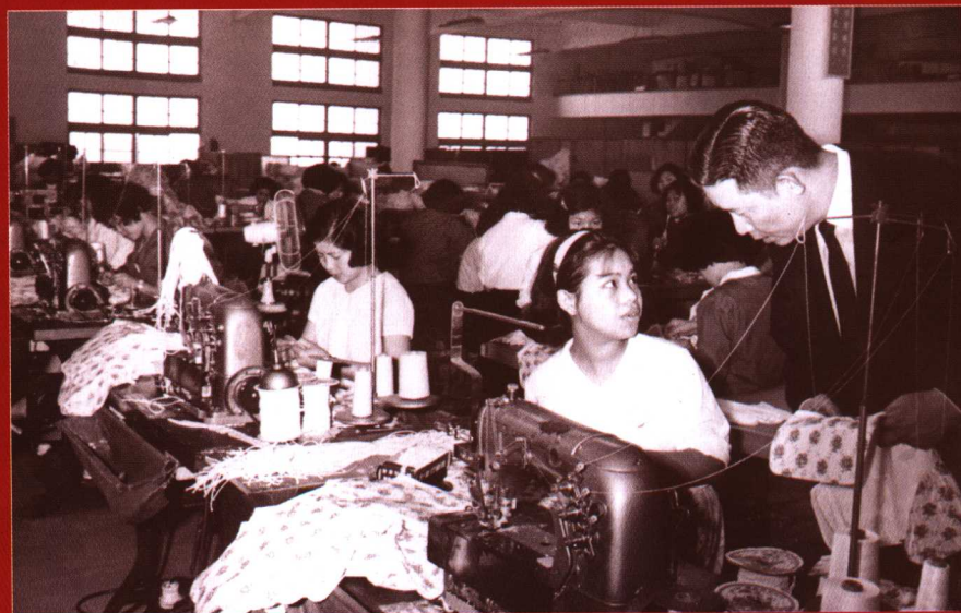
1970 年王永庆巡视工厂并与员工亲切交谈 ◀