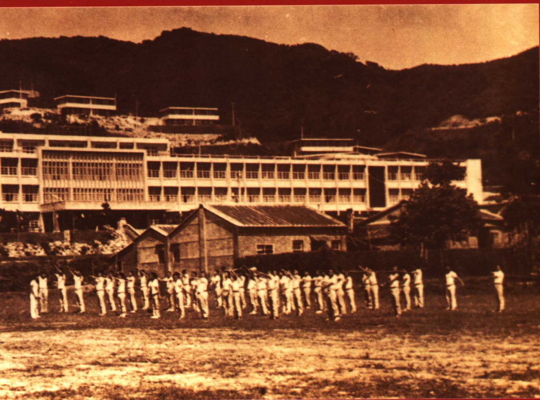
1963 年明志工专创校时的情景 ◀