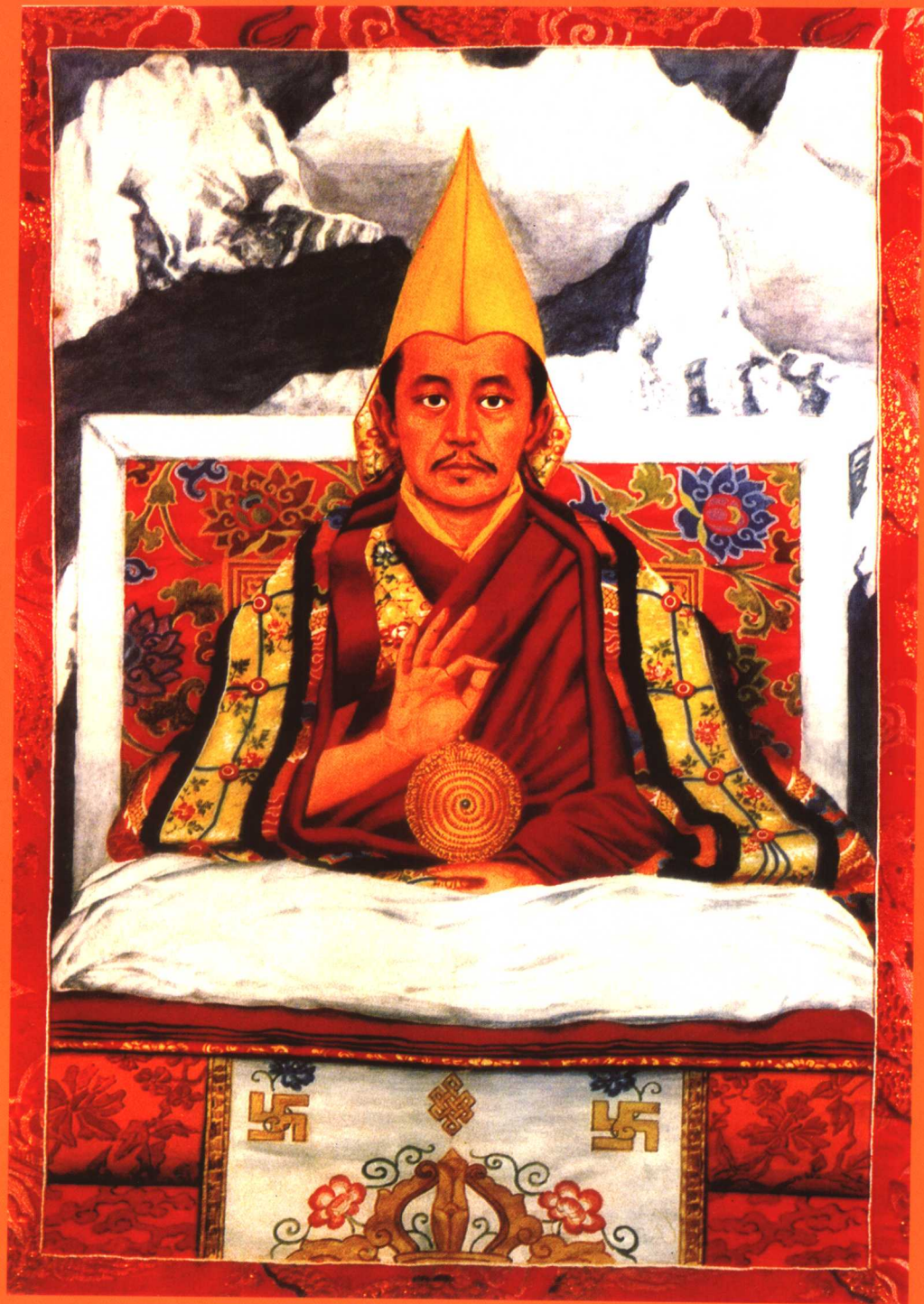
五世达赖喇嘛阿旺罗桑嘉措