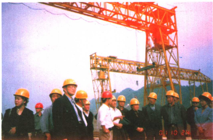
▶二〇〇二年春节期间，工委领导到黔西西桥村移民点慰问。