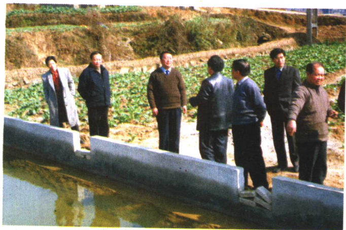
◀ 工委领导在黔西检查工作