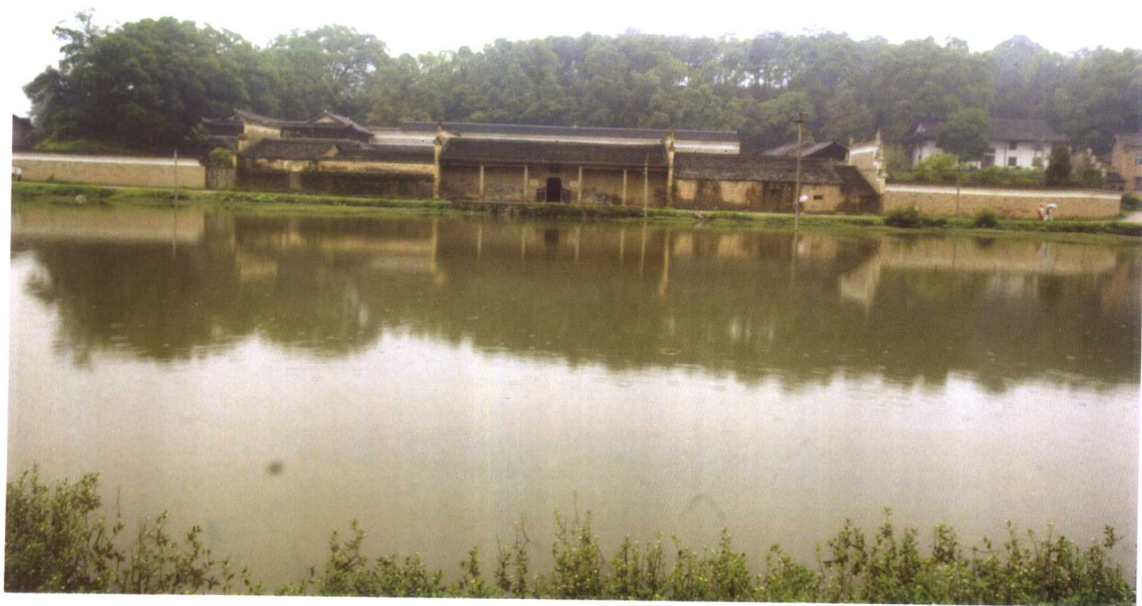
曾国藩老家富厚堂正面远观图。左右宽500米。门前的大片农田现已辟为园林水池，正在修建之中。右上角白屋即思云馆。