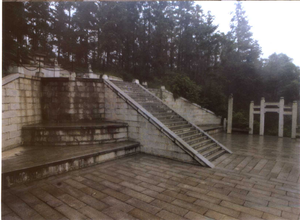
湖南长沙坪塘伏龙山曾国藩墓