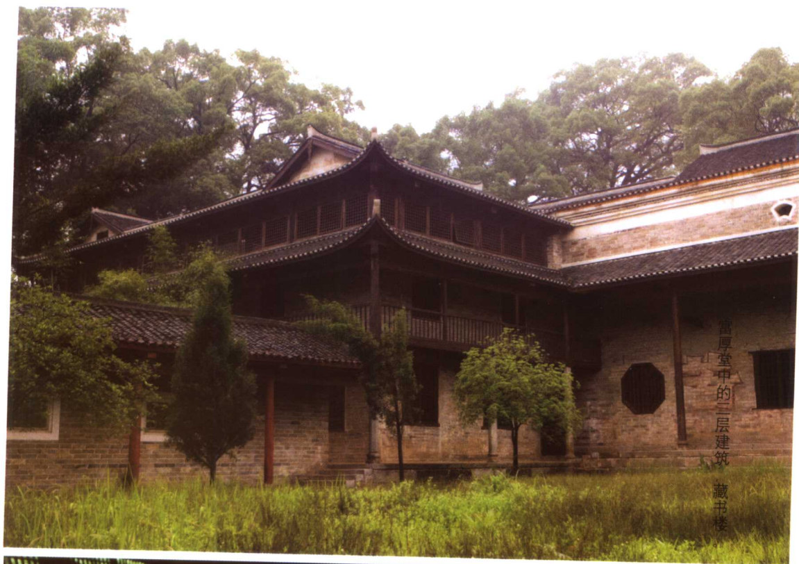
富厚堂中的三层建筑——藏书楼