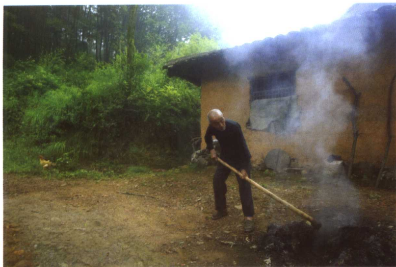
曾国藩墓地山下居住的老人