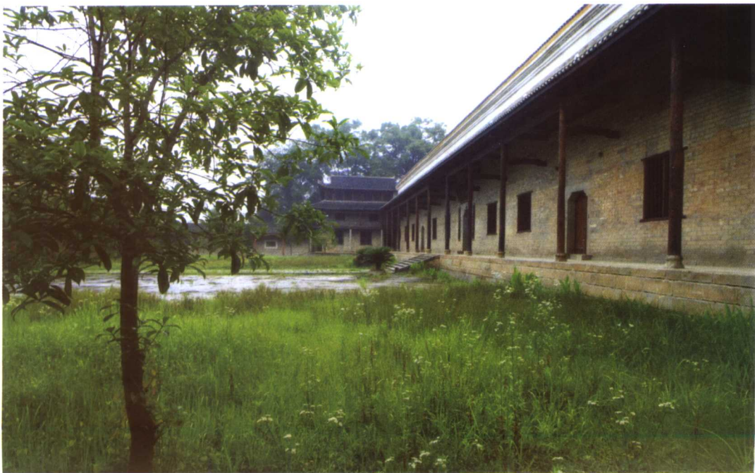
富厚堂前院看藏书楼