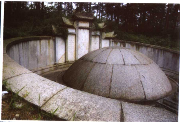
湖南长沙坪塘伏龙山曾国藩墓