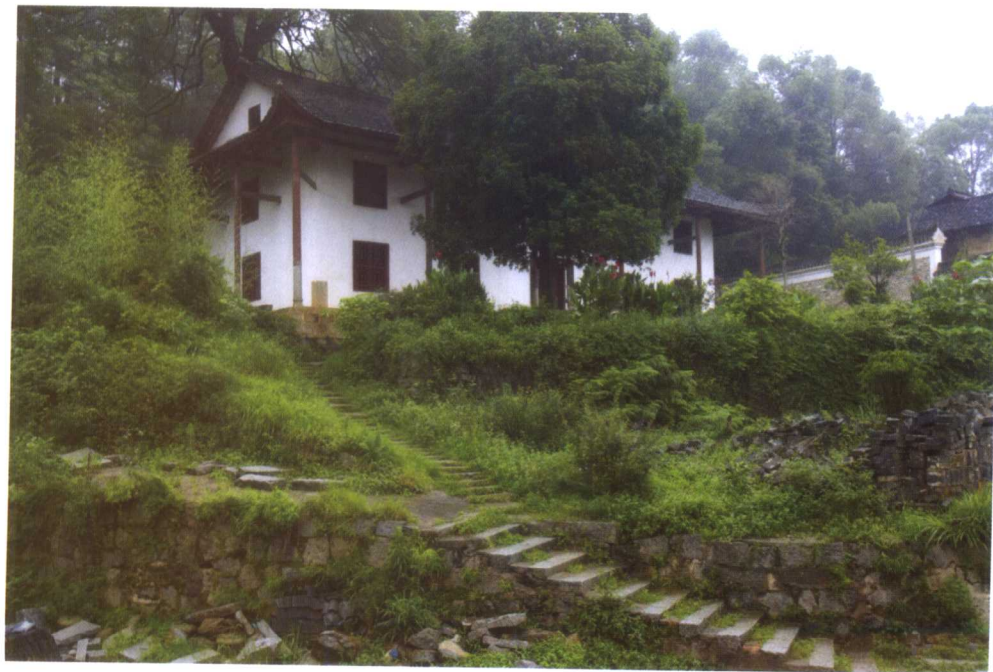
思云馆。曾国藩1857年3月26日从江西前线委军奔丧，即住在这里。