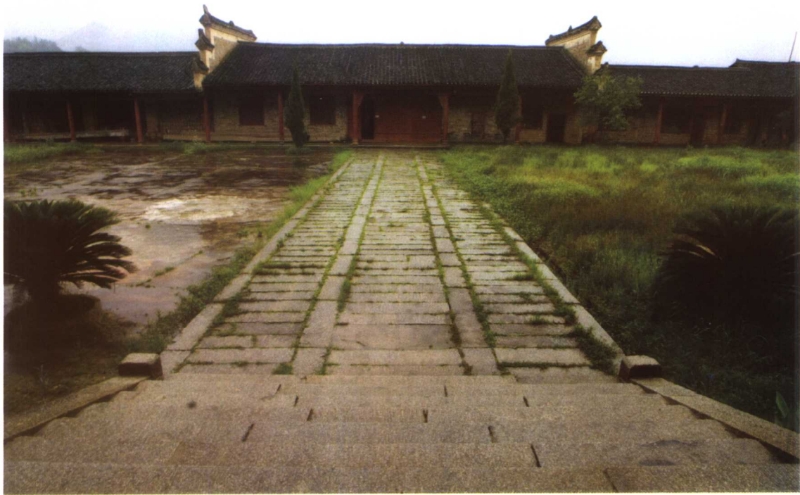
富厚堂前院看大门