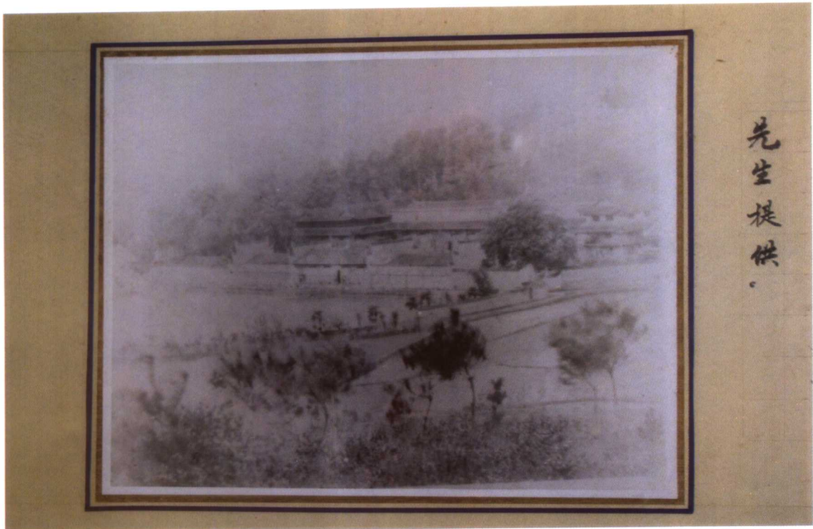
抗战期间拍摄的富厚堂照片。曾氏兄弟先后修建了5处规模宏大的宅邸，今仅存富厚堂。