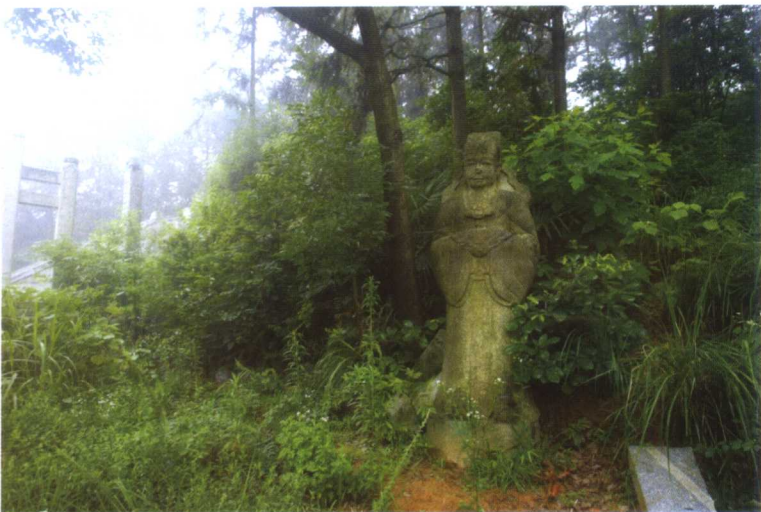
墓地仅存的一尊石人