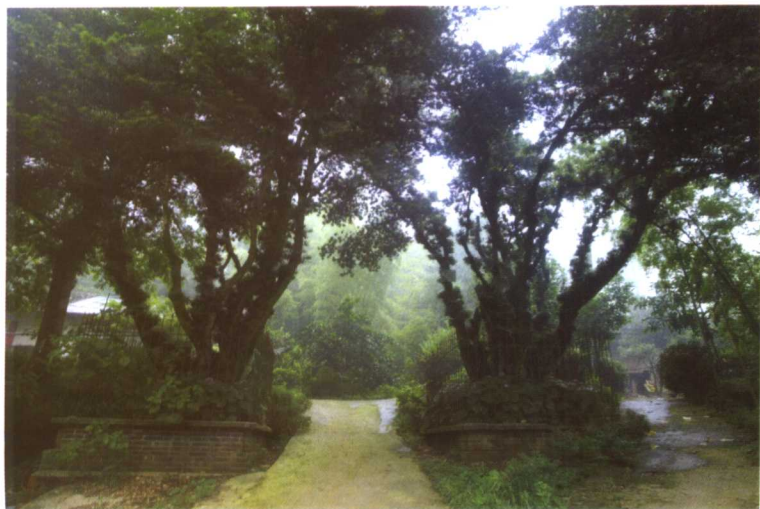
墓地伏龙山脚两株罗汉果树，据说是建墓时栽种的。