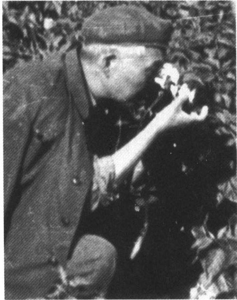
裘先生在河北野外调查 Prof. Chiu worked in field during 1973