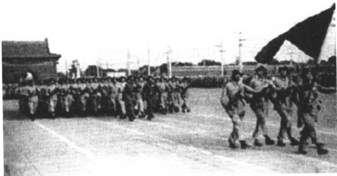
雄赳赳的步兵分列式

写决心书,要参加受阅。指战员不分预备队员和正式队员都一样,在烈日炎炎下挥汗如雨,刻苦训练,皮肤都被晒黑了,有