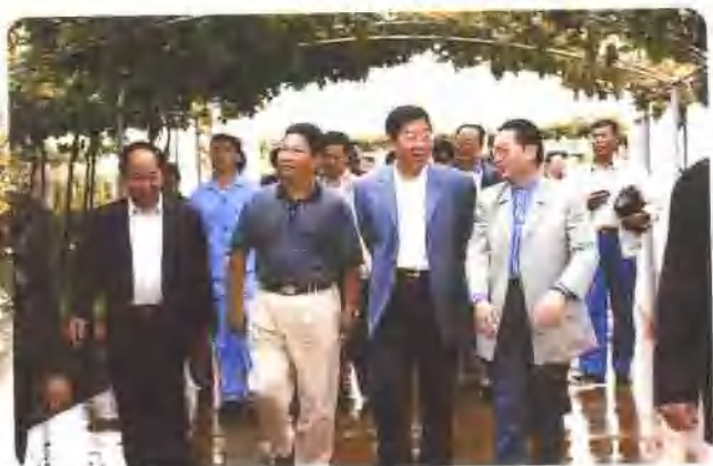
省委书记白恩培视察“云南红”葡萄基地