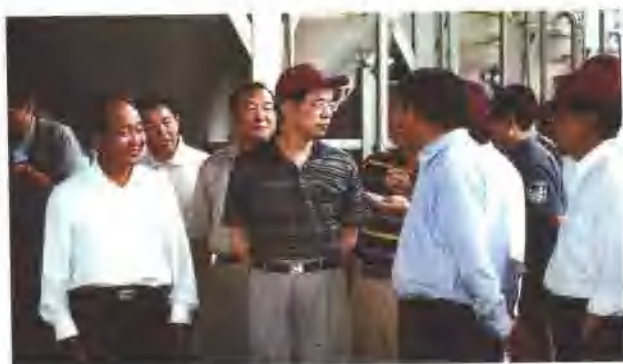
省长徐荣凯视察“云南红”酒厂

主任：保文生 副主任：张天荣 地址：弥勒县仕金街215号（县政府大院） 电话：0873-6137124 邮编：652300