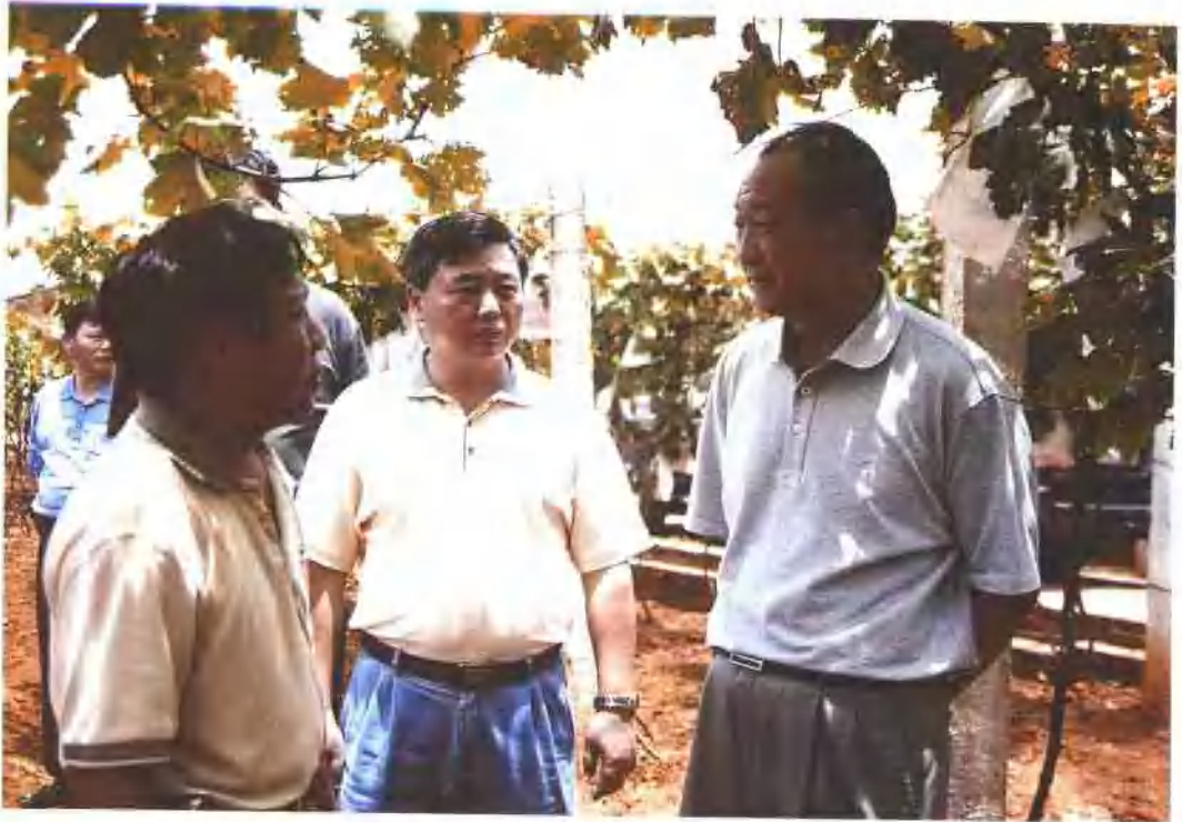
云南省副省长孔垂柱（右一）到弥勒调研非公经济（2003.7.9）